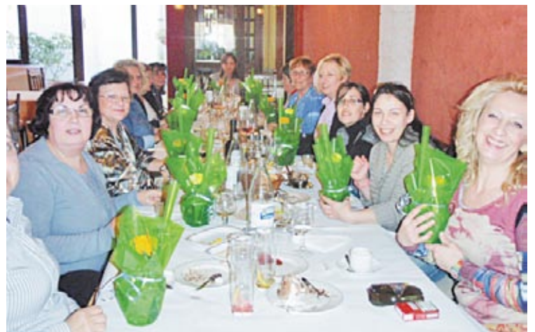
Las trabajadoras recibieron una flor como obsequio.

La incubadora de Grupo Sada de Sástago invitó a sus empleadas el pasado 8 de marzo a celebrar el “Día de la Mujer