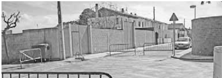
El pavimento ya se ha reparado en algunos puntos.