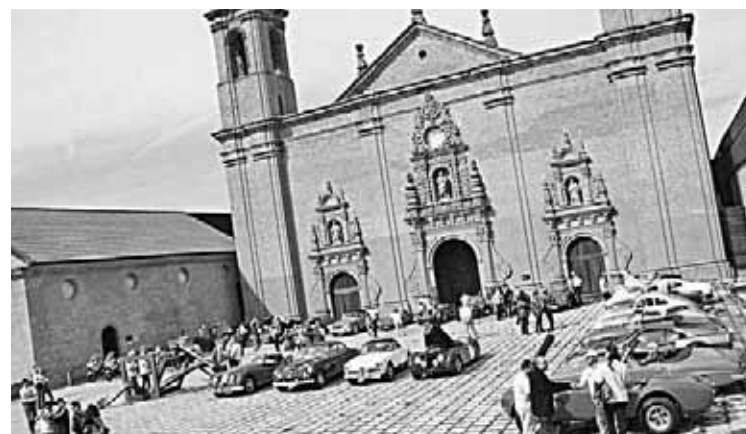
Imagen de la pasada edición.

cuyo objetivo principal no es otro que el de mostrar al público una valiosa selección de joyas sobre ruedas, además de difundir los bellos parajes de la Comunidad Autónoma y sus acogedores establecimientos de la Red de Hospederías. Del mismo modo, este original y vistoso Rally volverá a contar con el máximo apoyo de Turismo Aragón, sociedad dependiente del Departamento de Economía y Empleo del Gobierno de Aragón. Elevada a categoría internacional desde hace dos años, esta sexta edición volverá a contar con la presencia de equipos procedentes del extranjero, para lo que la AACD está contactando con afamados coleccionistas de Italia, Francia o Gran Bretaña entre otros países. Pero, por supuesto, la mayor representación será nacional, con inscripciones de diversos puntos de España. Para más información: www.aacd.es