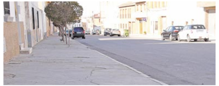
La obra ha sido muy demandada por los vecinos.