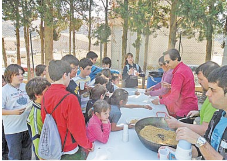
La jornada concluyó con unas migas para los participantes.

También hubo una sesión de iniciación a la escalada, donde los niños sujetos con arneses y cuerdas treparon por el rocódromo.