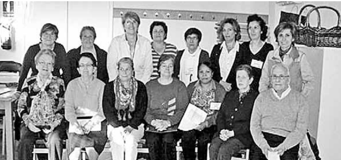
Las sesiones de formación tienen lugar en Gelsa.

Partiendo de la experiencia del Programa "Cuidarte" implantado por el Instituto Aragonés de Servicios Sociales, y contando con el apoyo de la Comarca Ribera Baja del Ebro, dos de las profesionales de los Servicios Sociales han aprovechado la oportunidad que se ha brindado a algunas Comarcas para formarse en dicho Programa y ponerlo en marcha en esta zona. A través del Programa "Cuidarte" se pretende crear un espacio de