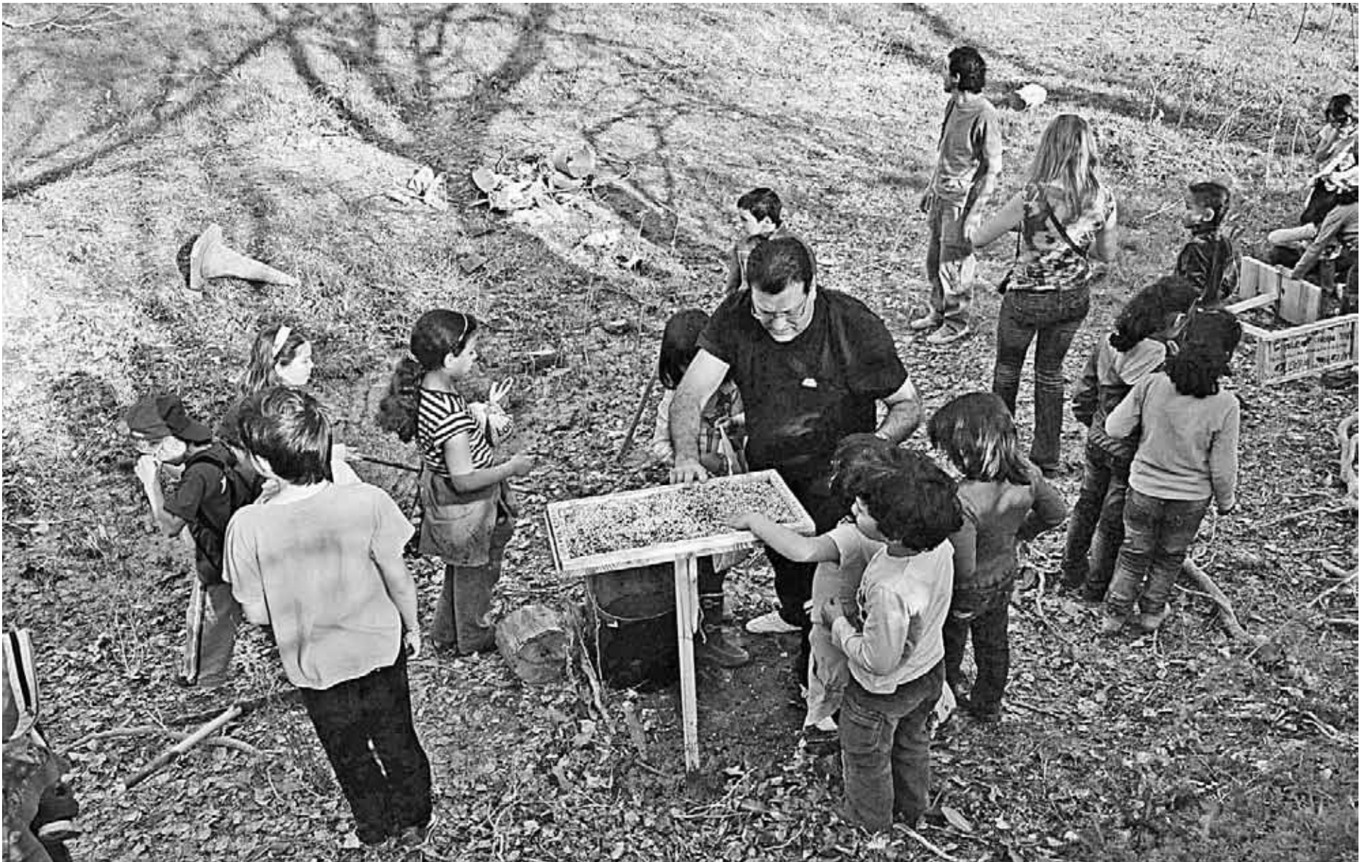
Colocación de comederos en el Galacho de El Burgo de Ebro.

La iniciativa del voluntariado medioambiental en El Burgo surge después de muchas charlas entre los monitores del Espacio Joven y de la Ludoteca sobre el amor que le debemos tener a la naturaleza y la responsabilidad que, como seres humanos, tenemos ante ella; sentíamos la necesidad de hacer algo por el entorno que nos rodea y por ello decidimos poner toda la ilusión de la que éramos capaces