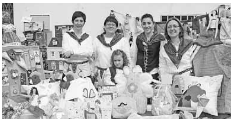
El mercadillo volverá a reunir a numerosos comerciantes de Fuentes.

El Ayuntamiento de Fuentes de Ebro considera muy positiva la labor que desarrolla la Asociación para dar a conocer los muy diversos recursos relacionados con los comercios y servicios del municipio. Tenemos que ser conscientes de que el sector terciario es el sector que más puestos de trabajo crea cada año de un modo estable. Por eso, el Mercadillo es un excelente escaparate para mostrar no sólo los servicios sino también para humanizar los negocios. Lejos de las grandes superficies, los negocios de nuestro municipio ofrecen profesionales cualificados y experimentados para ofrecer al cliente lo que necesita. Es un buen modo de abrir puertas a nuevos clientes, pero también de ofrecer calidad, servicio y confianza para que dichos clientes vuelvan a nuestro municipio a cubrir sus necesidades.