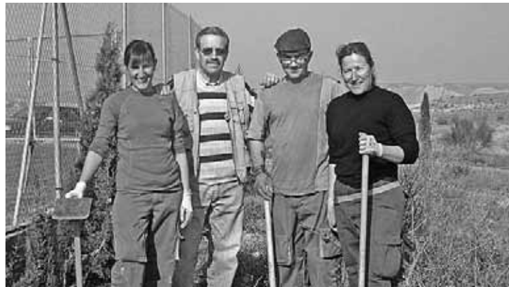
La brigada ha realizado trabajos en varios municipios.

Las tres personas que han conformado la brigada han realizado diversos trabajos en Cinco Olivas, La Zaida, Gelsa, Alforque y Alborge durante los últimos cinco meses