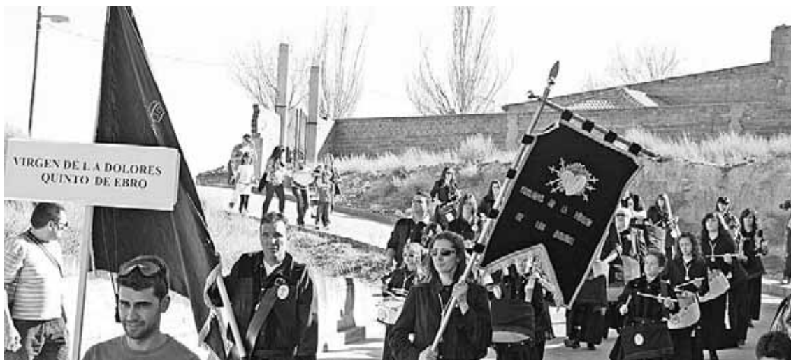
El grupo de Quinto participó en el encuentro.

El pasado sábado día 24 de marzo se celebró en Escatrón el XIV encuentro de tambores, bombos y cornetas del bajo Aragón zaragozano.