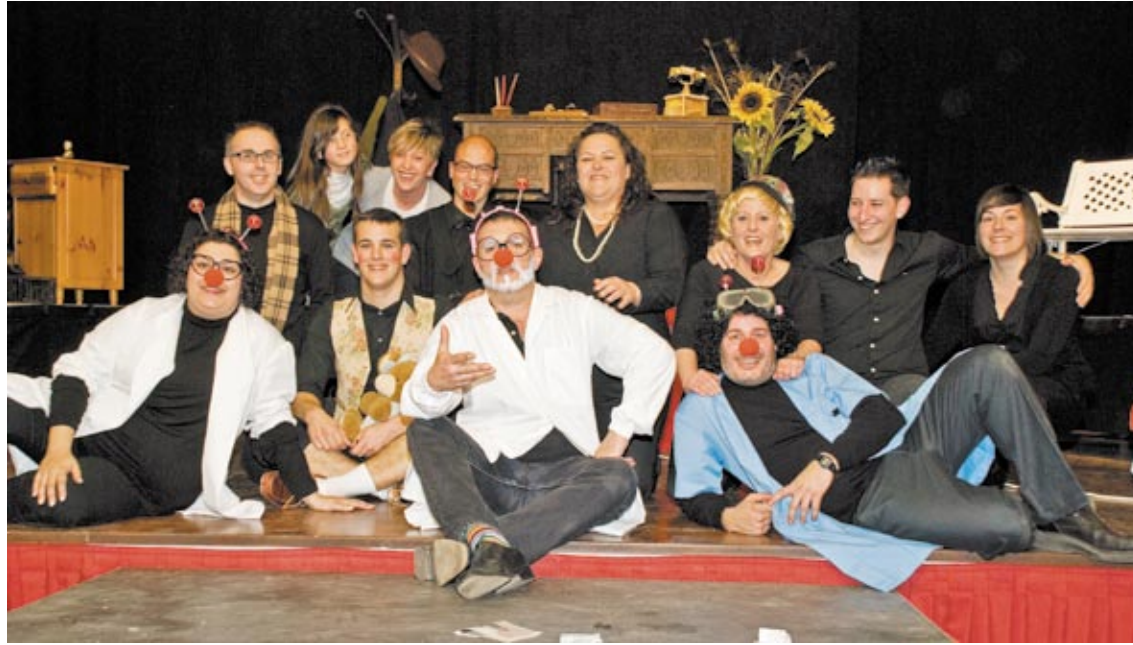
El Quintus Teatrae preparó un montaje sobre la vida de Jardiel Poncela.