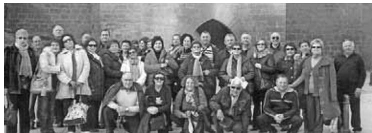
Un grupo numeroso asistió al viaje.

La asociación de mujeres Virgen de Matamala de Quinto organizó el pasado fin de semana del 3 y 4 de marzo un viaje que comenzó en Olite donde se visitó su famoso castillo y el casco antiguo del municipio. Después, le llegó el turno a Pamplona, donde hicieron el recorrido del encierro de San Fermín.