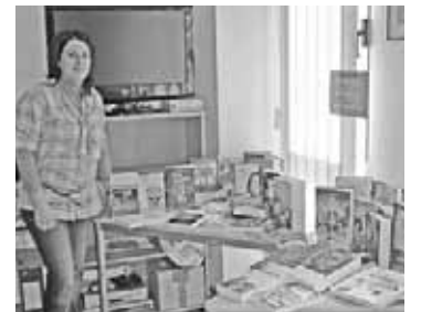
Novelas para todos los gustos en la biblioteca.

La biblioteca de Velilla de Ebro ha actualizado este mes las novedades literarias de la biblioteca, por lo que los usuarios y vecinos de la localidad tienen a su disposición una amplia gama de novelas para todos los gustos y todas las edades que pueden comenzar a leer cuando deseen.