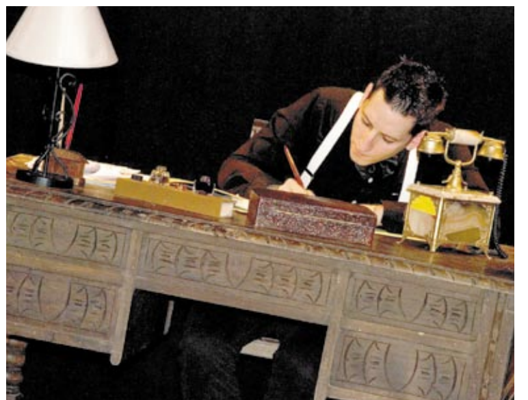
El jurado valoró la creatividad y el esfuerzo otorgando varias menciones especiales.