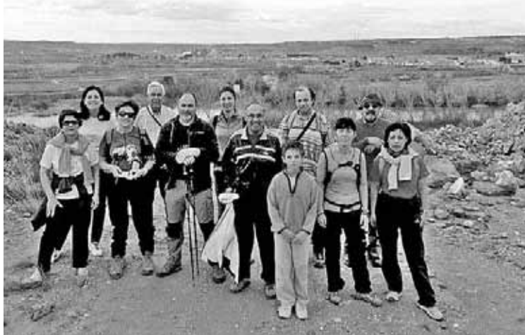
La ruta tuvo una longitud de 12 Kilómetros.

El punto de encuentro de los asistentes fue la plaza del Ayun- tamiento de Velilla a las 9.00 horas y, al finalizar el recorrido, tuvo lugar un avituallamiento que sirvió para reponer fuerzas.