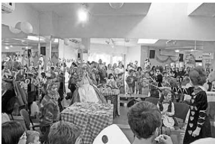
Los disfraces temáticos fueron los que más triunfaron.

El pasado 10 de marzo, el Centro de Tiempo Libre 'El Pinar' de Escatrón celebró en su ludoteca una fiesta de carnaval infantil. Este año, además, se estrenó la ampliación del centro con la nueva sala de espejos.