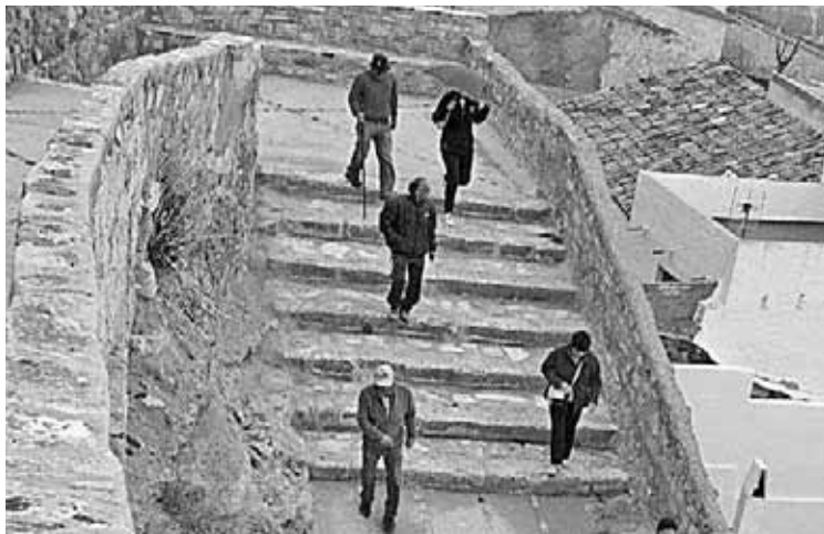
Los participantes recorrieron los puntos más emblemáticos de Velilla.