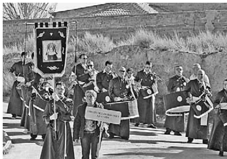
La cofradía de La Zaida no quiso perderse el evento.