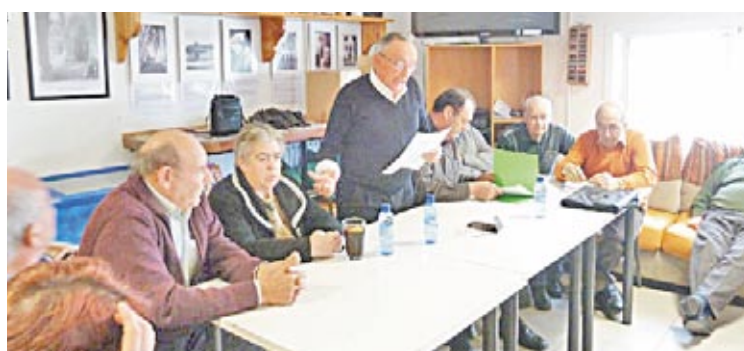
Numerosos socios acudieron al cambio de junta.