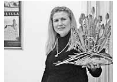
La demostración de centros de flores, todo un éxito.

de centros de flores. El día de San Jose lo celebraron también con una partida de bolos, café y bingo.