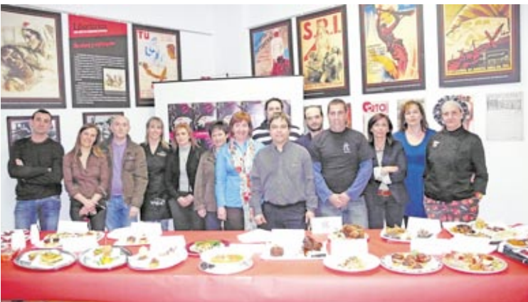
Los participantes, contentos con el resultado de las jornadas.

El municipio de Fuentes ha promocionado durante dos semanas los productos cárnicos del cerdo, en colaboración con las carnicerías y la hostelería del municipio.