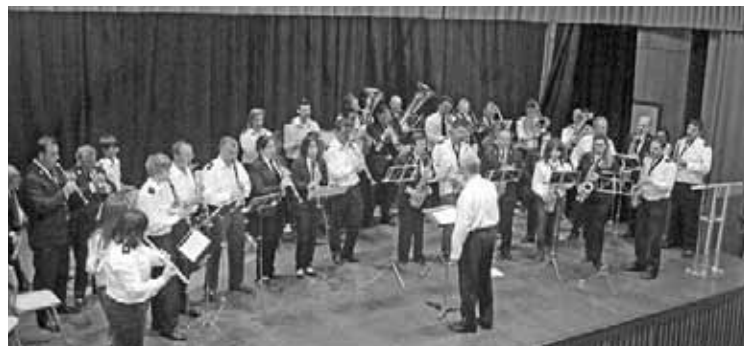
Las bandas de Quinto y Gelsa tocaron varias piezas de forma conjunta.

El pasado 11 de marzo tuvo lugar en Quinto el V concierto de "bandas en marcha", un encuentro promovido por la DPZ y organizado por el Ayuntamiento de Quinto, que pretende fomentar el intercambio y el hermanamiento entre bandas de música. Actuaron por separado las bandas