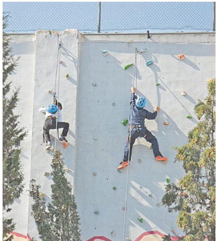
Los más atrevidos probaron a escalar en el rocódromo.

El día, absolutamente primaveral, y las migas que se repartieron para reponer fuerzas al final de la mañana, hicieron que la jornada fuera todo un éxito.