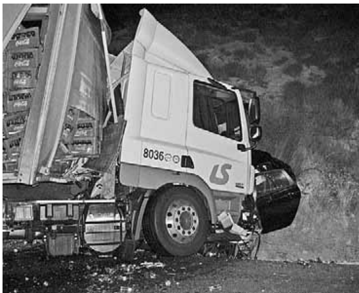
Accidente de un camión en la N-II hace unos meses.