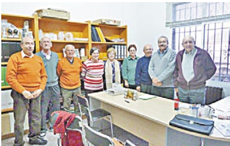
Imagen de la nueva junta.

El pasado día 10 de marzo se celebró, en los salones de la Tercera Edad de Sástago, una asamblea general con un único punto del día, la elección de nuevo presidente de la entidad.