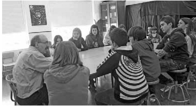
Los jóvenes dinamizadores se reunieron en la comarca de Jiloca

Noventa jóvenes de 14 a 18 años, se dieron cita en el CRIET de Calamocha, donde llevaron a cabo talleres de formación que complementan su tarea como informadores juveniles y dinamizadores locales. Además, se visitó a un emprendedor joven de la zona, acción que permite trasladar a los jóvenes la importancia de poner en marcha proyectos empresariales en el medio rural. El domingo 11 de marzo salieron a la calle, y acompañados de la charanga de Monreal del Campo, los jóvenes organizaron actividades y talleres para los más pequeños en el parque de Calamocha. El otro Encuentro, con un grupo de