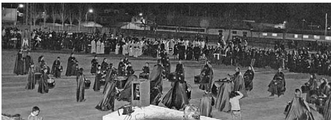
La exhibición duró casi cuatro horas y congregó a numeroso público.