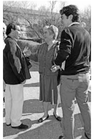
La alcaldesa de Sástago los recibió en Rueda.

Por último, Bermúdez de Castro dijo "respetar" la decisión de instaurar el copago sanitario en Cataluña, pero descartó que el Gobierno de Aragón tenga en mente llevar a cabo nada similar.