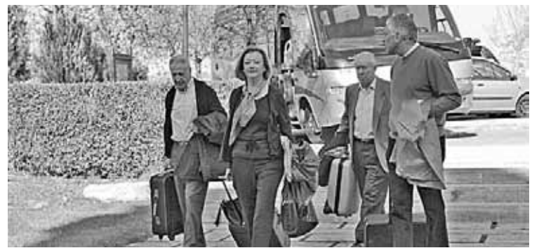
Los consejeros llegaron a Rueda en autobús.