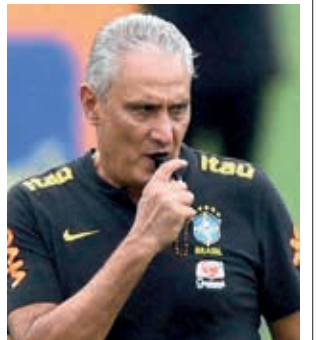
El DT de Brasil, Tite.

"Antes de divulgar la lista, quiero hacer una