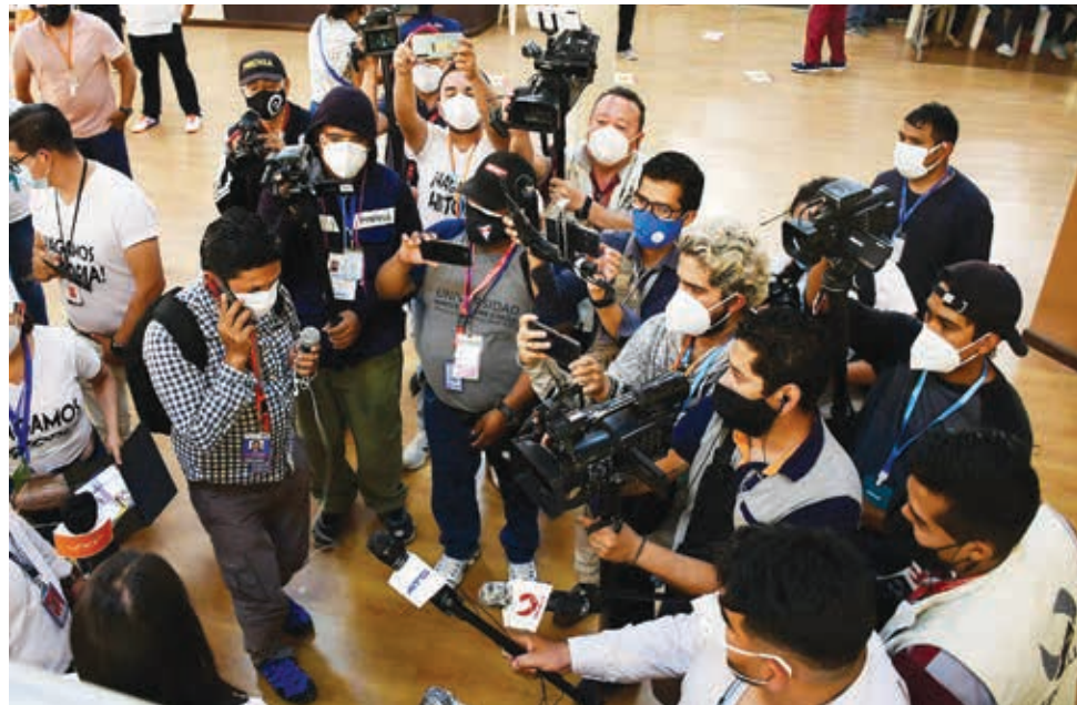
Trabajadores de la prensa durante una cobertura en Cochabamba.

Según el observatorio, en los casos de estigmatización, quienes más lo cometen son exautoridades de gobierno como el expresidente Evo Morales, el exvicepresidente Álvaro García Linera y Juan Ramón Quintana.