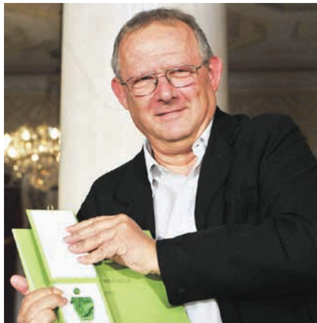
Distinguido. El periodista polaco Adam Michnik.