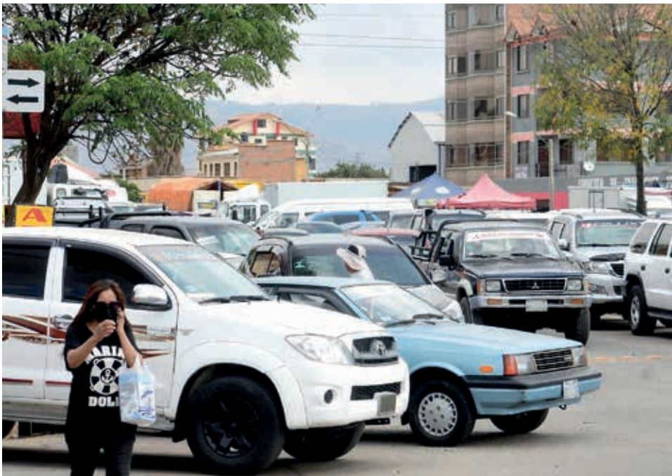
La oferta de motorizados en la autoventa de la avenida Beijing casi Ustáriz. CARLOS LOPEZ