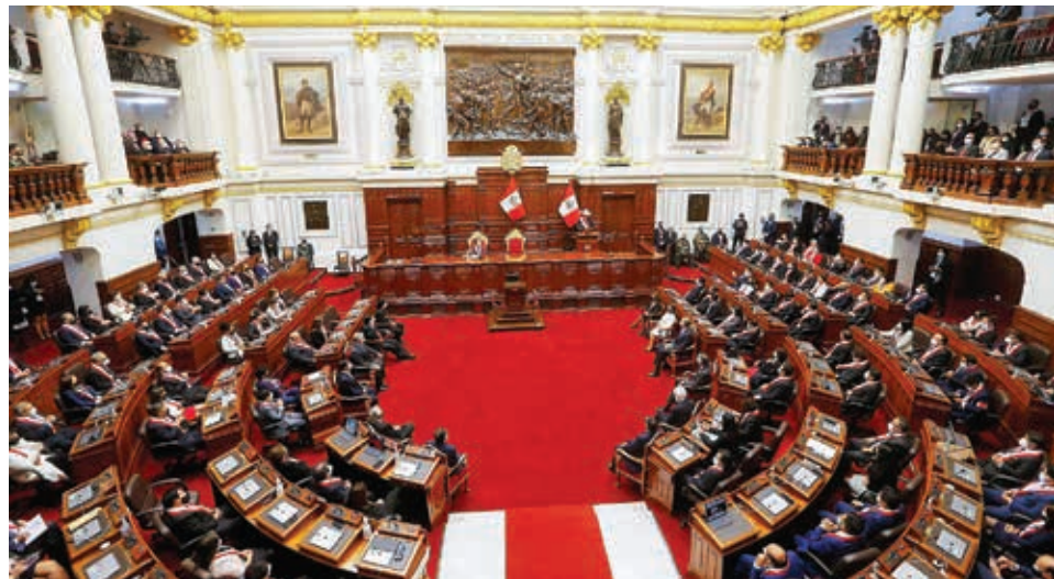
El hemicycleo del Congreso de la República de Perú.

Respecto del último grupo en renunciar, el secretario general de Perú Libre, Vladimir Cerrón, comentó en su cuenta de Twitter que el partido "no se afecta por disidencia de sus