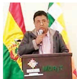
Ministro de Desarrollo Rural, Remy Gonzales.

Con el objetivo de fortalecer la producción y el consumo de quinua, el Centro Internacional de la Quinua (CIQ), que depende del Ministerio de Desarrollo Rural y Tierras, y el Consejo Regulador para la Denominación de Origen de Quinua Real Orgánica del