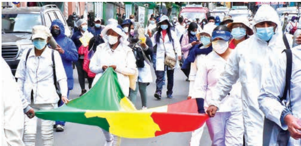
Marcha de protesta de un grupo de médicos en Cochabamba. APG

Ultimátum. Los galenos dieron plazo hasta el 18 de mayo para analizar sus peticiones, caso contrario suspenderán atención el día 20