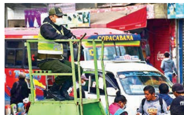
Una torre de control en el mercado La Pampa.

Se conoce que en los mercados existen descuidistas, lanceras, carteristas o personas dedicadas a robar carteras y celulares o joyas de las personas.