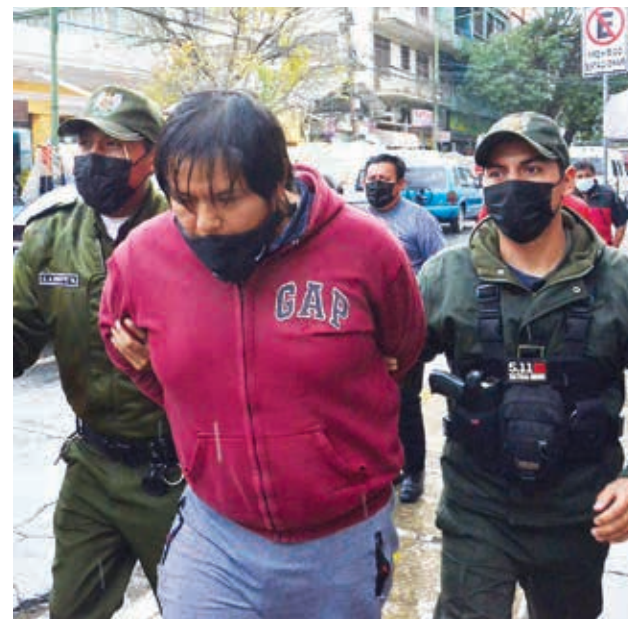
Uno de los implicados conducido a la audiencia, ayer.