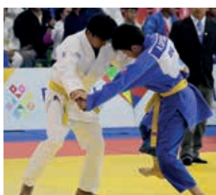
Judocas en competencia nacional (archivo). J. ROCHA

El conflicto entre la FBJ y el judo valluno pasa por un