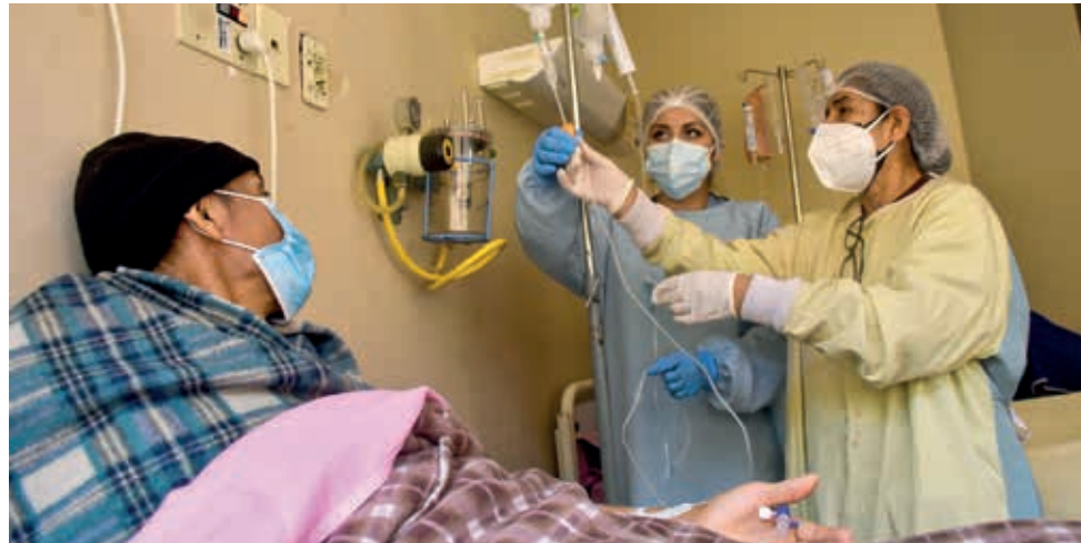
Enfermeras en su trabajo en el hospital Viedma, que tiene 350 profesionales.