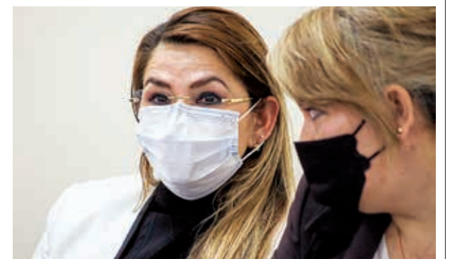
La expresidenta Jeanine Áñez.

“A partir de esa resolución y en la notificación con esa resolución, el tribunal remite estos antecedentes al TCP, donde la comisión de juicio en un plazo de 10 días verá si es que ingresa o no a esta acción de inconstitucionalidad concreta a efectos de evidenciarse si se resuelve esto o no”, afirmó.