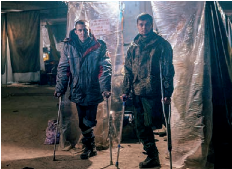
Mutilados de guerra en la acería Azovstal de Mariúpol, ayer.

Según el general, más de 90.000 personas se encontrarían retenidas en Kramatorsk —considerada la principal plaza del Ejército ucraniano en la región de Donetsk—, y Slaviansk, incluido los recintos de una decena de fábricas y empresas.