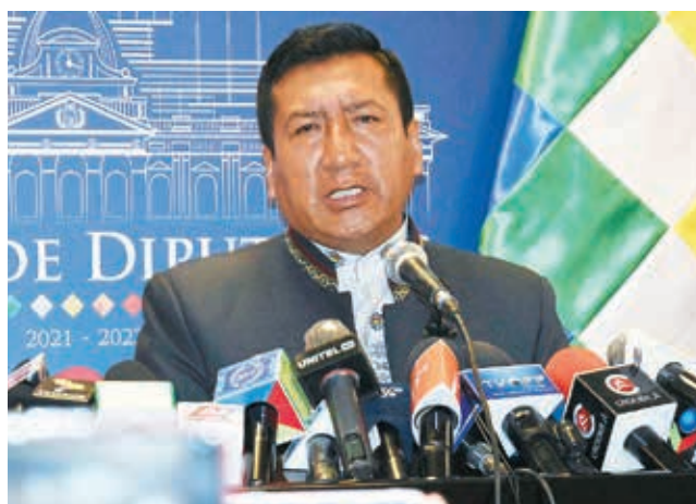
Freddy Mamani, presidente de la Cámara de Diputados.

“Ha habido un hecho criminal y esos señores deben ser juzgados como corresponde con todo el peso de la ley”, sostuvo Mamani sobre los responsables que detonaron una granada de gas durante una asamblea estudiantil en la universidad potosina, que