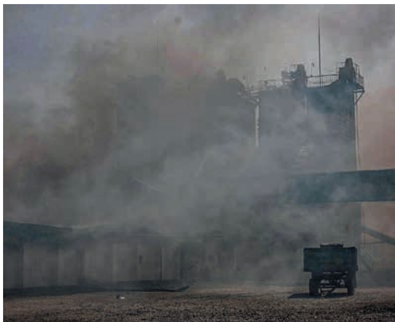
Silos de granos bombardeados por los rusos en Orikhiv, ayer.

hasta ahora 32,6 millones de metros cúbicos de gas al día, lo que supone un tercio del total que Ucrania transporta hasta Europa.