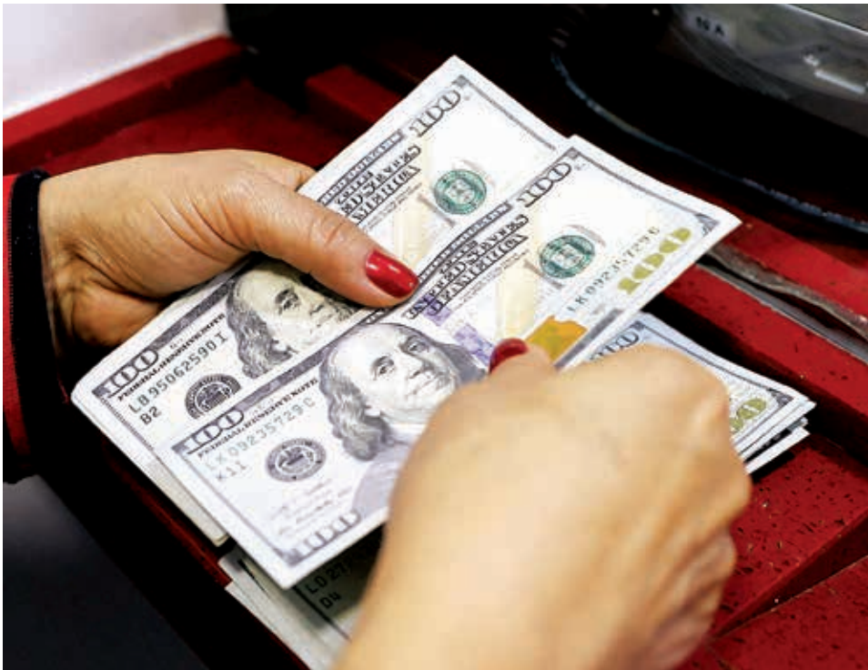
Movimiento de billetes en dólares americanos.