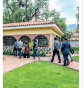
El lugar para el “cowork”, en el norte. GAMC