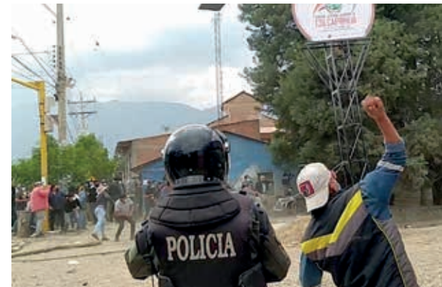
El conflicto entre Colcapirhua y Quillacollo. LOS TIEMPOS

Tensión. Los vecinos de la OTB Rosedally del río Chijllawiri instalaron vigili- as en la zona en conflicto denunciando avasallamiento