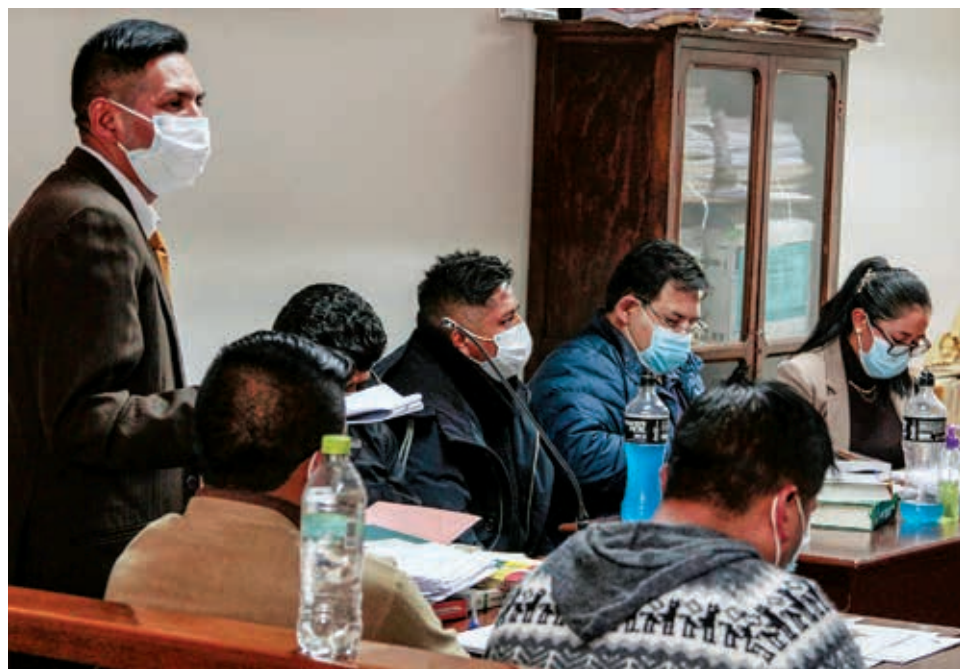
Audiencia de medidas cautelares en Potosí, ayer. MARKA REGISTRADA

La tragedia se registró el lunes 9 de mayo, cuando se realizaba una asamblea para aprobar la convocatoria de elecciones de la Federa-