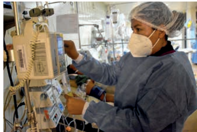
Las enfermeras redoblan esfuerzos en los hospitales. JOSE ROCHA

Sejas dijo que en otros departamentos hay un incremento vegetativo en clínicas de manera notoria, pe-