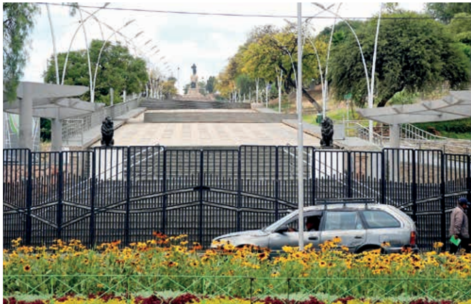
Vista exterior de la nueva Coronilla, aún restringida para el público. CARLOS LOPEZ

Se intervino la parte paisajística y áreas verdes con sistemas de riego e iluminación moderna para brindar seguridad al visitante. Cuenta con dos accesos que tienen rampas y gradas en la parte norte y en el sector sur. El proyecto tiene tres componentes: infraestructura, supervisión y desarrollo comunitario.