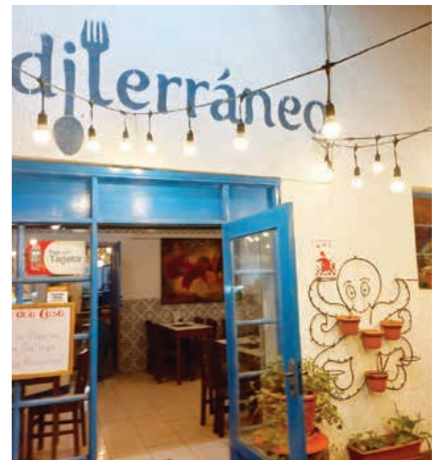
Arte. Frontis del restaurante Mediterráneo, donde se exhibirán algunos de los lienzos.

Instituidos en 1981, estos galardones están dotados con 50 mil euros y una escultura creada por el fallecido artista catalán Joan Miró.