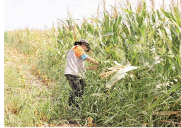
Producción de maíz destinado al sector pecuario.

Alimentos. Datos oficiales estiman que la producción superará el millón de toneladas. La CAO dice que la sequía afectó la cosecha