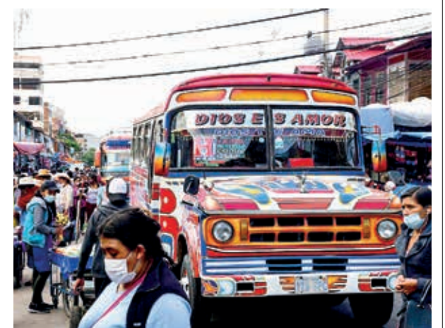
El servicio del transporte público en la ciudad. CARLOS LOPEZ

Dijo que el pasaje es el mismo desde hace siete años, por lo que corresponde realizar el análisis. Y añadió que su sector también presentará su propuesta para contrarrestar el estudio.