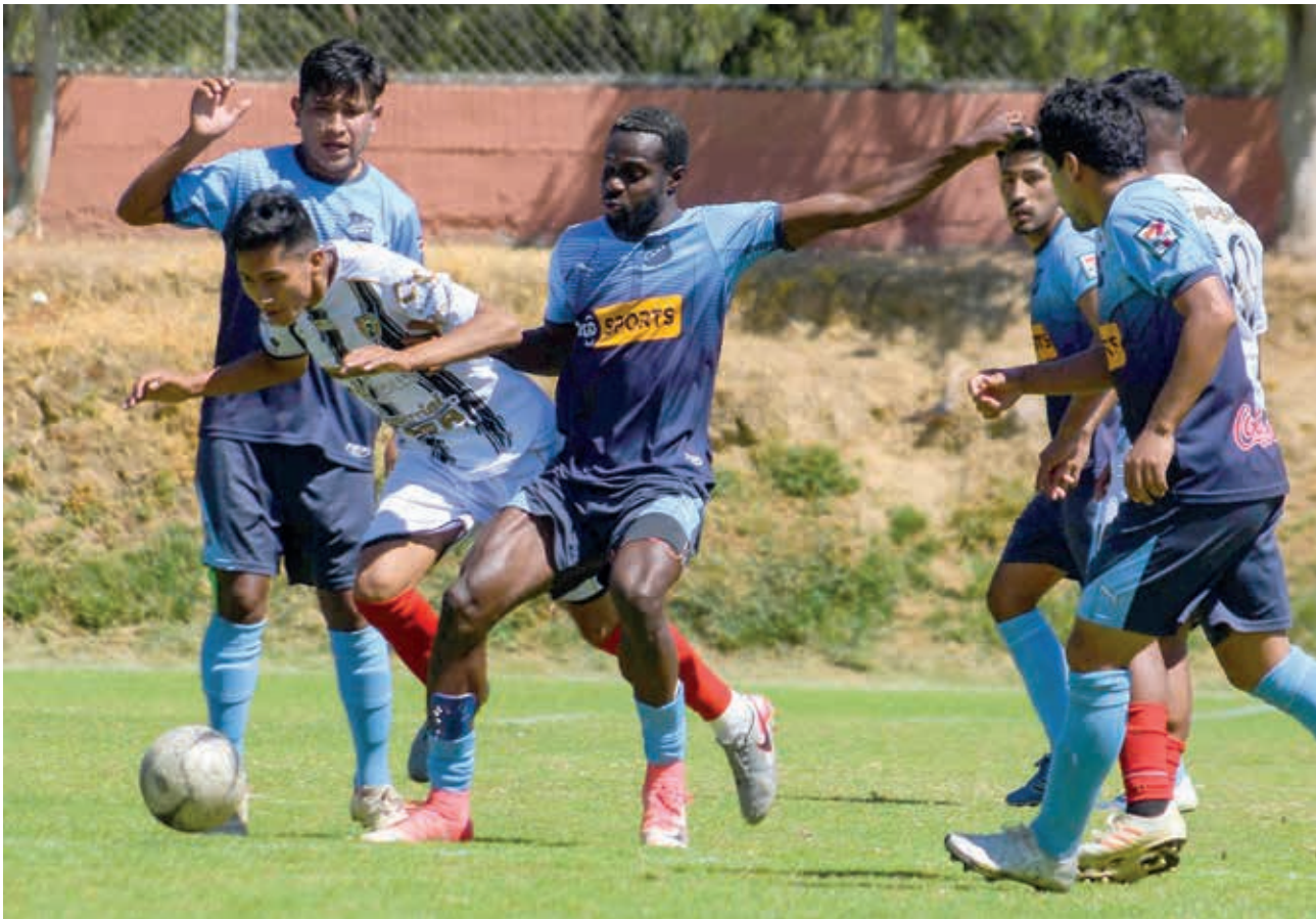
Partido entre Cochabamba FC y Municipal Colcapirhua, por el torneo 2021 de la Primera "A" de la AFC.

Fútbol. Los 16 integrantes de la Primera "A" darán vida a la primera fase del torneo nacional y a la actividad en el valle