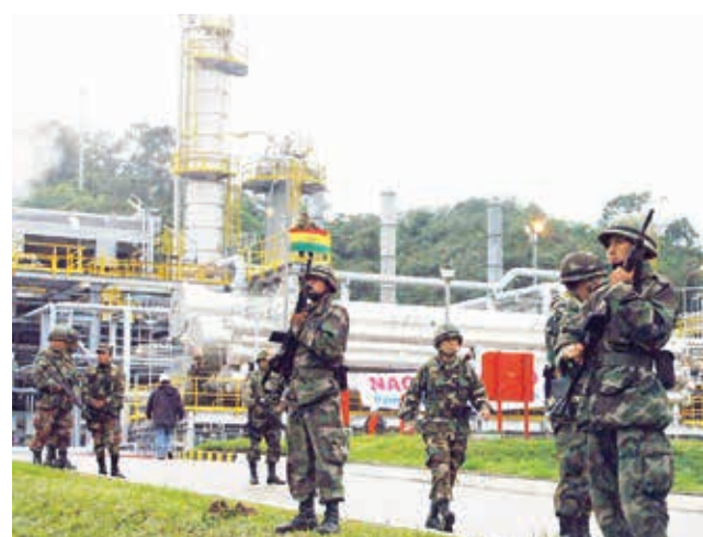
El gobierno del MAS nacionalizó los hidrocarburos.

Hidrocarburos. Una modificación impositiva debe ser discutida con universidades y regiones, señaló el presidente de la estatal YPFB.