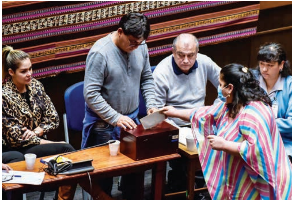
Asambleístas nacionales emiten su voto para elegir al defensor del pueblo.