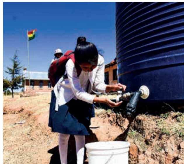
La escuela y la posta de salud racionan el agua de cisterna.