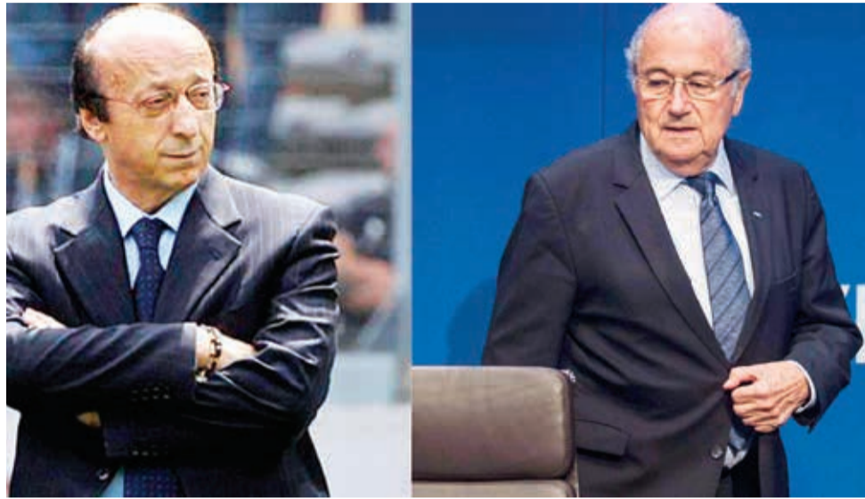
Luciano Moggi (izq.), exdirector deportivo de Juventus, y Joseph Blatter, expresidente de la FIFA.