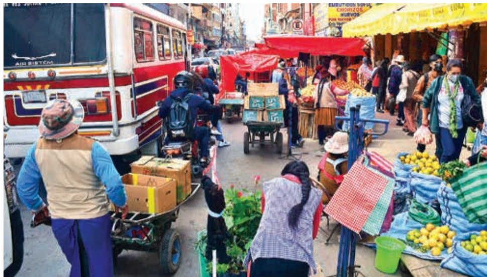
Comerciantes venden sus productos en las aceras, ayer.

En la investigación, el Ceres identificó dos fenómenos muy extendidos en el país, “el alto grado de informalidad económica y el reducido universo de contribuyentes en Bolivia”.