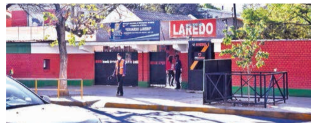
Infraestructura. Frontis del colegio San Agustín y el Instituto Eduardo Laredo, en Cochabamba.

mostrar previamente, alguna "condición peculiar" para resolver problemas de matemática; en el caso del Laredo, algo de talento e inclinación "natural" al arte. Esa peculiaridad exigida con antelación, por las características de estos colegios, garantiza parcialmente, que los estudiantes que se admiten en estas instituciones rindan de acuerdo a las políticas educativas exigidas, o por lo menos, esos niños y/o jóvenes adolescentes, aprendices de brujo, hagan gala, aunque todavía precaria, de los primeros y básicos trucos que su condición exige y que la institución acredita.