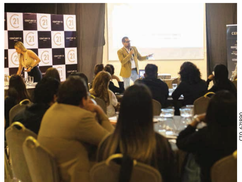
Crecimiento. Constante capacitación del equipo de Century 21.

El mercado inmobiliario en Cochabamba se ha comportado de manera muy parecida a lo que es el resto del país, también ha mudado a un mercado de inversionistas. La estabilidad macroeconómica de 2022 nos permitió tener un ticket promedio más elevado porque las transacciones eran más grandes que en 2023. El primer semestre de este año bajó un poco por la inestabilidad macroeconómica de