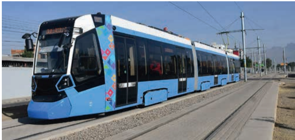
Actualmente, la línea verde conecta los municipios de Cercado y Quillacollo.

Escanee este QR para ver la ampliación de la línea roja www.lostiempos.com