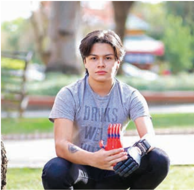
El cochabambino que fabrica la prótesis biónica. LOS TIEMPOS