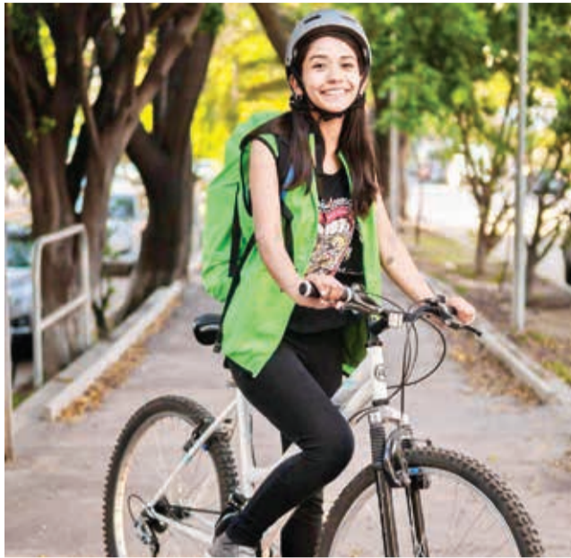
La bicicleta eléctrica fabricada en Cochabamba.