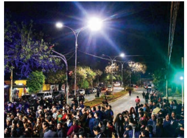
La av. Simón López con luminarias LED. CARLOS LOPEZ