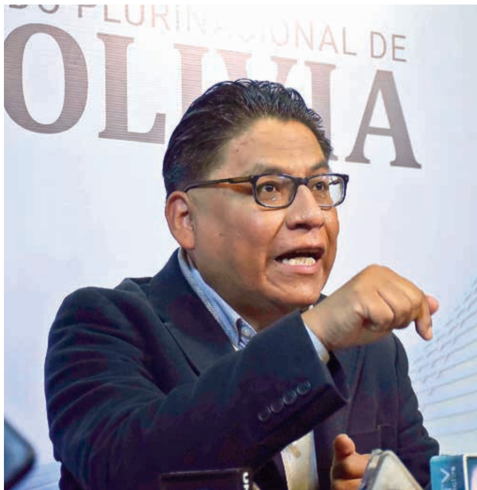
Iván Lima Magne, ministro de Justicia y Transparencia Institucional.

El TCP ha dejado sentado que se requiere dos tercios de votos. Esto es muy importante en términos políticos, porque obliga a cada jefe de partido político o de bancada a contribuir con un diálogo