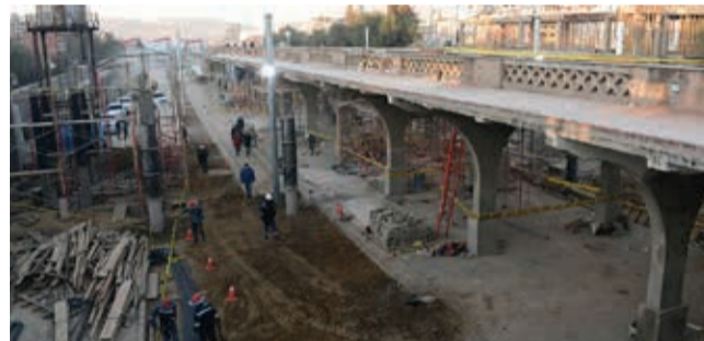
Los trabajos de ampliación de la línea roja, a La Cancha.