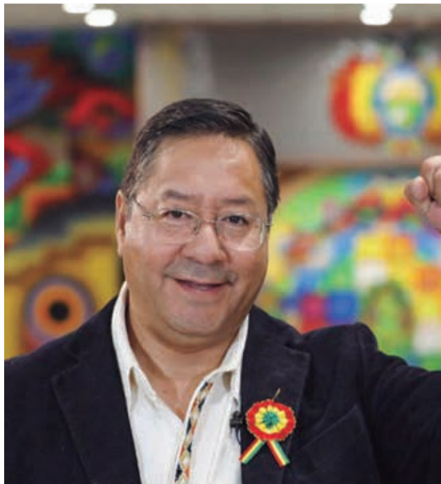
El presidente Luis Arce, en su discurso de ayer.

Por otro lado, Arce destacó el trabajo de las personas que viven en el exterior y envían remesas hacia Bolivia, algo que “contribuye de manera