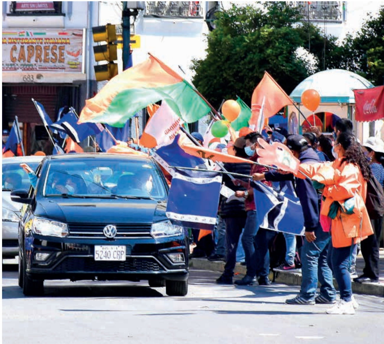
Partidos políticos en una anterior campaña electoral. Hoy están frente al reto de renovar y dejar el caudillismo.

“En la oposición hay una inercia bastante fuerte, siguen conmocionados por los cambios que se vivió, no reaccionan; por el contrario, atacan aspectos que ha aprovechado el ma-