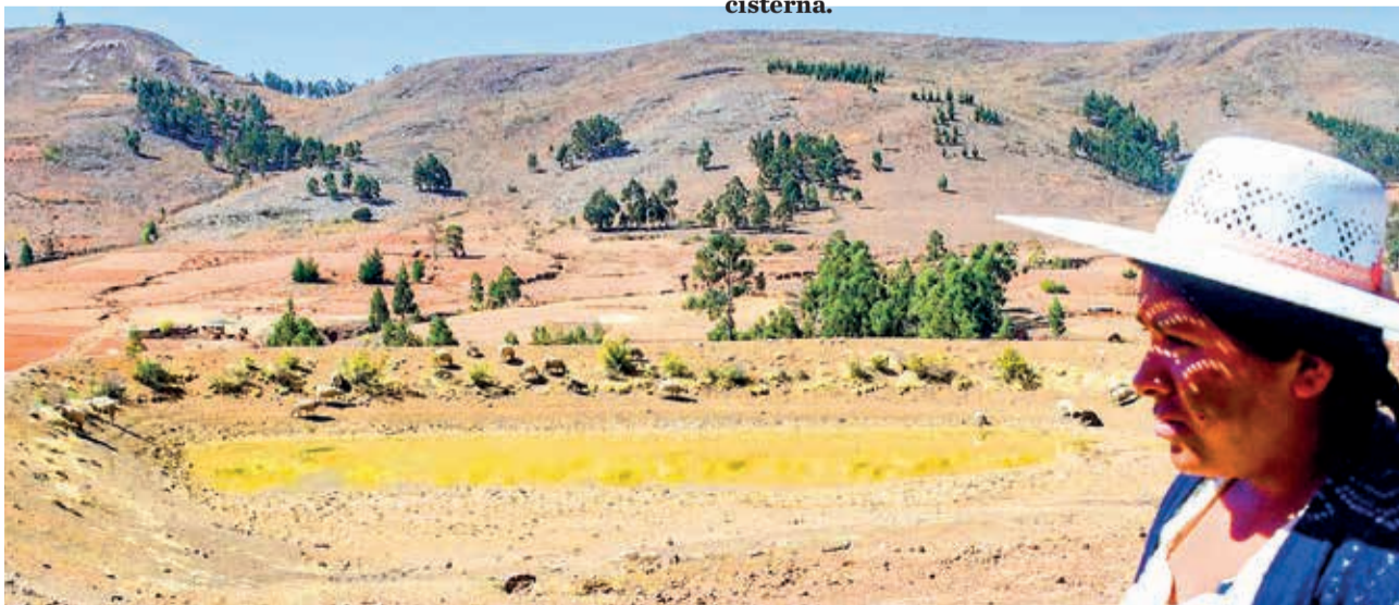
Una lugareña observa el atajado del que beben los animales, pero también las personas. CARLOS LÓPEZ