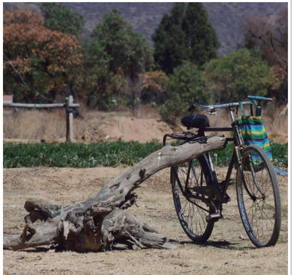
UNA BICICI SU APOYO. La bicicleta de un agricultor a la espera del retorno a casa está apoyada en un tronco en los campos de producción a orillas de La Angostura.

ENVÍENOS SUS FOTOS PARA PUBLICARLAS EN ESTA SECCIÓN: fotografia@lostiempos-bolivia.com