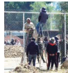
La zona de conflicto, en Sirpita, hace días.