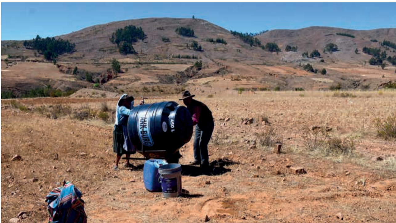
Comunarios de Torancali en Anzaldo acarrear agua para consumo por kilómetros ante la dura sequía.

“Tenemos un pozo del que estamos llevando dos veces a la semana agua a las comunidades que necesitan, pero eso no es suficiente, necesitamos ayuda porque somos un municipio con pocos recursos”, explicó. Entre tanto, desde la Gobernación se informó que la escasez de agua afecta a 40 municipios, por lo que se analiza una declaratoria de emergencia departamental.