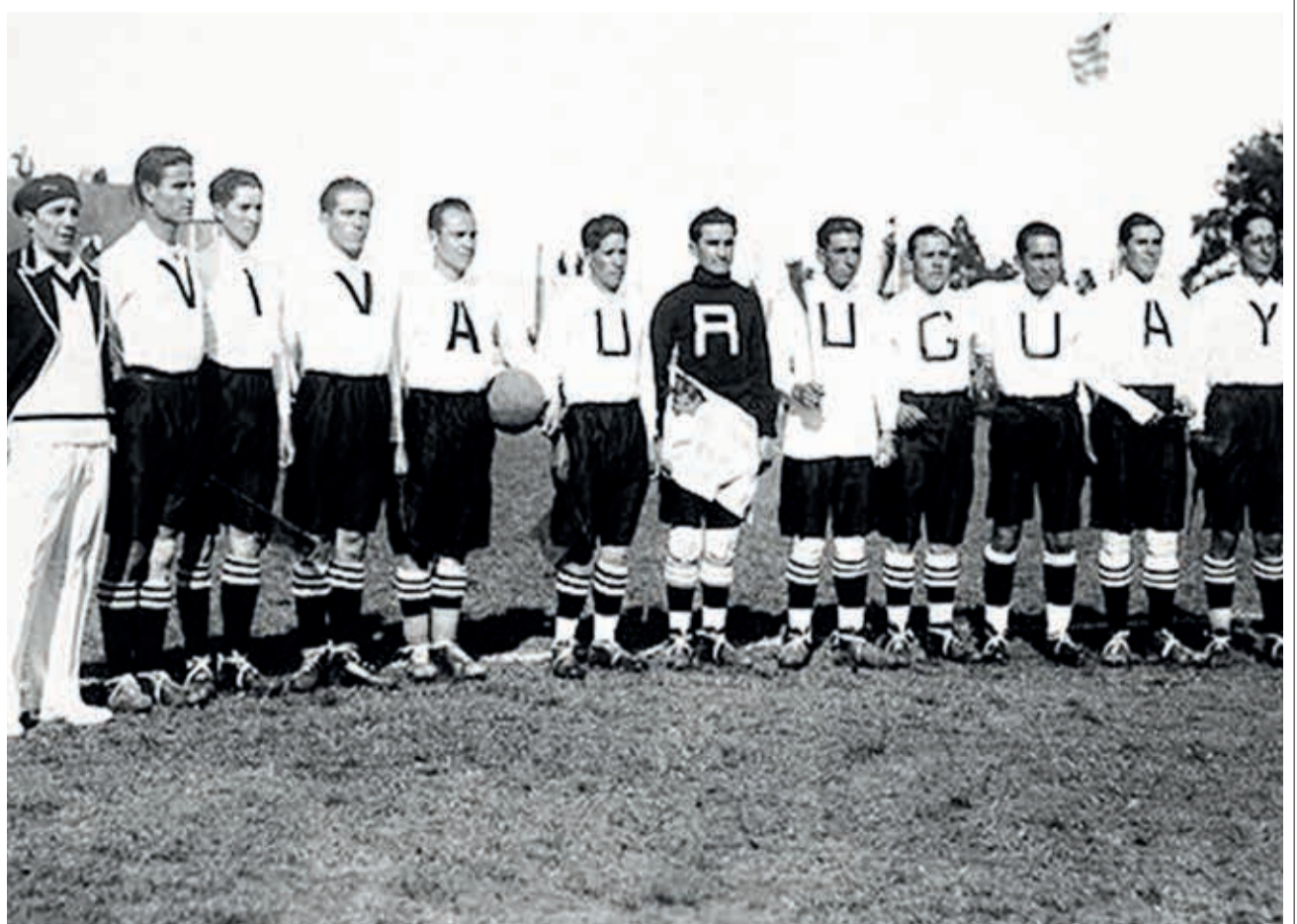
El once inicial de Bolivia en la Copa del Mundo Uruguay 1930, en el primer e histórico partido ante Yugoslavia, cotejo que se disputó en el estadio Parque Central de Montevideo, el 17 de julio de 1930. HISTORIA DEL FÚTBOL BOLIVIANO

Bolívar intentó emular y superar este hito en la Copa Sudamericana 2004, empero cayó 2-1 (global) en la definición ante Boca Juniors de Argentina.