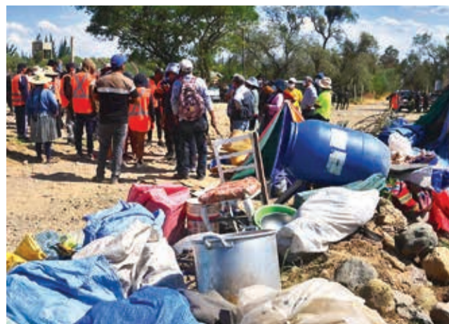
El desalojo del predio de Consarq en diciembre. D. JAMES

Después de varias acciones legales, se logró el desalojo de las 80 personas y se conti-