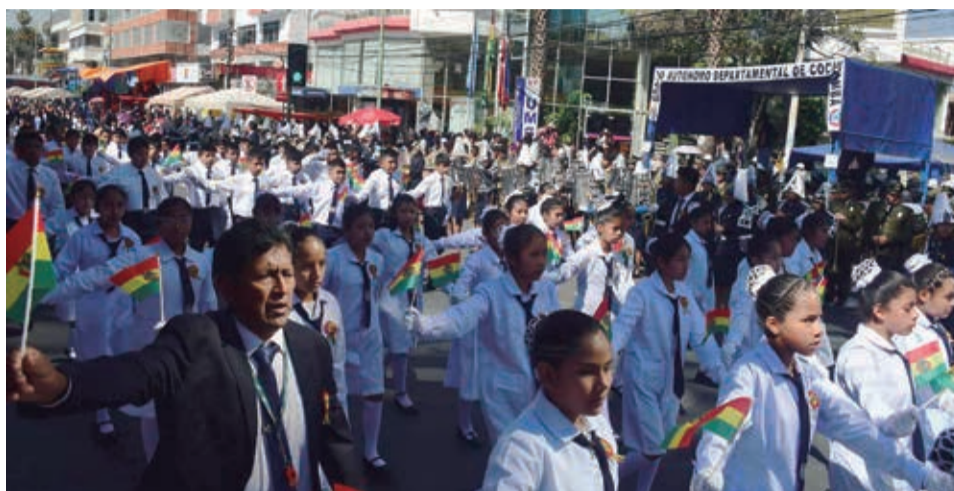
La ciudad se vistió de la tricolor con los desfiles escolares, ayer.

Por la tarde, la Asamblea Legislativa Departamental realizó una sesión de honor y entregó tres reconocimien-