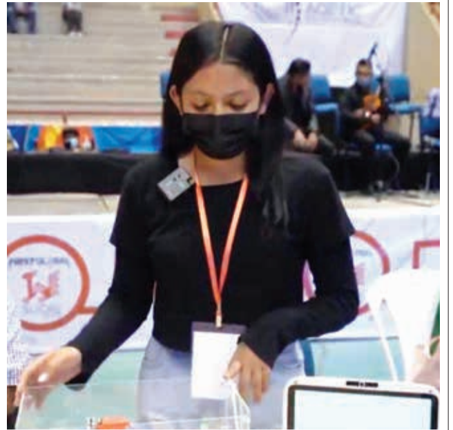
La adolescente que fabricó un respirador artificial. LT