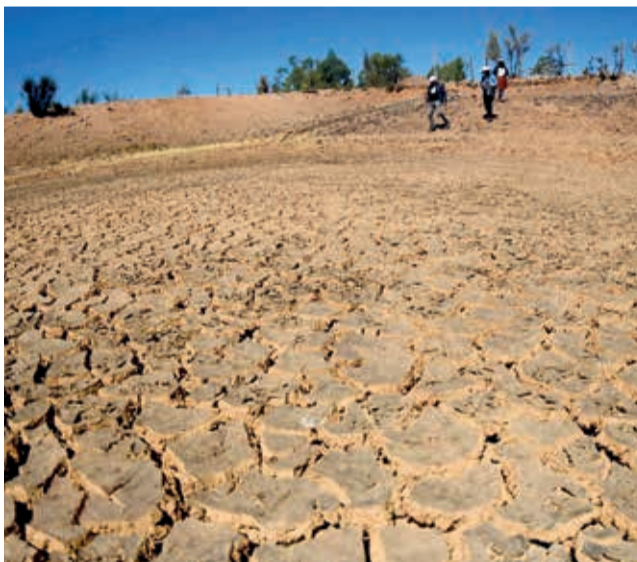
Uno de los atajados de Anzaldo, seco.

MULTIMEDIA: Escanee este QR para ver el video y galería de la nota. www.lostiempos.com