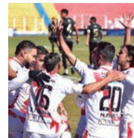
Celebración de jugadores de Nacional Potosí. APG