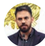
EDUARDO DEL CASTILLO MINISTRO DE GOBIERNO

Pese al acto para iniciar las obras aún no hay trabajos para el centro de radioterapia, porque se espera un acto con el Ministerio de Salud para comenzar la construcción.