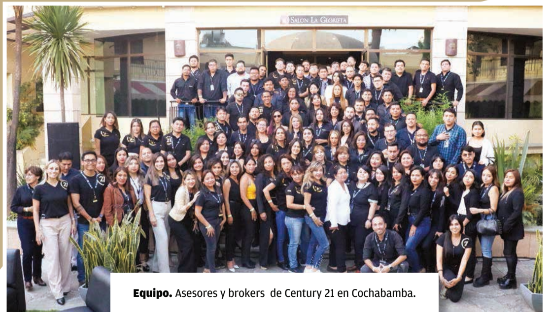
Equipo. Asesores y brokers de Century 21 en Cochabamba.

Expansión. La empresa, que es la red inmobiliaria más grande del país, cuenta con más de 1.100 agentes y más de 60 oficinas en el país