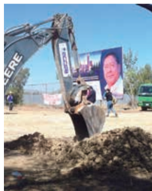
El área para el centro de radioterapia.

“Es lamentable siendo de que desde la Asamblea y el