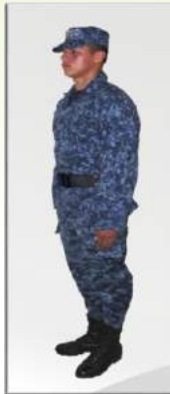
Uniforme Instituto Nacional Penitenciario y Carcelario] (INPEC)