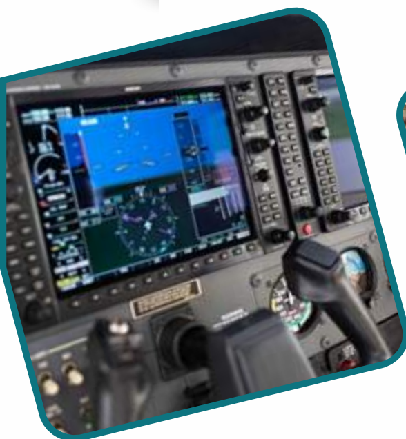
AERONAVE TIPO CESSNA 206B DONADA POR EL GOBIERNO DE EE.UU AL ÁREA DE AVIACIÓN POLICIAL PARA APOYAR LA LUCHA CONTRA EL NARCOTRÁFICO

El Grupo de Comercio Exterior nació de la necesidad de importar y/o exportar bienes provenientes del exterior para el Sector Defensa y demás Entidades Públicas que así lo requieran, reflejando el servicio con probidad que cada funcionario de la Entidad brinda a nuestras partes interesadas y consolidando al FORPO entre las mejores empresas del Grupo Social y Empresarial de la Defensa (GSED).