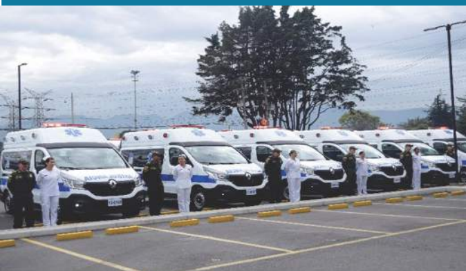
AMBULANCIAS 4X2 TERRESTRES TIPO TAB PARA EL TRANSPORTE ASISTENCIAL DE LOS INTEGRANTES DE LA POLICÍA NACIONAL.