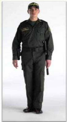
Uniforme de asistencia No.4