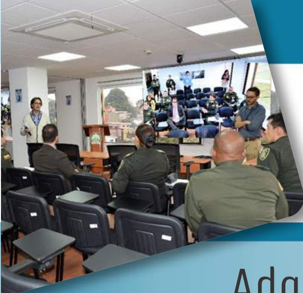
SALA MULTIPROPÓSITO FONDO ROTATORIO DE LA POLICÍA.