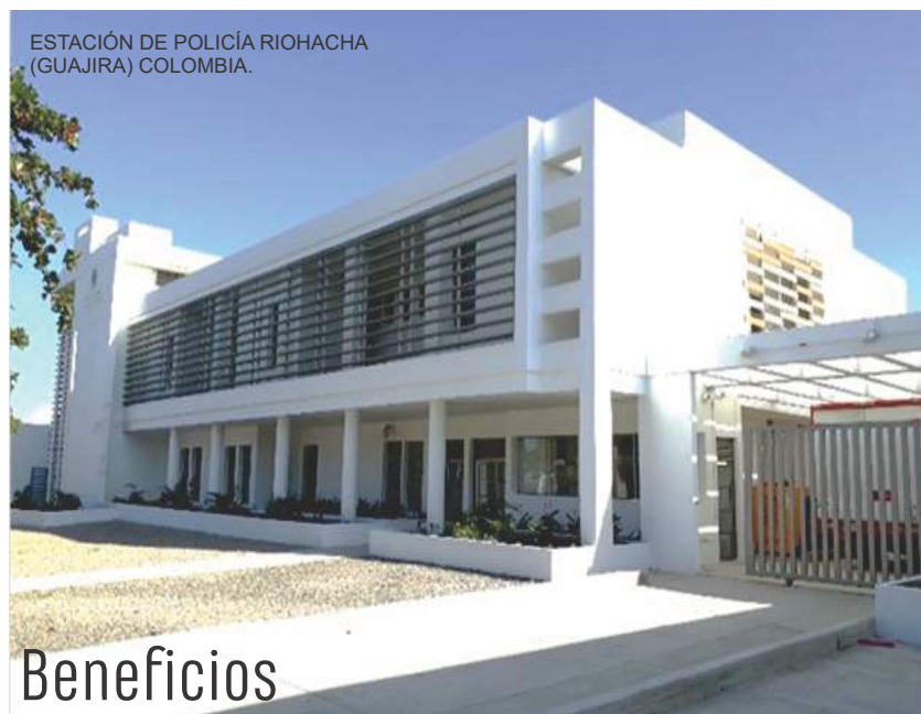
ESTACIÓN DE POLICÍA RIOHACHA (GUAJIRA) COLOMBIA.

Dentro de las mejoras a la contratación pública el Fondo Rotatorio de la Policía, a partir del 15 de noviembre de 2017 inició todos sus procesos de selección mediante la plataforma SECOP II, alineándose a las políticas del Estado.