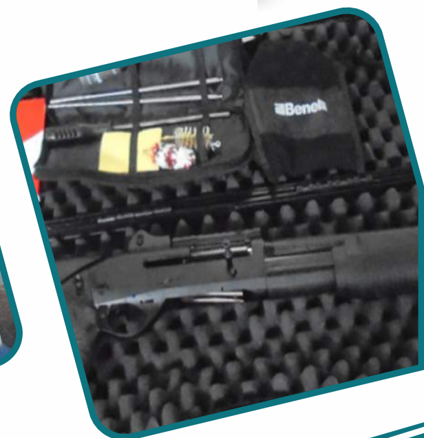
ESCOPE TA ARMA PARA EL GRUPO ARMAMENTO DE LA POLICÍA NACIONAL.