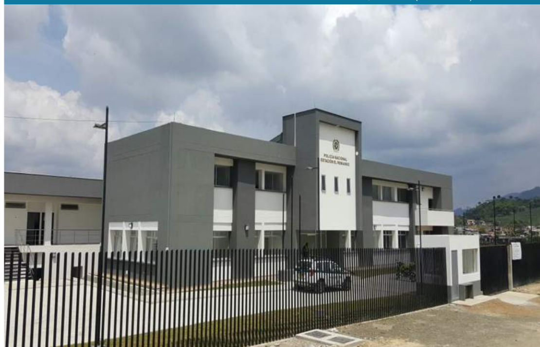
ESTACIÓN DE POLICÍA REMANSO, PEREIRA (RISARALDA) COLOMBIA.