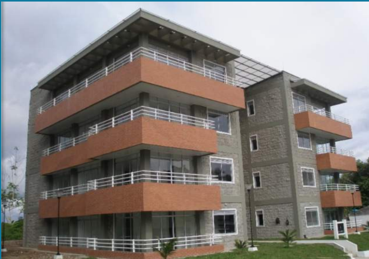
APARTAMENTOS FISCALES OFICIALES, PUERTO LEGUIZAMÓN (PUTUMAYO) COLOMBIA.