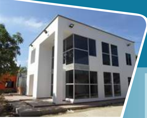
INSPECCIÓN DE POLICÍA MUNICIPIO DE LURUACO (ATLÁNTICO) COLOMBIA.