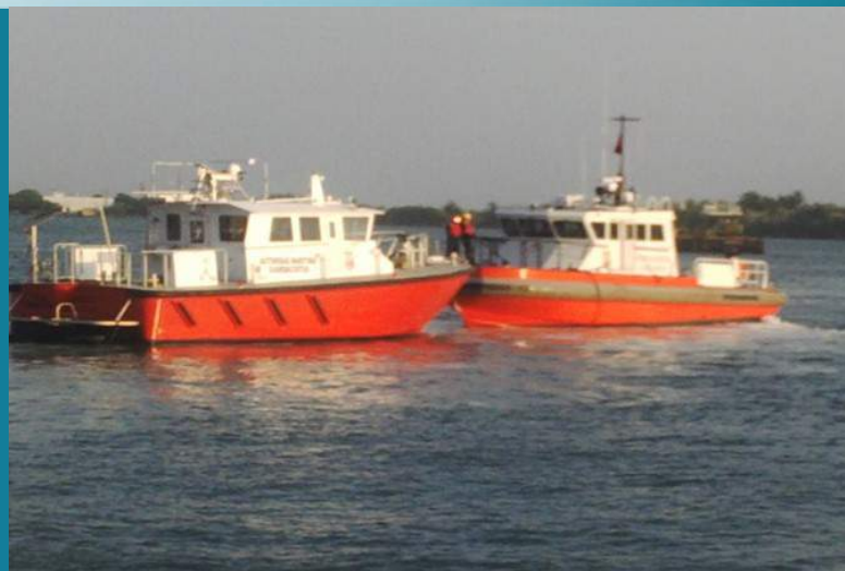
BOTE BAHÍA MAYOR BOTE PARA LA DIRECCIÓN MARÍTIMA EN EL PUERTO DE CARTAGENA.