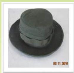
Sombrero Tipo Camboyano