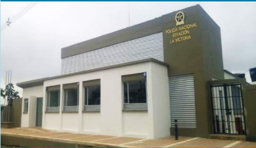
ESTACIÓN DE POLICÍA LA VICTORIA, QUIBDÓ (CHOCO) COLOMBIA.

1. Realizar la viabilización requerida para el desarrollo de los proyectos que suscriba la Entidad.