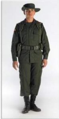
Uniforme de fatiga No.5