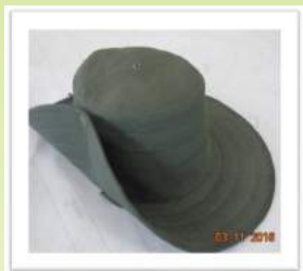
Sombrero doble Faz