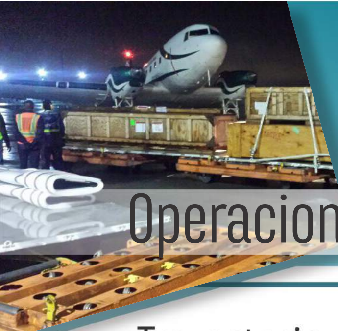
AVIÓN ATR-42 AERONAVE PARA LA DIRECCIÓN DE ANTINARCÓTICOS DE LA POLICÍA NACIONAL.