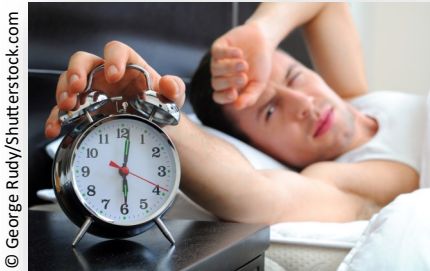
Leopoldo se despierta a las seis de la mañana.