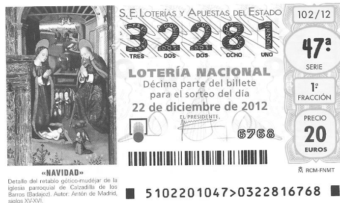
«NAVIDAD» Detalle del retablo gótico-mudéjar de la iglesia parroquial de Calzadilla de los Barros (Badajoz). Autor. Antón de Madrid, siglos XV-XVI.

La Lotería de Navidad con el número 32.281 ya está a la venta y a disposición de los asociados, que podrán adquirirla de la forma siguiente: