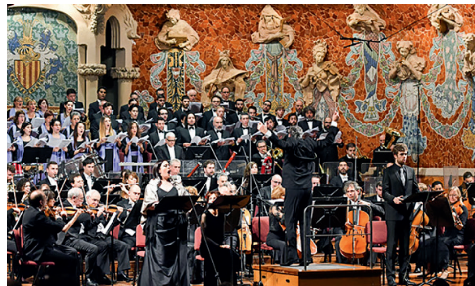
Estrena de ' Cantata de Randa ' al Palau de la Música - 28 de gener de 2017