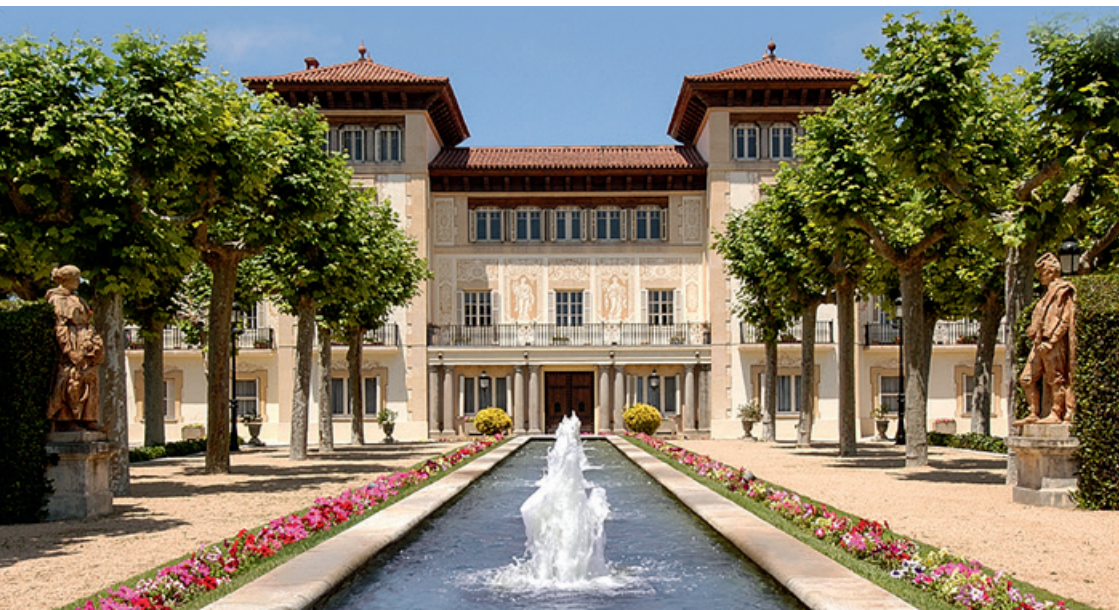
Finca Mas Solers, disseny d'Enric Sagnier a Sant Pere de Ribes Manifestació del modernisme