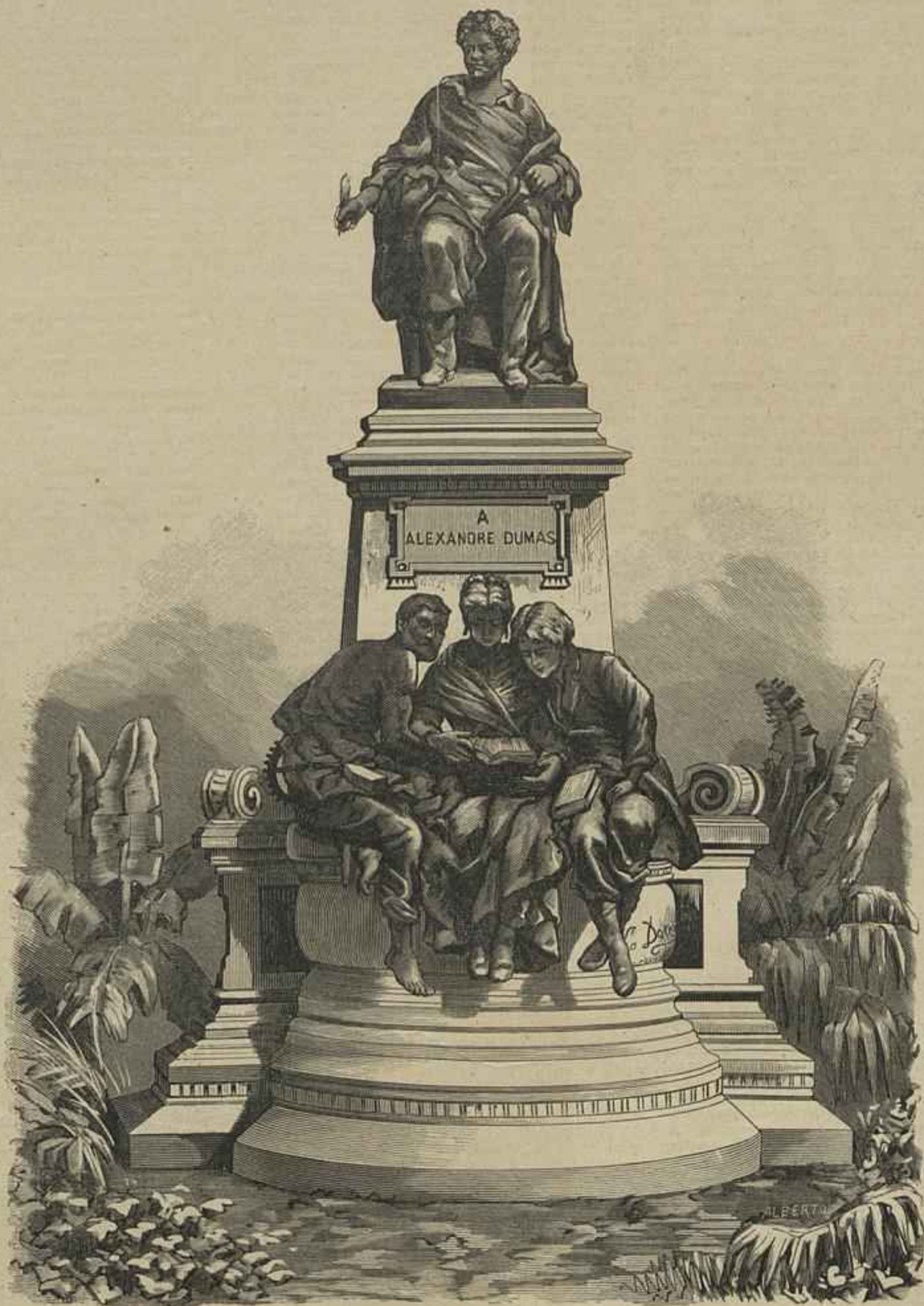
MONUMENTO A ALEXANDRE DUMAS, EM PARIS

Toda a brandura de caracter e todo o calculo prudente não bastam a contêr em respeito paixões escandescentes provocadas por prepotencias escandalosas de protervia.