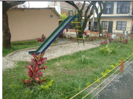
Relleno con grava triturada en zona de juegos infantiles y senderos peatonales, confinamiento con sardinel en concreto,