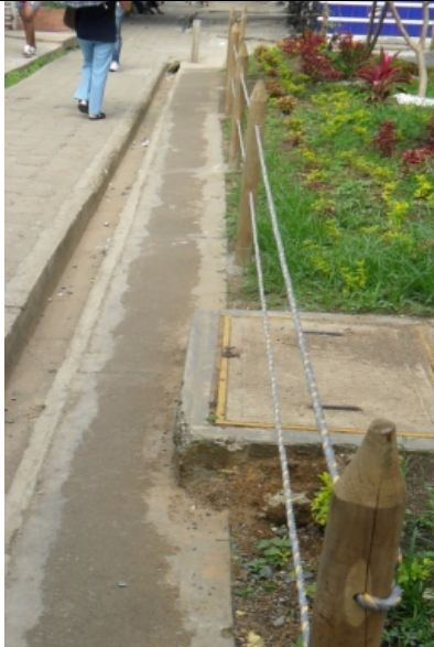
Construcción de andén con anchos de 50 centímetros; mala calidad en acolillado