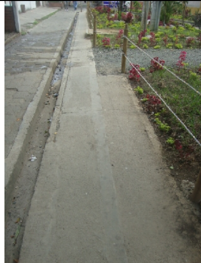
Construcción de andén con anchos de 50 centímetros; mala calidad en acolillado