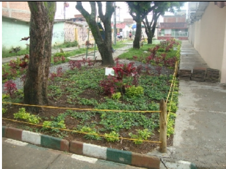
Andenes en concreto