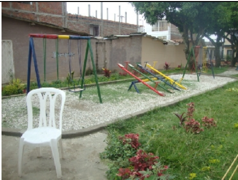
Relleno con grava triturada en zona de juegos infantiles, confinamiento con sardinel en concreto,