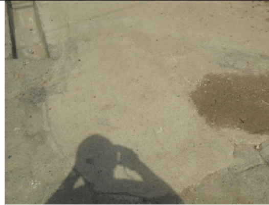
Andenes en concreto sin definición de juntas de construcción.