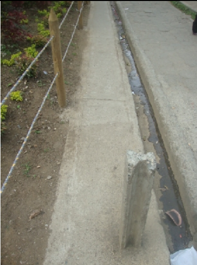
Construcción de andén con anchos de 50 centímetros; mala calidad en acolillado