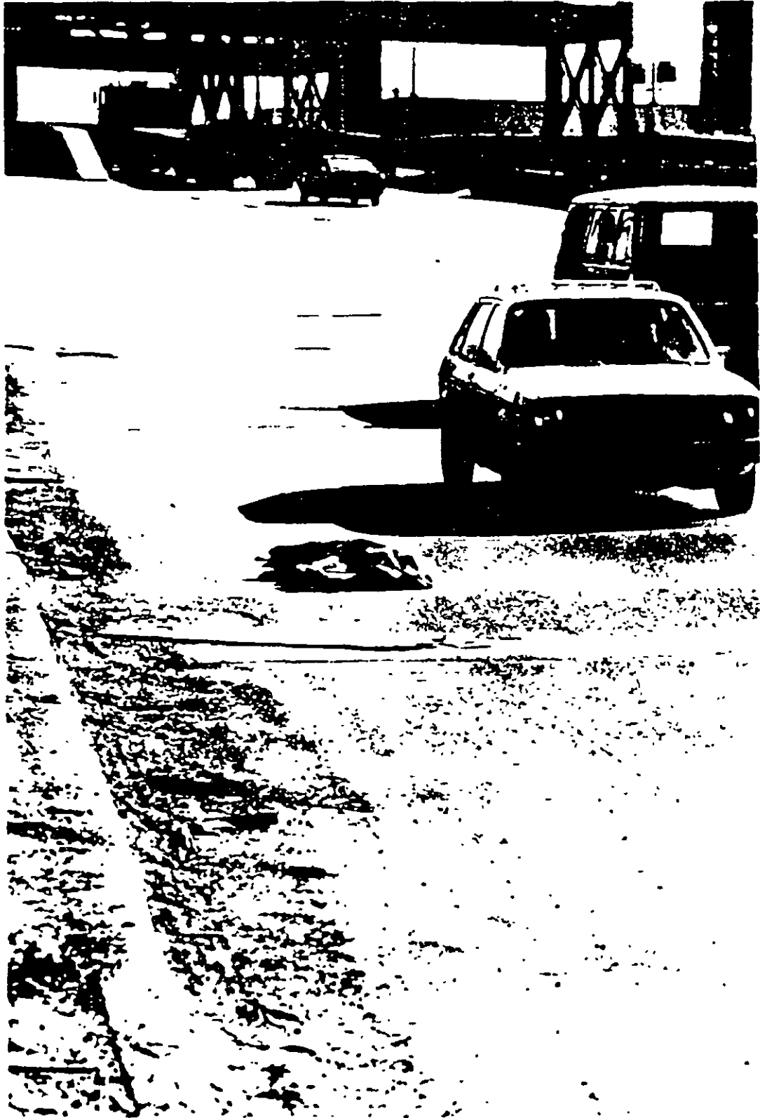
FIGURA 10-2 DESECHOS EN LA VIA