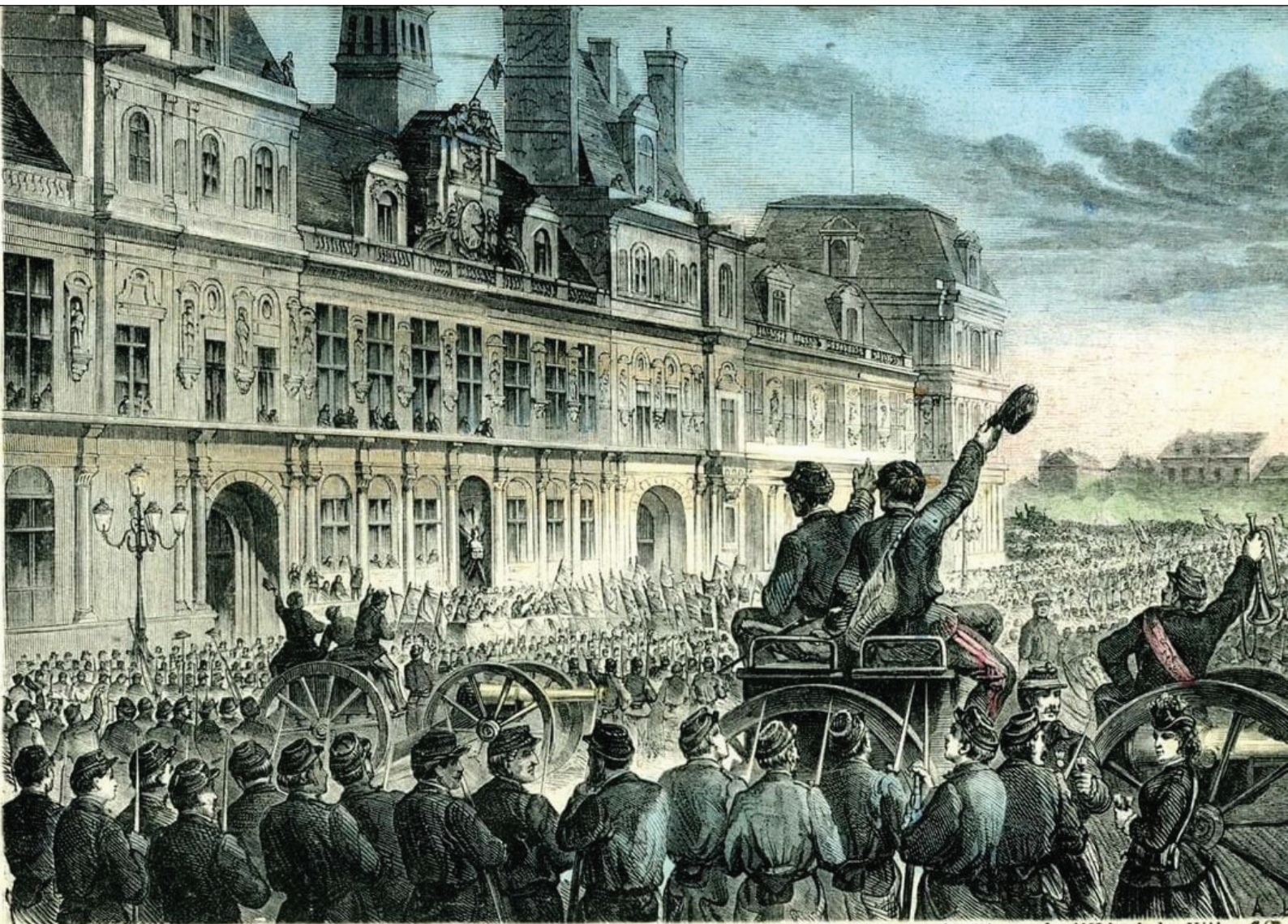
107 - Paris sous la Commune 1871 — Proclamation de la Commune sur la Place de l'Hôtel-de-Ville, 18