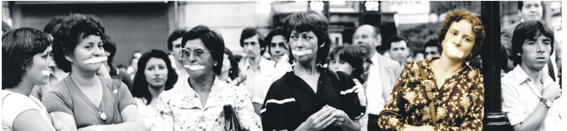
EL DOCUMENTAL HOY Y NO MAÑANA cuenta la lucha de un grupo de mujeres que se organizó para no permitir que la dictadura callara sus voces.