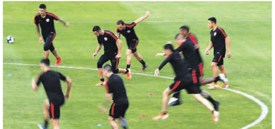
LA SELECCIÓN CHILENA entrena en Sao Paulo de cara al enfrentamiento contra Colombia por los cuartos de final de la Copa América Brasil 2019.

La Copa América se ha convertido en el torneo talismán para Chile, que la ha ganado en las dos últimas ediciones (2015 y 2016), y la Roja confía ahora en apartar nuevamente a