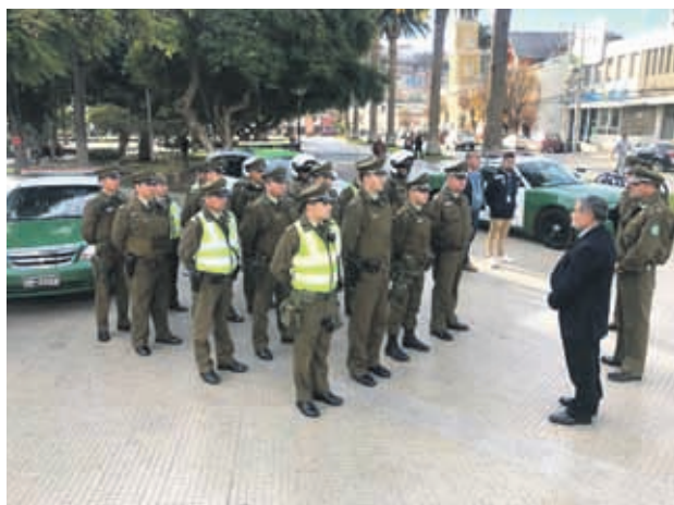
EL TRABAJO POLICIAL se enfocará en los lugares georreferenciados como de más alta ocurrencia de delitos.