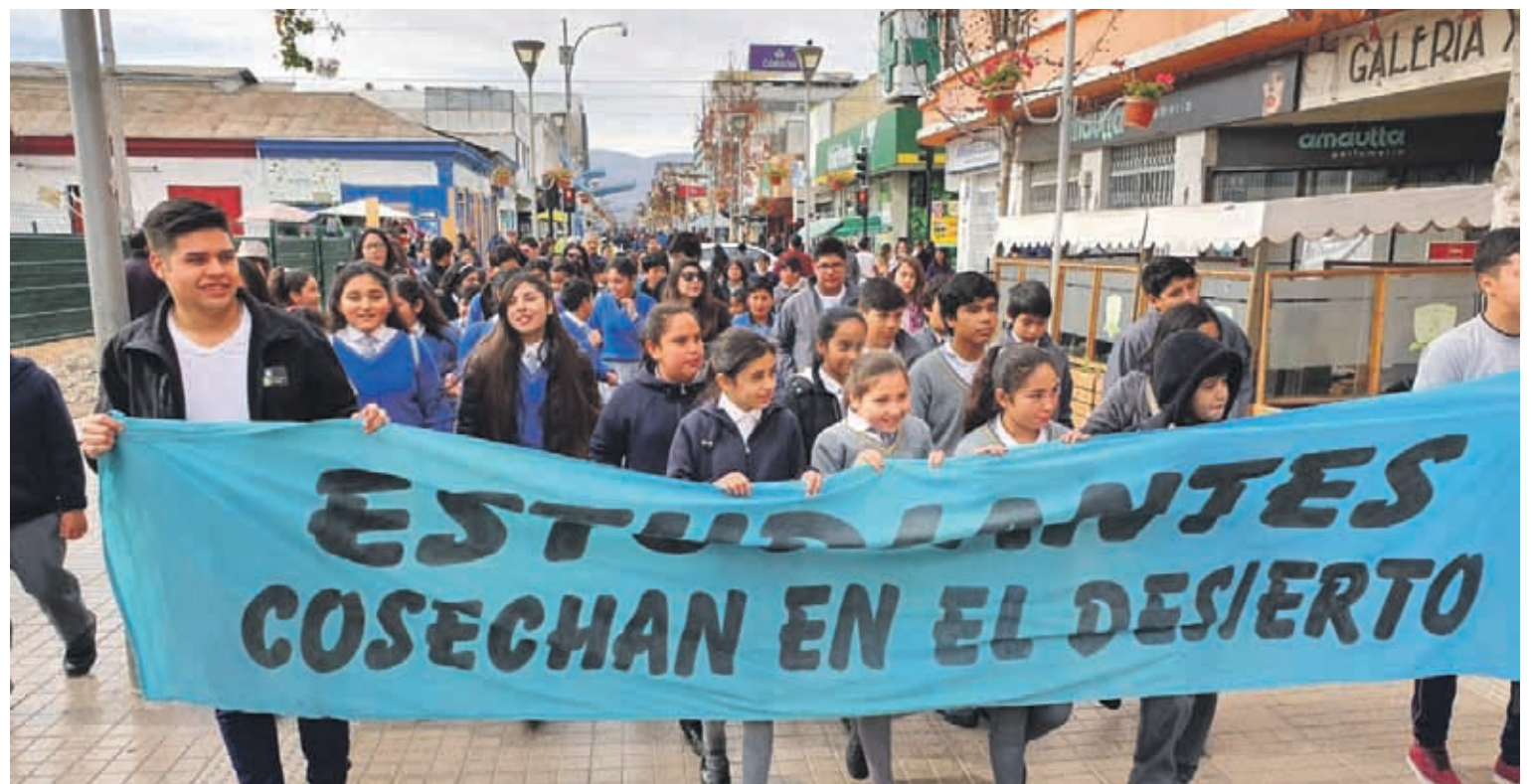
CON UNA MARCHA DE CONCIENCIACIÓN CON EL USO DEL AGUA, los estudiantes que participaron de la actividad de intercambio de experiencias, culminaron la jornada en el paseo peatonal de Ovalle.

José Arraño de Andacollo y el Liceo Politécnico, quienes realizan un trabajo de asistencia y asesoramiento a los establecimientos rurales de la provincia.