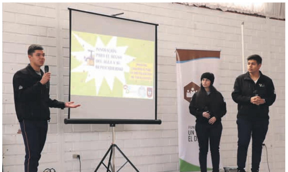
ESTUDIANTES DEL LICEO POLITÉCNICO expusieron su proyecto científico a base de filtros para poder reutilizar el agua en sistemas de riego.

millones de litros de agua de lluvia y agua gris (lavamanos) se han logrado reciclar o "cosechar" entre el 2011 y el 2019 gracias a los proyectos impulsados por la PUC y la Fundación Alto en el Desierto.