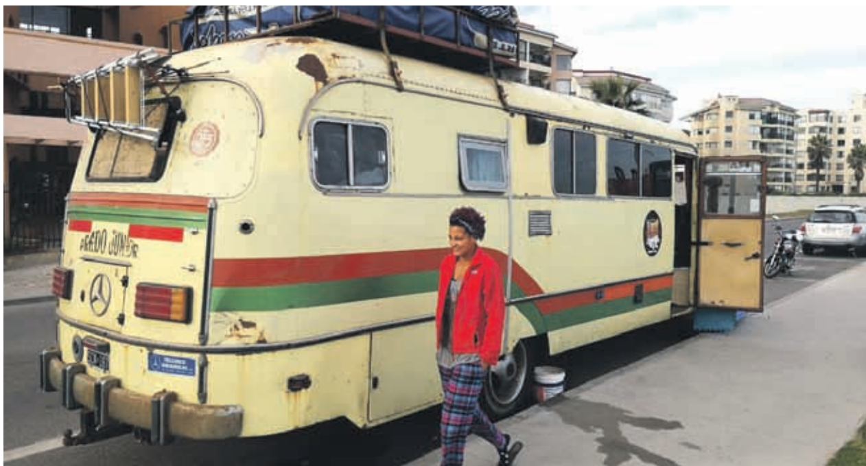
Casas rodantes de distintos puntos del país ya se estacionan en la región con una buena cantidad de turistas de diferentes países del continente, que vienen atraídos por el fenómeno astronómico del próximo martes

los turistas que vienen por motivo del eclipse solar del próximo 2 de julio. Una de las señales más evidentes han sido los motorhomes que se han instalado a lo largo de Avenida del Mar: entre El Faro Monumental y Cuatro Esquinas