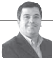
Ignacio Pinto Retamal Seremi de Gobierno