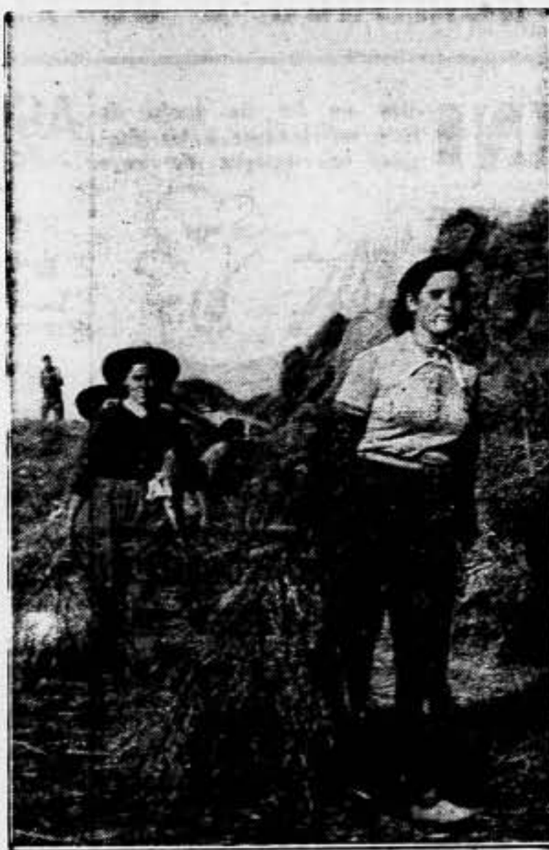
«Mujeres Libres» inicia en toda España leal un movimiento de valorización y reeducación del sector femenino, levantando a nuevas camaradas de los campos y las fábricas a un horizonte de trabajo y emancipación individual y social

entusiasmo y su voluntad indomable y ha pasado por las amarguras iniciales de esta labor meritísima y noble. He aquí lo que dice: