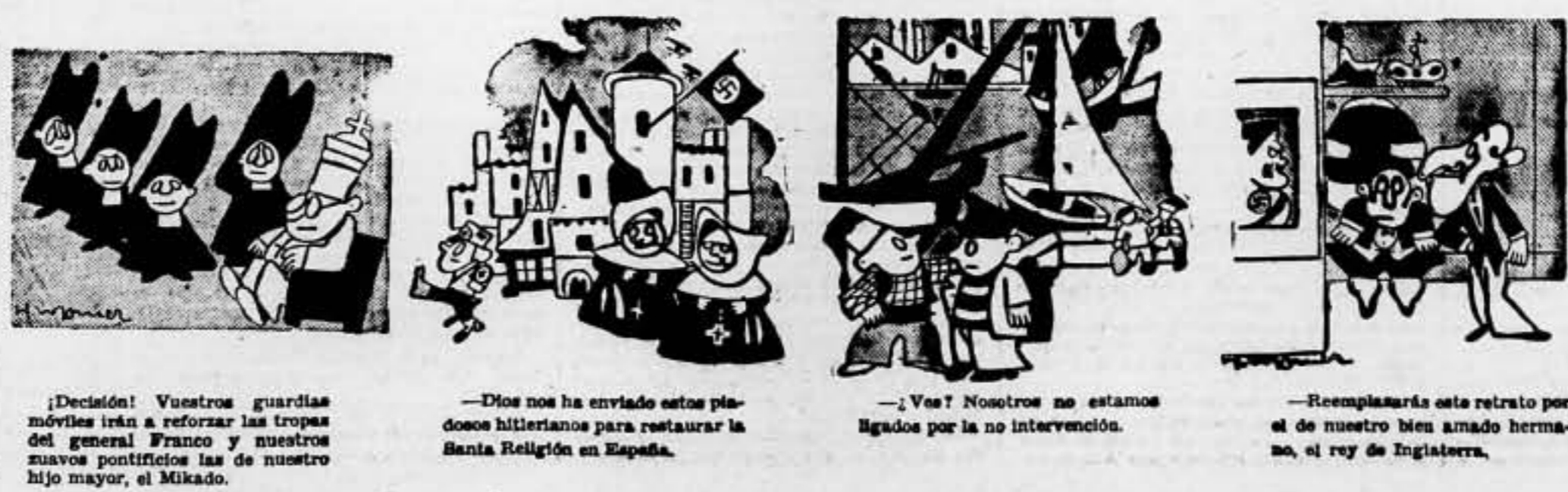
¡Decisión! Vuestros guardias móviles irán a reforzar las tropas del general Franco y nuestros nuevos pontificios las de nuestro hijo mayor, el Mikado. —Dios nos ha enviado estos piedadosos hitlerianos para restaurar la Santa Religión en España. —¿Ves? Nosotros no estamos ligados por la no intervención. —Reemplazarás este retrato por el de nuestro bien amado hermano, el rey de Inglaterra.