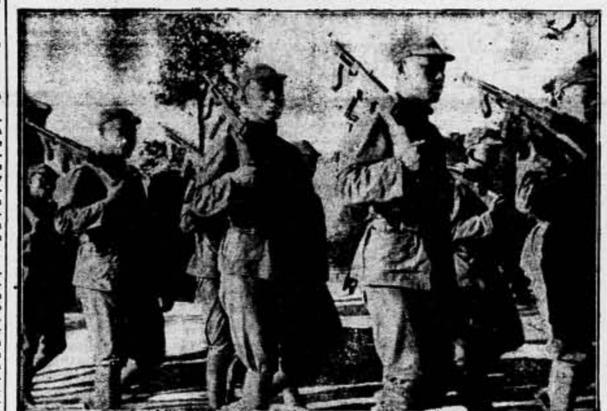
LA CHINA DEL NORTE, CONOCIDA POR LA CHINA ROJA, UNE SU FRENTE DE GUERRA Y SUS EJERCITOS AL FRENTE DE SHANGHAI PARA Oponer una MURALLA a LOS IMPERIALISTAS NIPONES