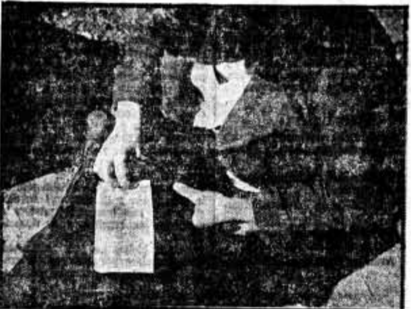
Una jovencita prendiendo en un jersey versos ingeniosos, saturados de afecto fraternal por los milicianos.