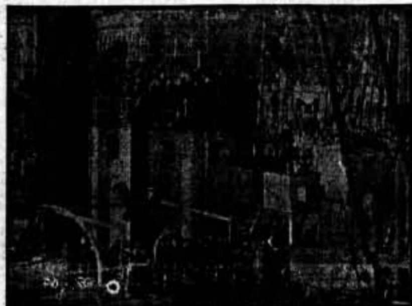
La tracción del "Zirianin".