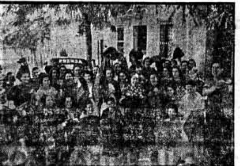
Satisfechas de su obra, muestran los jerseys que pronto servirán de abrigo a un buen número de hermanos del frente.