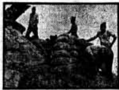
Nuestros milicianos construyen parapetos en Fuentetodos, después de haber tomado esa posición