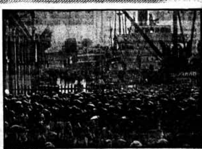
El pueblo presenciando las labores de descarga del "Zirianin".