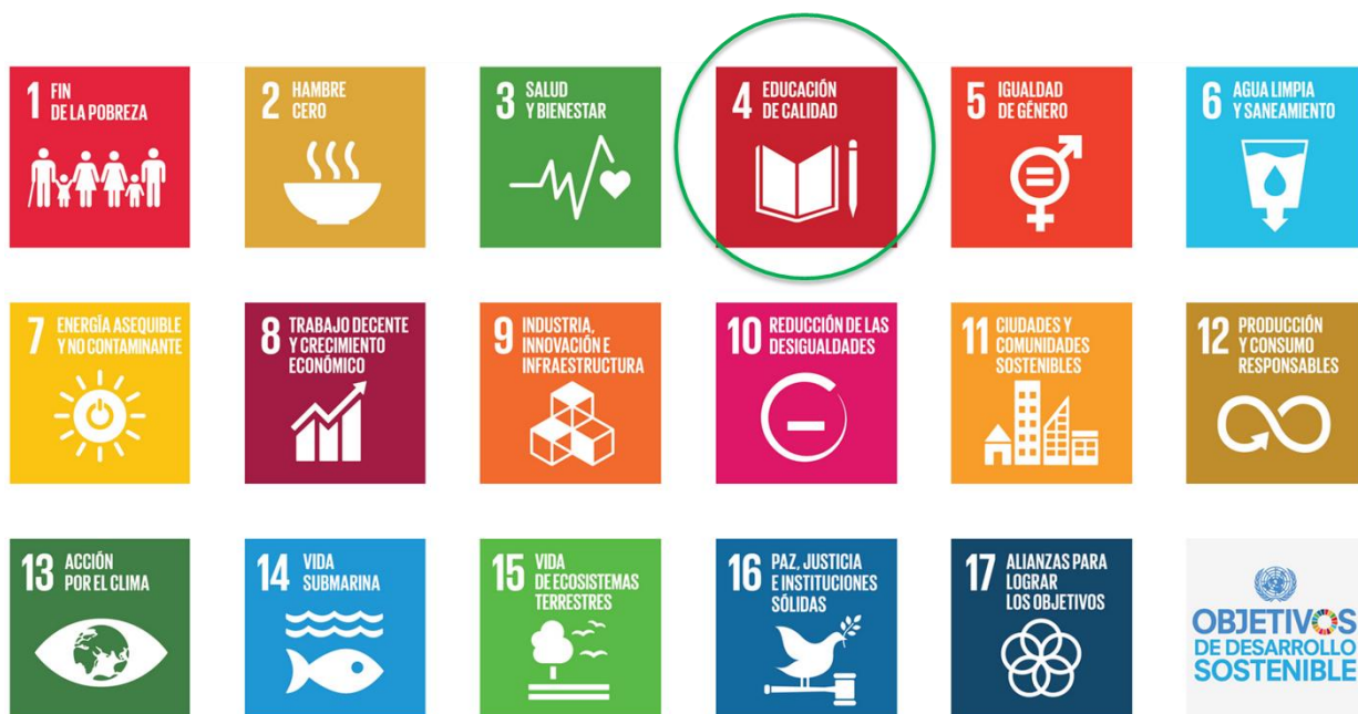
Figura 2: los 17 objetivos para el desarrollo sostenible aprobados por la Organización de las Naciones Unidas en 2015.

El objetivo N° 4 (ver figura N° 2) es “garantizar una educación inclusiva, equitativa y de calidad y promover oportunidades de aprendizaje durante toda la vida para todos. Las universidades deben recuperar del ideario reformista el compromiso con la sociedad en procesos formativos flexibles, adaptados a las nuevas tecnologías, el cuidado del medioambiente y en vinculación con las competencias blandas.”