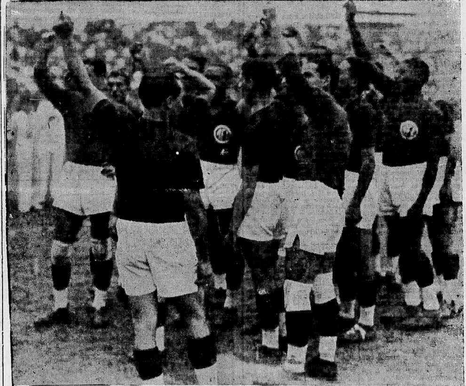
O "onze" rubro que disputará quatro jogos interestaduais este mez

Depois do match de hoje do Torneio Aberto, o America vai submeter seu team a provas duras. Assim depois de amanhã, dia 3, seguirá o America para São Paulo, onde enfrentará domingo a forte turma da Portuguesa, campeã da A. P. E. A.