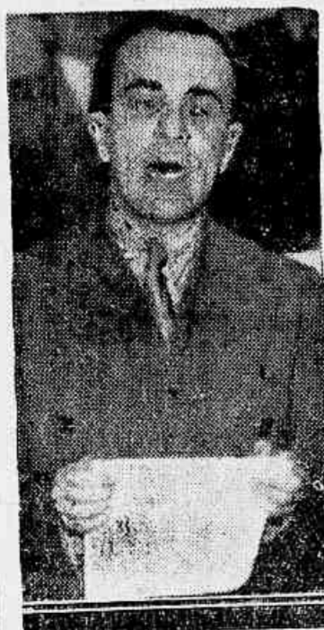
Sr. Cunha Mello, na tribuna da Secção Permanente do Senado

Na hora do expediente da reunião de hontem da Secção Permanente, o sr. Cunha Mello fez o seguinte discurso: "Sr. presidente: — A publicação do Dec. n.º 702 de 21 do fluente, sem ressalva das imunidades parlamentares, logo seguida da prisão de um senador e quatro deputados, provocou entre nós, mesmo no espirito publico, uma certa estranheza. Portador do pensamento de v. ex., logo nos primeiros momentos em que se tornaram taes factos publicos, fui ao sr. ministro da Justiça, levar-lhe a declaração de que competindo á Secção Permanente velar pelas prerogativas do Poder Legislativo, ex-vi do n.º 1 do § 1º do art. 92 da Constituição Federal, desejavamos ter os esclarecimentos necessarios sobre as referidas prisões, a fim de que desde logo estivessemos habilitados ao cumprimento do nosso dever constitucional. Quando aqui esteve uma numerosa commissão de deputados da qual foi interprete o illustre sr. Octavio Mangabeira, deu-lhe v. ex. noticia da actual situação ponderada e patriótica que com a aprovação de todos nós, vinha desenvolvendo sobre tão desagradavel incidente. Attendendo á representação Abel Chermont e deputados