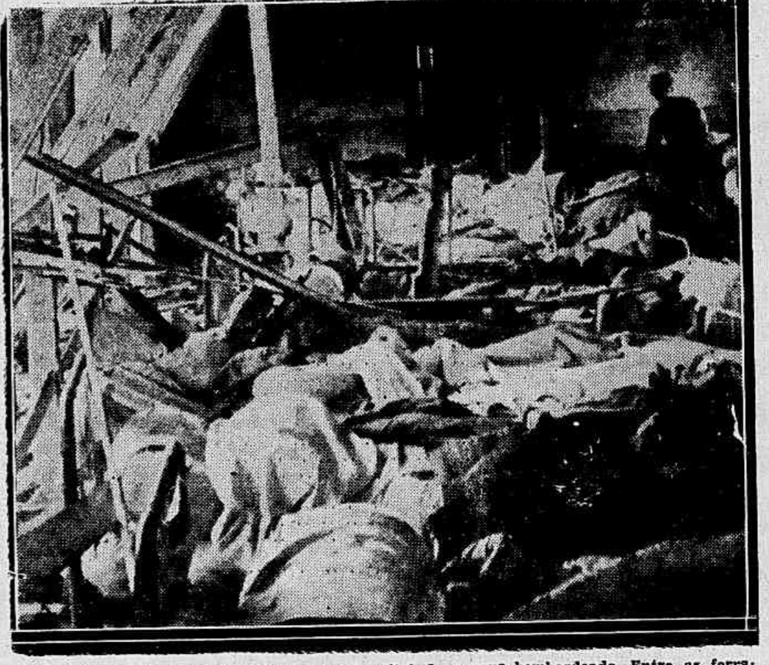
Uma visão da hecatombe de 1914: um hospital de sangue bombardeado. Entre as ferragens retorcidas dos leitos, por cebe-se os corpos dos enfermos, que não foram retirados em tempo

PARIS, 31 (Havas) — Os jornais prevêem que as novas propostas alemãs não trarão nenhum elemento novo nem nada alterarão quanto as conversações dos estados maiores a realizarem-se entre Londres, Bruxellas e Paris. O correspondente do "Matin" em Berlim diz-se informado de que o discurso do sr. Flandin não deixou de influir sobre a redacção da ultima resposta alemã. O "Petit Parisien", escreveu: "A parte mais importante das propostas será, ao que corre, um novo Locarno destinado a ligar a França, a Belgica e a Alemanha, sob a garantia da Inglaterra e da Italia, mediante um pacto de não-agressão válido por 25 annos. No este da Europa, o Reich proporia a conclusão de tratados bilateraes com a Tcheco-Slovaquia e a Lituania. O plano terá ma