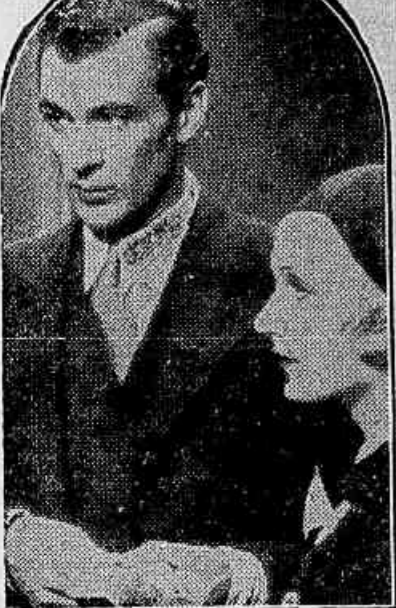
Gary Cooper e Carole Lombard em "A Mulher que Deus me deu", da Paramount

O film descreve os impulsos que a arrastam a desposar esse homem.