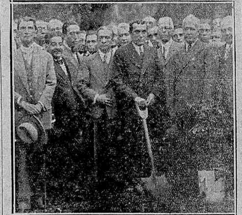
Flagrante da plantação, pelo interventor federal, do um pé de arvore Páo Brasil, no Campo de São Christóvão