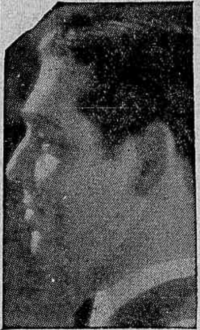
Clark Gable, o homem do dia, a paixão de Norma Shearer em "Uma Alma Livre"

A MAIOR PROVA DO TALENTO DO DIRECTOR CLARENCE BROWN