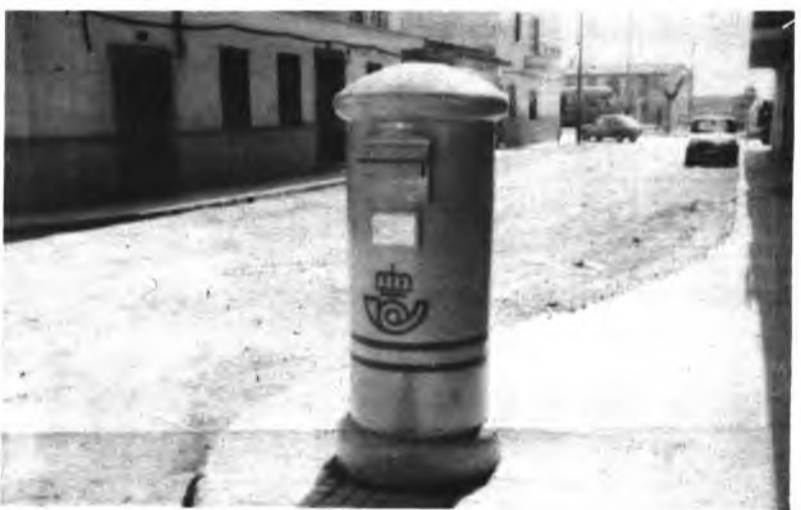
El nuevo buzón instalado en la plaza Mallorca.

El próximo sábado por la tarde, en dos funciones, en el Salón Parroquial el Grupo de Granada "Teatro de Marionetas Candilejas" representará la obra de Juan Ramón Jimenez "Platero y Yo," como homenaje al autor en el centenario de su nacimiento.