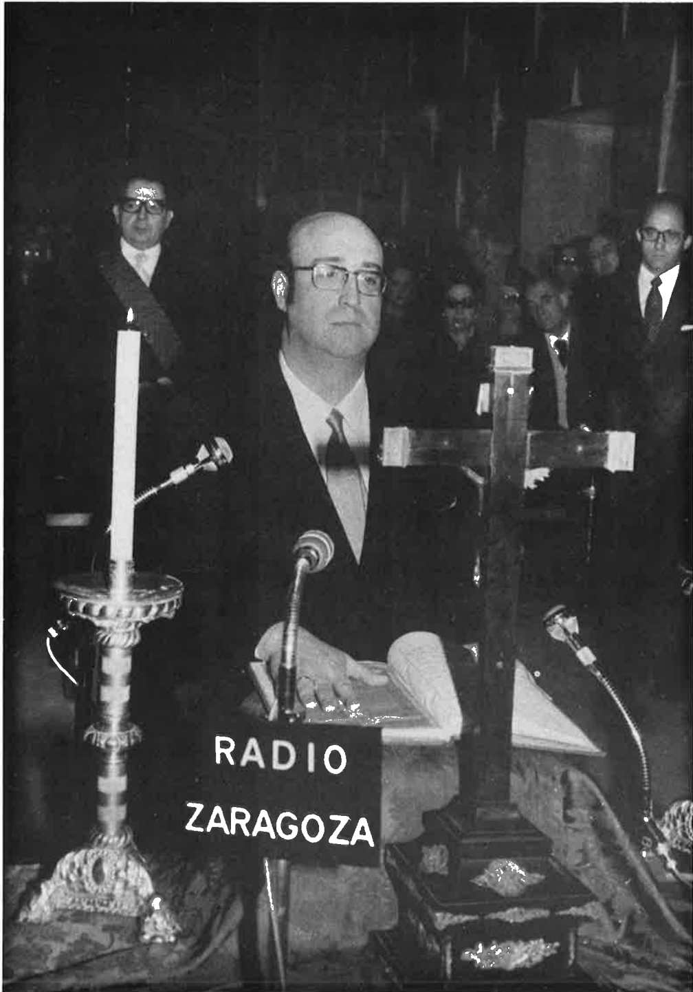
D. Miguel Merino Pinedo, en el juramento de su cargo de Alcalde de Zaragoza