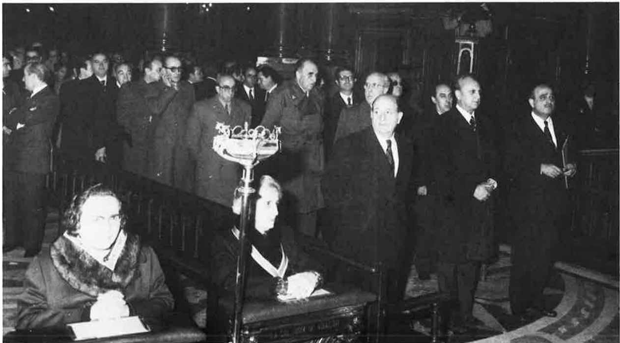
Autoridades civiles y militares asistentes al acto religioso