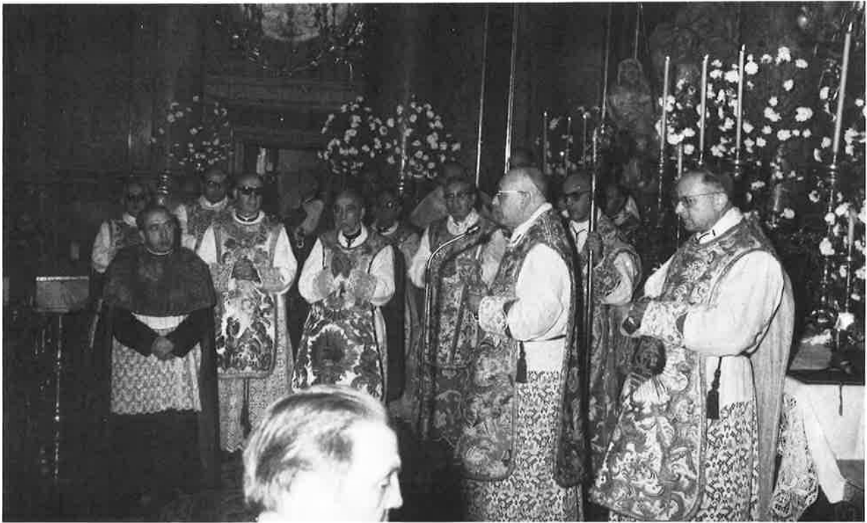
Ceremonia religiosa como inauguración del Bimilenario de Zaragoza