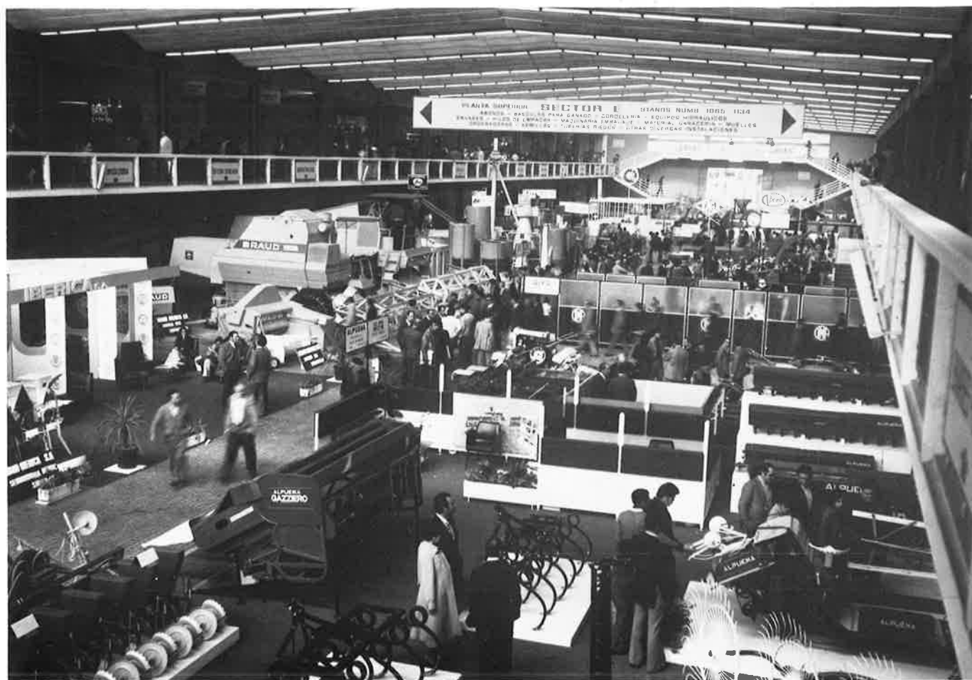
Vista parcial de uno de los pabellones de la Feria