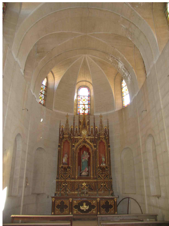
Fig. 7.- Las Poyatas. Interior de la capilla