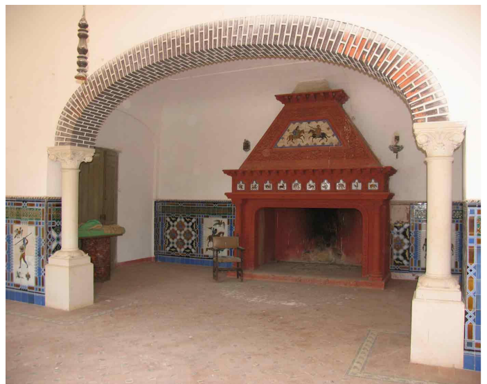
Fig. 4.- Las Poyatas. Chimenea interior