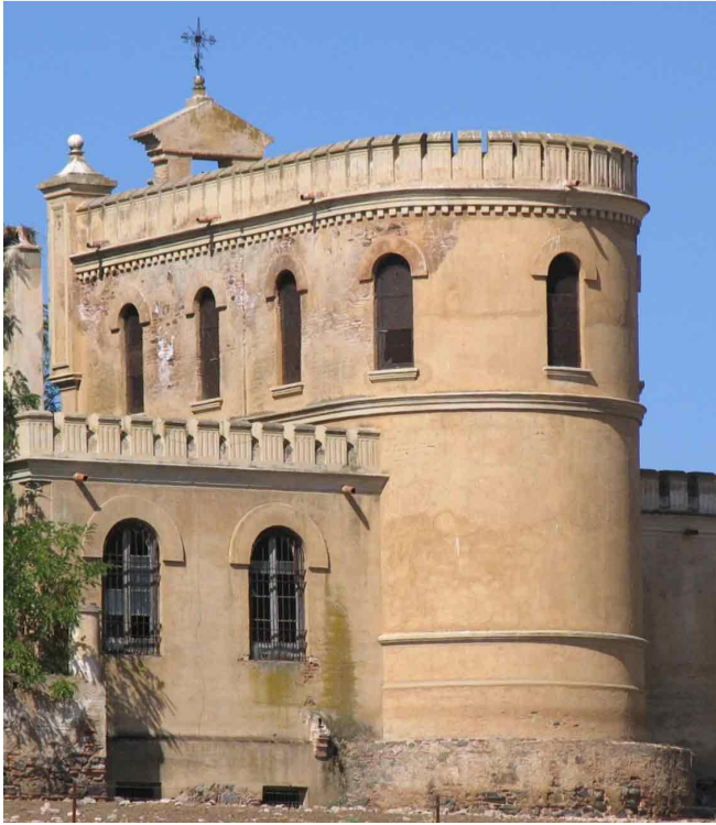
Fig. 5.- Las Poyatas. Capilla desde la cabecera