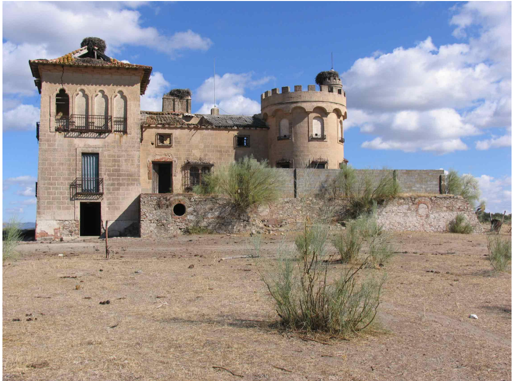
Figuras. 8 y 9.- Palacio de la Zapatera (Oliva de Mérida) y Cerros Verdes (Mérida)