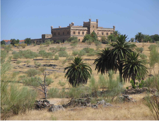
Fig. 1.- Las Poyatas. Visión general