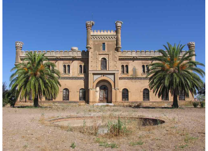
Fig. 2.- Las Poyatas. Fachada principal