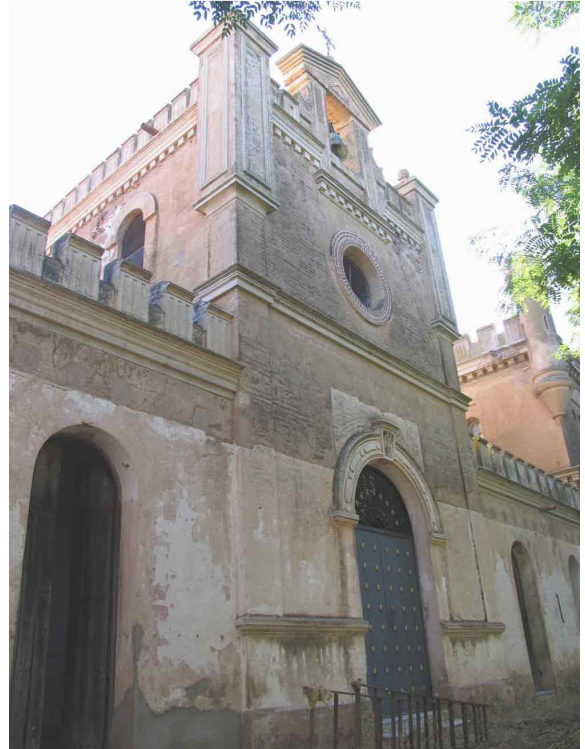
Fig. 6.- Las Poyatas. Fachada de la capilla