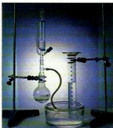
FIG. 7. El hidrógeno es un elemento que se puede obtener en el laboratorio a partir de la reacción entre el ácido clorhídrico y el cinc.

Los elementos químicos se clasifican en dos grandes grupos: los metales y los no metales .