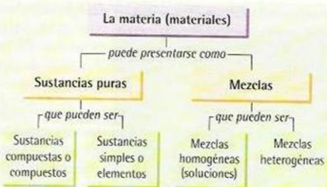
FIG. 9. Clasificación de la materia.