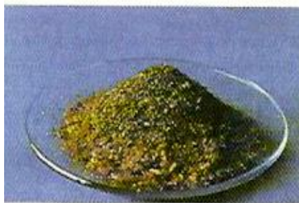
Fig. 10. Mezcla heterogénea formada por dicromato de potasio (cristales de color naranja) y limaduras de hierro.