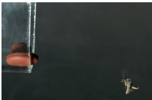
Macho del barrenador de brotes ( Epinotia aporema ) volando hacia un tapón de goma impregnado en feromona sexual de la hembra. Esta estrategia puede utilizarse para realizar un monitoreo poblacional de la plaga en cultivos de soja.

Por otro lado, las señales que produce un emisor en un contexto de verdadera comunicación, pueden ser "espías" por miembros de otras especies en su propia ventaja, constituyendo así una desventaja para quienes las emiten. Este último, por ejemplo, es el caso de estímulos que aprovecha un depredador para encontrar a sus presas, o los parásitos que se ubican en el exterior de otros individuos como las garrapatas, pulgas y piojos, para encontrar a sus hospederos, o por vectores de enfermedades, como los mosquitos. Estos estímulos son emitidos por la presa u hospedero sin estar direccionados a los depredadores, ectoparásitos, o vectores, y terminan por ser desventajosas a ellos mismos. A este tipo de señal química entre