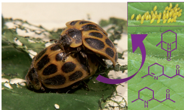
Una pareja de la vaquilla de los zapallos ( Epilachna paenulata ) en cópula. El macho transfiere parte de sus alcaloides defensivos a la hembra, y ella los utiliza para defender sus huevos.

arañas y hormigas, y a su vez, los estudios realizados en la Facultad de Química han permitido proponer la hipótesis de que estos alcaloides podrían tener actividad contra hongos.