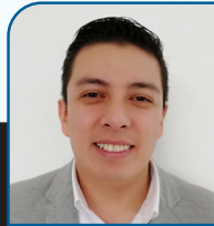
Autor: Eliel Morales Lara.

Maestro y licenciado en derecho, especialista en el ámbito tributario / Abogado postulante y asesor jurídico especialista en estrategia y defensa fiscal / Socio fundador y directivo de TRIBUTÓPOLIS, empresa dedicada a los impuestos y servicios legales / Articulista con más de tres años colaborando con "Panorama Universitario" revista de cobertura nacional, enfocada a la comunidad universitaria del país / Conferencista y expositor a nivel nacional en temas tributarios de actualidad.