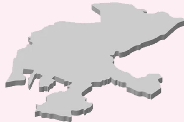
Estado de Zacatecas.

La investigación se sustenta en la teoría social de la comunicación, de la dependencia, de los efectos y auto comunicación de masas. Asimismo, se llevó a cabo un análisis crítico de los discursos políticos sobre violencia e inseguridad, mediante un modelo mixto de Análisis Crítico del Discurso (ACD), como lo propone González (2016), que asocia la contabilidad de las palabras al estudio de los términos clave que se agrupan dentro de frames (seleccionados a partir de campos lexicales), que confieren sentido al texto. Esto, con el apoyo además de las técnicas de Observación de Storytelling y Análisis de Contenido (AC), éste último, para explorar las respuestas de la población en las notas vinculadas en portales ciudadanos.