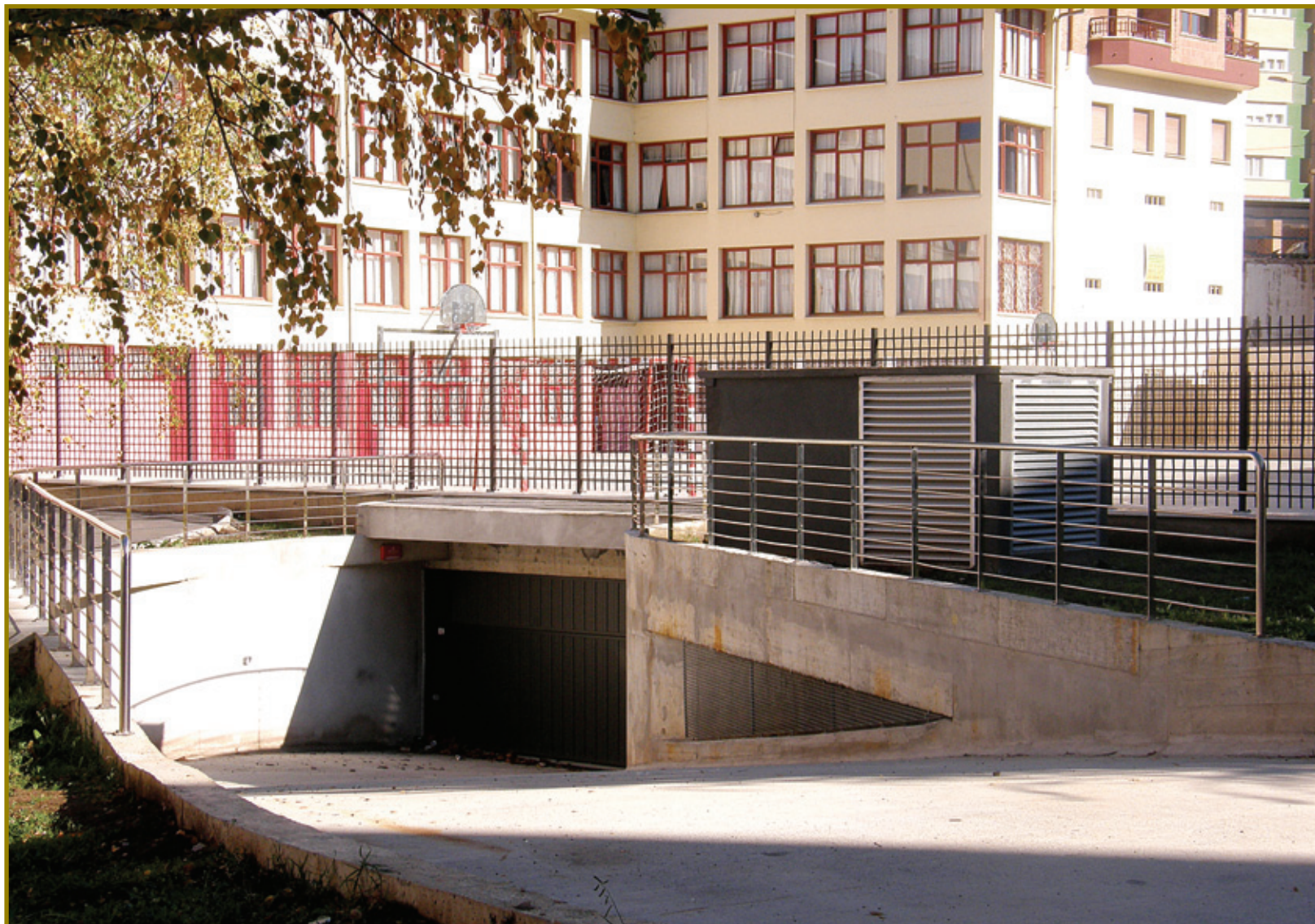
Aparkaleku berrirako sarrera.

Aurrerantzean informazio eta zehaztasun gehiago zabalduko bada ere, aparkalekuan plazak eskuratzeko interesa dutenentzako zerrenda zabalduko du Udalak. Horretarako Udaleko 94 6833672 telefonora deitu edo Alamedako udal bulegoetan bere izena eman beharko du otsailaren 3a baino lehen.