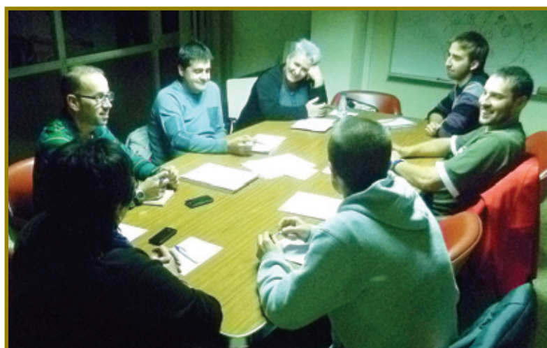
Hezkuntza Batzordeko kideak guraso elkarteekin batzarrean.

Udalak eta herriko talde, elkarte, musika talde, eskola eta ikastolek, Bide Onera Zine Aretoak eta Kafe Antzokiak barne, 36 ekintza antolatatu dituzte gabonetarako. Udalak esku orri baten jaso ditu guztiak, eta etxex etxe banatu du. Nahi duenak, udalaren web orrian ere ikusgai dauka ( http://www.ondarroa.eu/es-ES/Eventos/2011/Gabonak_2011.pdf ) Halandabe, ziur egongo direla ekintza gehiago herriko taldeek antolatuta. Adi deialdiei!