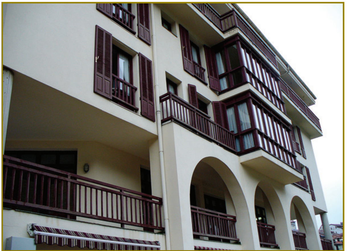
Artibai Egoitza, Errebalatxikiñean.

> Lanpostu finko berri bi sortzea erabaki da, beharginen hutsuneak betetzeko. Beharginen egutegia egoitzako beharginekin landu eta adostu da.