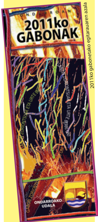
2011ko gabonetako egitarauaren azala

Udalak eta herriko talde, elkarte, musika talde, eskola eta ikastolek, Bide Onera Zine Aretoak eta Kafe Antzokiak barne, 36 ekintza antolatatu dituzte gabonetarako. Udalak esku orri baten jaso ditu guztiak, eta etxex etxe banatu du. Nahi duenak, udalaren web orrian ere ikusgai dauka ( http://www.ondarroa.eu/es-ES/Eventos/2011/Gabonak_2011.pdf ) Halandabe, ziur egongo direla ekintza gehiago herriko taldeek antolatuta. Adi deialdiei!