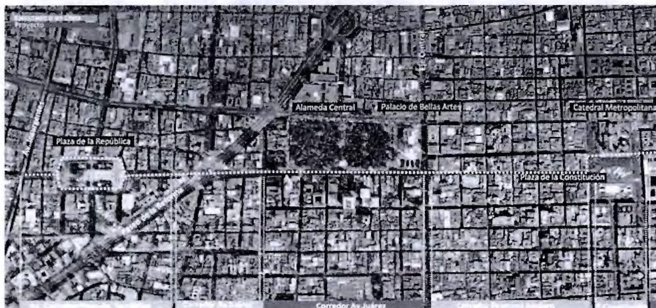
Eje Urbano Insurgentes-Plaza de la Constitución

La rehabilitación de la Alameda Central como punto vital de este Eje, permitió no sólo el rescate de uno de los lugares más emblemáticos de la ciudad, sino además generar una suma de acciones que brindan un tejido urbano ordenado.