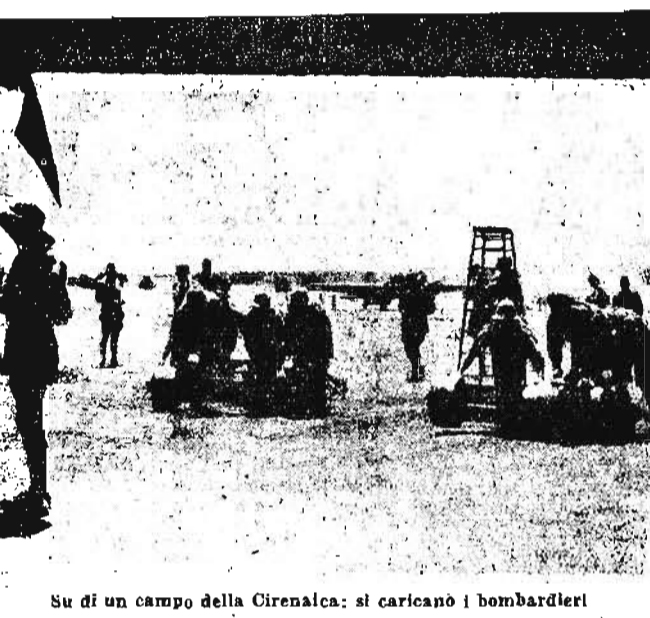
Su di un campo della Cirenaica: si caricano i bombardieri