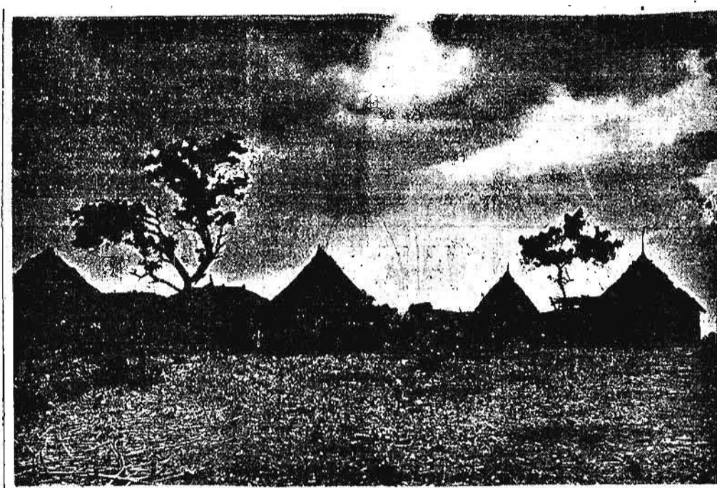
Tramonto a Ghezan

Ed ecco al mercato. Vi si arriva attraverso una via baroccata dove da ogni lato traboccano i più curati assortimenti di merci.