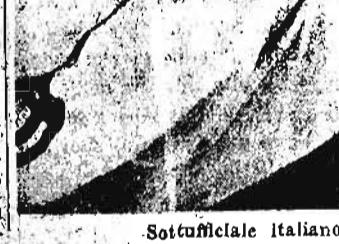
Sottufficiale italiano e giovane indigeno

Ed ecco là, oltre gli sparsi tuoni dalle solite case come dalle solite vite, oltre le strade, addomesticate, bianche, accennate costruzioni europee, le abitazioni degli indigeni più facoltosi.