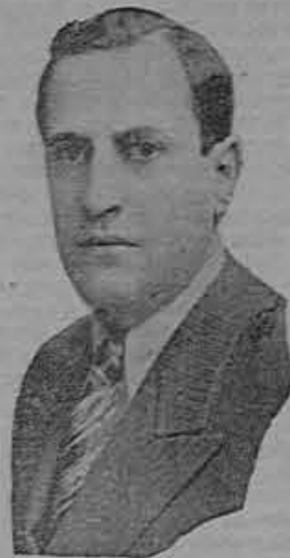
Dr. R. A. CALDERÓN GUARDIA

—Es de justicia acordarle a la distinguida y abnegada compañera de quien supo honrar con su celo y con su ciencia al cuerpo