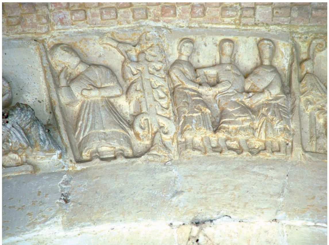
Detalle de la arquivolta exterior