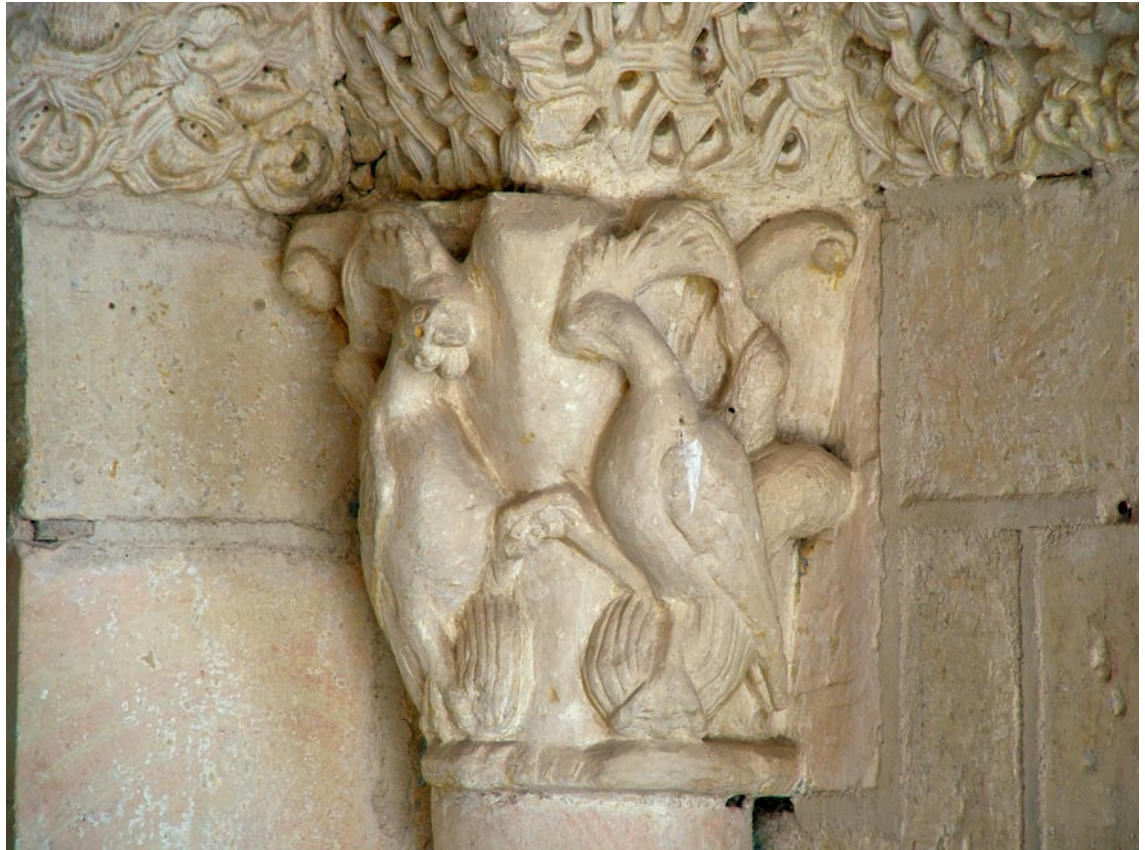
Capitel de la portada