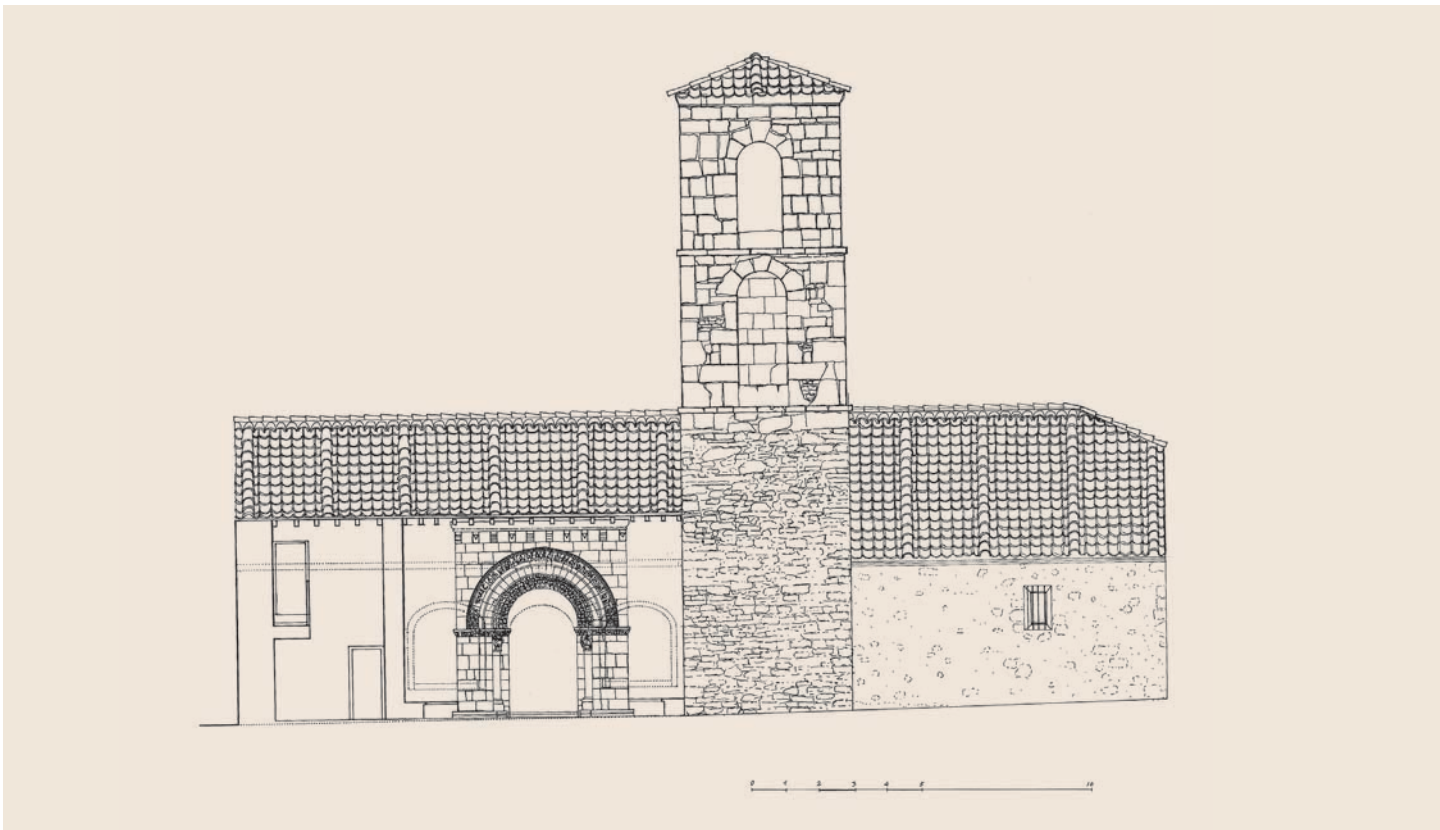
Alzado sur, con sección por el pórtico