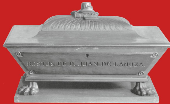
Urna conteniendo los restos de Juan de Lanuza, actualmente en la iglesia de Santa Isabel de Zaragoza.

http://www.enciclopedia-aragonesa.com/voz.asp?voz_id=747