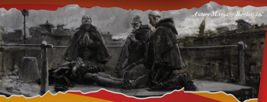
Autor: Mariano Barbasán.