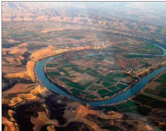
Meandros del Ebro en Sástago

Encuentra restos y señales que trata de interpretar en clave histórica (guerra civil, memoria histórica), natural (cambio climático, aves y serenas noches estrelladas) y actual (mencionando la necesidad de un auténtico desarrollo sostenible en Aragón).