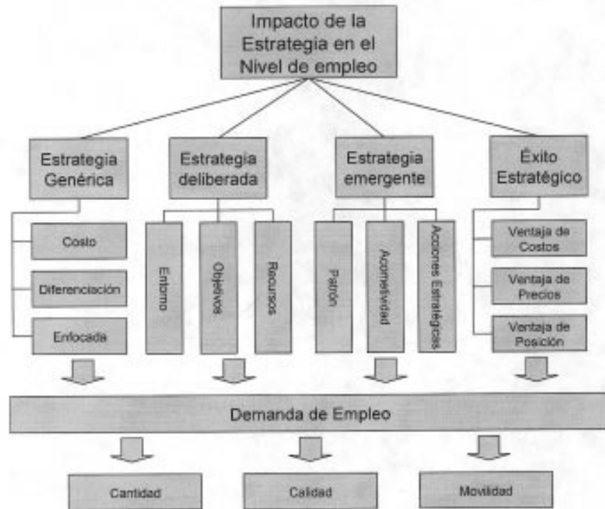
Figura 2. Diagrama del estudio para la definición de variables