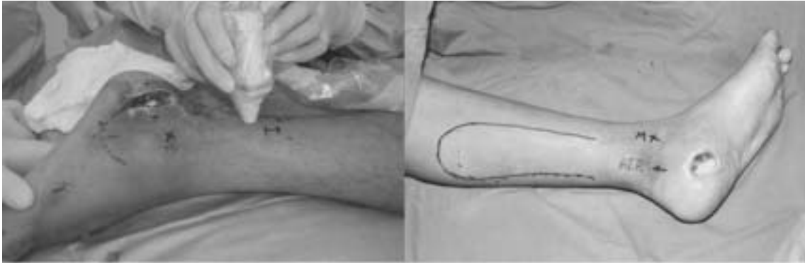
Figura 1. Identificación con Doppler del pedículo vascular y diseño del colgajo.