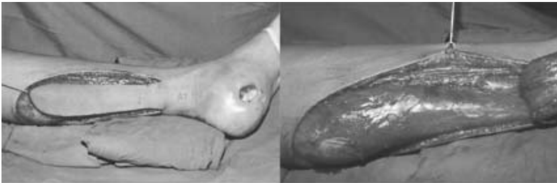
Figura 2. Elevación del colgajo y transposición a zona receptora.

de solucionar los problemas de pérdida de cubierta cutánea sobre el tercio distal de la pierna y del pie. Se han utilizado muchos procedimientos para conseguir una cobertura adecuada de estos segmentos, siendo Ponten 6 en 1981 el primero en describir los colgajos fasciocutáneos. Existen muchas deno-