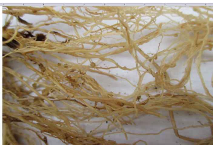
Tratamiento Paecilomyces lilacinus