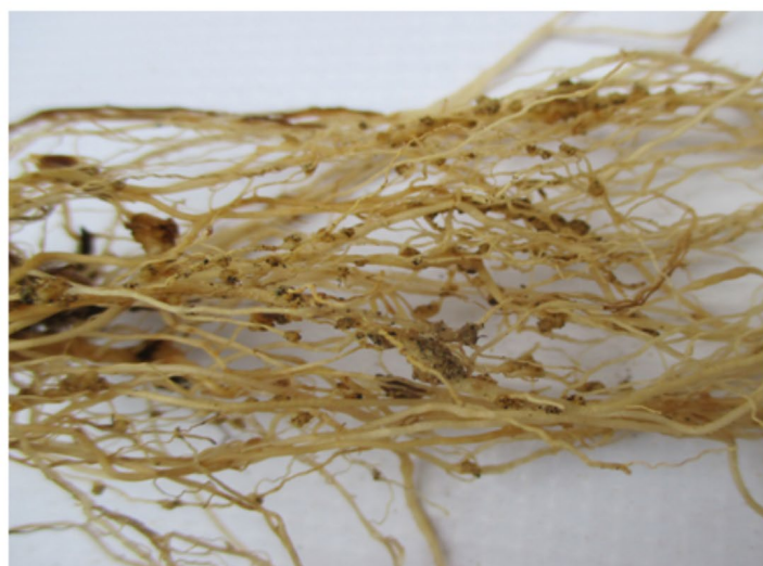
Tratamiento Meloidogyne sp.