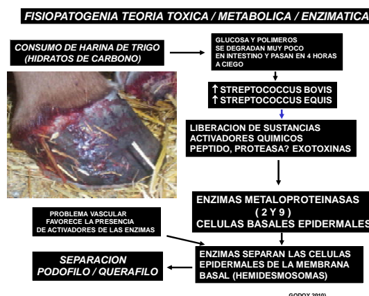
Foto N°3. Teoría del “gatillo” de C. Pollit (2000) sobre la acción de la metaloproteinasas en el daño de la unión dermoepidermal.

La lesión de la membrana basal se caracteriza por una pérdida de los capilares dérmicos y esto explicaría el aumento de 3,5 veces de la resistencia del flujo sanguíneo. Este aumento de la resistencia provoca el aumento del pulso digital (Pereyra, 2003, Pollit, 2003h). En realidad esta teoría como se dijo anteriormente no se contrapone a ninguno de los hipótesis antes conocidas sino que viene a complementar las ya existentes (Foto N° 3).