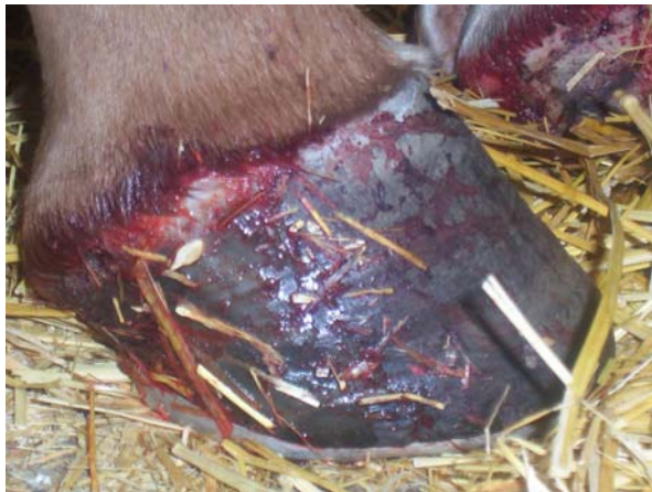
Foto N°5. Reblandecimiento y exudación del rodete como expresión de un inminente desprendimiento del casco.

del casco (Foto N° 5). Cuando se produce la claudicación, el pulso palpable en la arteria digital suele ser exagerado. El tipo de pulso también varía durante el desarrollo, antes de la presentación de la claudicación. Se percibe una respuesta dolorosa en toda la circunferencia de la muralla, en especial en la zona de la pinza. El bloqueo nervioso volar o abaxial bajo produce una importante mejoría de la marcha.