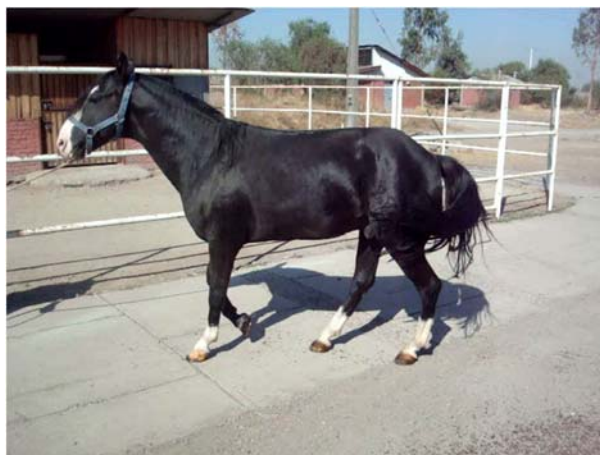
Foto N°1. Postura de un equino con Infosura, al caminar remete las extremidades posteriores con el objeto de disminuir el peso del cuerpo sobre los miembros anteriores para evitar el dolor.

Estas alteraciones multisistémicas dan lugar a la reducción de la perfusión capilar, isquemia y necrosis del corion, contribuyendo a la separación entre podofilo y querafilo, consecuencia de la destrucción de la unión hemidesmosomal entre las células del corion y la membrana basal de las células internas de la epidermis, todo esto acompañado de dolor y pérdida de la función de soporte, llegando incluso al punto en el que la falange distal puede rotar o incluso “hundirse” en el casco. El dolor del pie hace que el animal adopte una postura que le permita disminuir la presión sobre estos, al estar principalmente afectados los miembros anteriores, en el momento que el animal de desplaza remete los miembros posteriores como una actitud antiálgica. (Foto N°1).