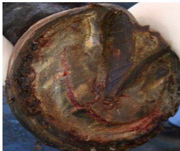
Foto N°7. Ruptura de la suela por acción de la tercera falange rotada.

Con el tiempo, la superficie externa de la pared del casco también presenta cambios característicos, como anillos circunferenciales que divergen hacia los talones y la formación de una concavidad en la cara dorsal de la muralla. El pie como un todo se alarga, angosta y deforma. La marcha es similar a la asociada con la infosura aguda. Es característico que el pie apoye los talones primero quedando la pinza hacia arriba, de manera exagerada. En los estadios crónicos, la respuesta al examen con la pinza de casco puede ser variable.