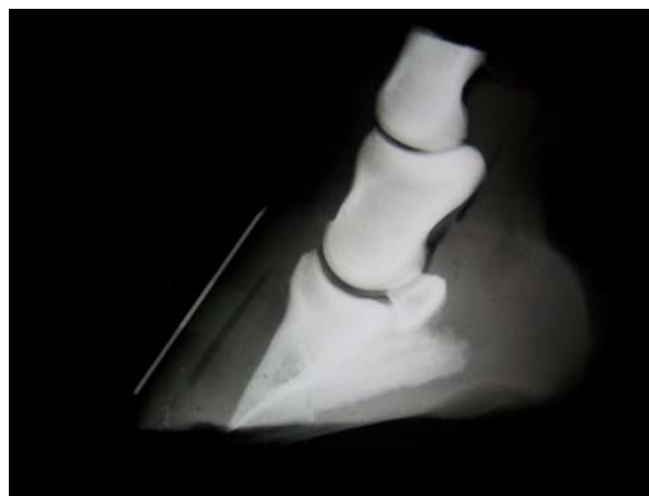
Foto N°8. Radiografía lateral con indicador de rotación de tercera falange es posible observar una zona radiolúcida correspondiente a aire entre el podófilo y querafilo.

para acentuar la marcación de la pared dorsal del casco (Foto N°8). Esta técnica facilitará una comparación segura con la tercera falange. Este alambre se puede dejar fijo con tela adhesiva y un vendaje para utilizarlo en cada evaluación radiológica. El grado de rotación puede determinarse por dos métodos. Se coloca sobre la radiografía un material transparente (por ej. papel de dibujar o un acetato). Se dibujan las líneas que representan la pared dorsal de la muralla y la tercera falange hasta el punto de intersección, midiendo el ángulo resultante. En el método más fácil se extienden las dos líneas hasta la superficie del suelo, donde se dibuja una línea horizontal adicional. El grado de rotación es la diferencia entre el ángulo formando por la pared dorsal de la muralla y la pared dorsal de la tercera falange con el suelo. Estas transparencias se pueden etiquetar, colocándoles fecha y lugar para tenerlas como punto de referencia para una evaluación seriada.