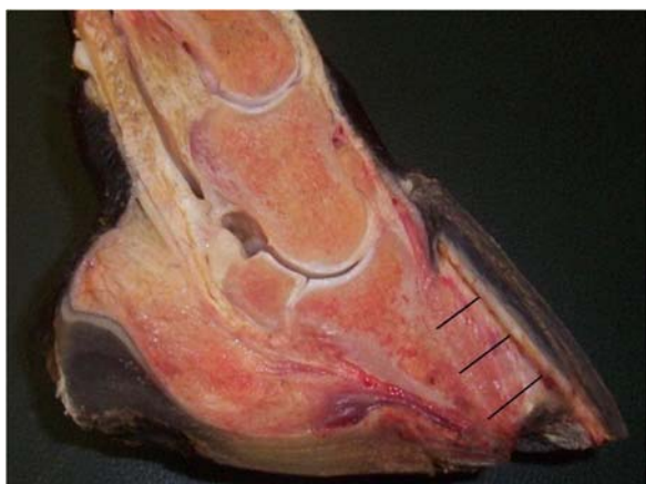
Foto N°9. Corte sagital del pie de un equino con Infosura, rotación de falange distal y perforación de la suela.

No se debe olvidar lo señalado anteriormente en el sentido de evaluar radiográficamente la falange distal mediante vistas laterales y dorso palmares, con el objeto de pesquisar cualquier tipo de desituación de la tercera falange en relación al casco.