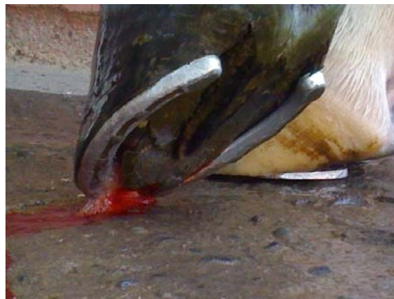
Foto N°6. Suela caída como producto de la rotación de la tercera falange.

la ranilla, representando la punta de la falange distal desplazada. El hallazgo de un defecto solar en esta localización indica la perforación de la suela por la falange distal, situación que afecta en forma adversa el pronóstico (Foto N°7).