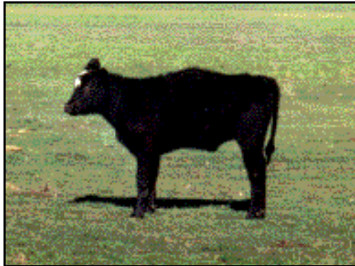
Vaquillona con xifosis pronunciada

Lomo o riñonada: Limita con el dorso, grupa, cadera, flanco. La base ósea son las vértebras lumbares cuyas apófisis transversas están cubiertas por los músculos ileoespinales. Debe seguir la misma dirección del dorso. Son defectos los animales bajos de dorso-lomo (sillón o lordosis) y con lomo de mula (xifosis).