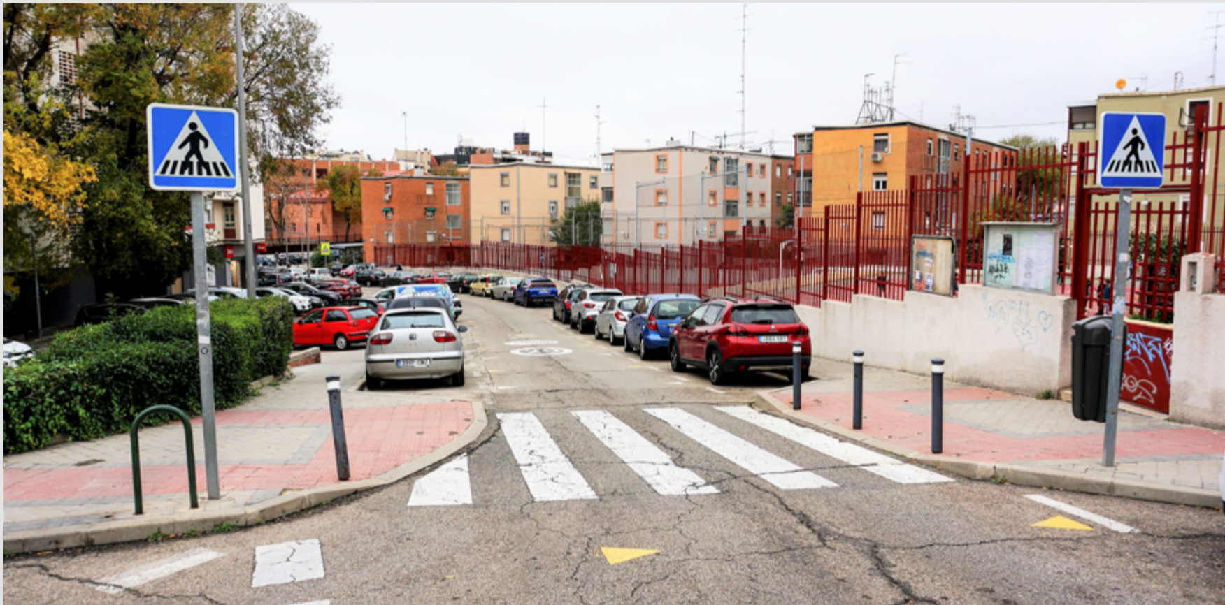
Paso de cebra frente a la entrada del colegio Esperanza en la calle Andorra. ÁNGEL SÁNCHEZ

S i preguntamos a cualquier madre o padre qué es lo que más le preocupa en el mundo, casi con total seguridad nos dirá que es la seguridad de sus hijos.