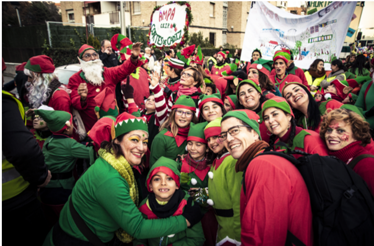
Pasacalles de duendes del AMPA del colegio Cortes de Cádiz en la Cabalgata Participativa 2020. SANDRA BLANCO

El argumento del dinero que todo lo puede se imponía al de la ilusión y el trabajo colectivo. Una empresa que sepa, que se dedique profesionalmente, ¿cómo no va a hacerlo mejor que las simples vecinas y vecinos que solo ponen su trabajo, su experiencia y sus ganas? Para la lógica de quien todo lo mercantiliza no había dudas. Y a ello se pusieron privatizando la Cabalgata de Hortaleza. Lo que desconocían es que así nos hacían el mejor favor que pudieran imaginar. Sin saberlo nos convocaron a demostrar que el verdadero poder, el que hace cambiar las