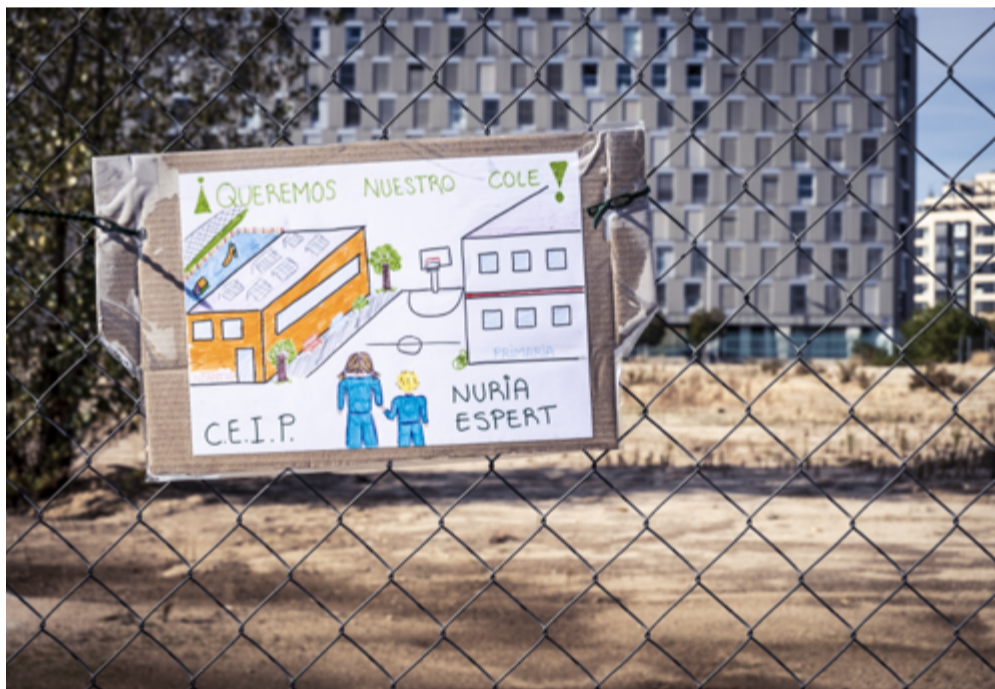
Cartel colgado en la valla de la parcela del inacabado colegio público Nuria Espert de Valdebebas.

“Nos quieren plantar un concertado sin haber instituto público. Eso no es libertad de elección”