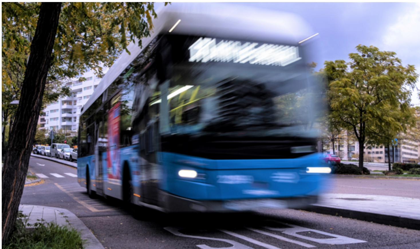
En el proyecto de los presupuestos municipales para 2023, se incluye una línea de autobús que conecte Sanchinarro y Valdebebas con el Ramón y Cajal. SANDRA BLANCO