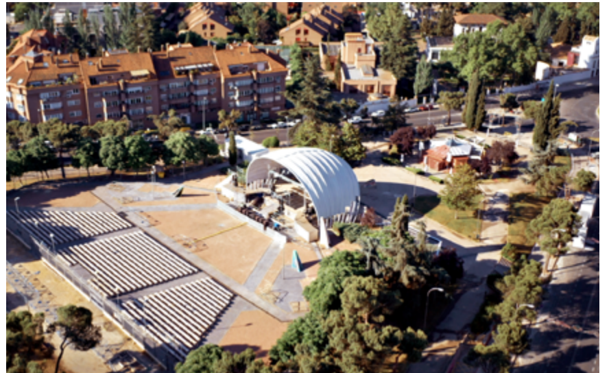
El auditorio Pilar García Peña del parque Pinar del Rey desde el aire.