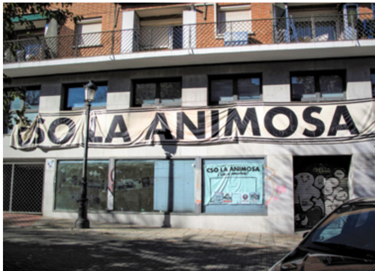
A la izquierda, entrada del CSO La Animosa. A la derecha, arriba, el gimnasio y, abajo, la biblioteca popular que alberga. JULIA MANSO

En su primer comunicado, los responsables de dicha okupación mostraron su disposición para poner este espacio al servicio de las "necesidades reales" de los vecinos, así como para "dar más vida a un barrio de referencia como es Hortaleza, falta de lugares destinados al interés común y no al negocio". En lo colectivo encontramos el origen de su nombre, que homenajea a la Sociedad de Obreros Agricultores