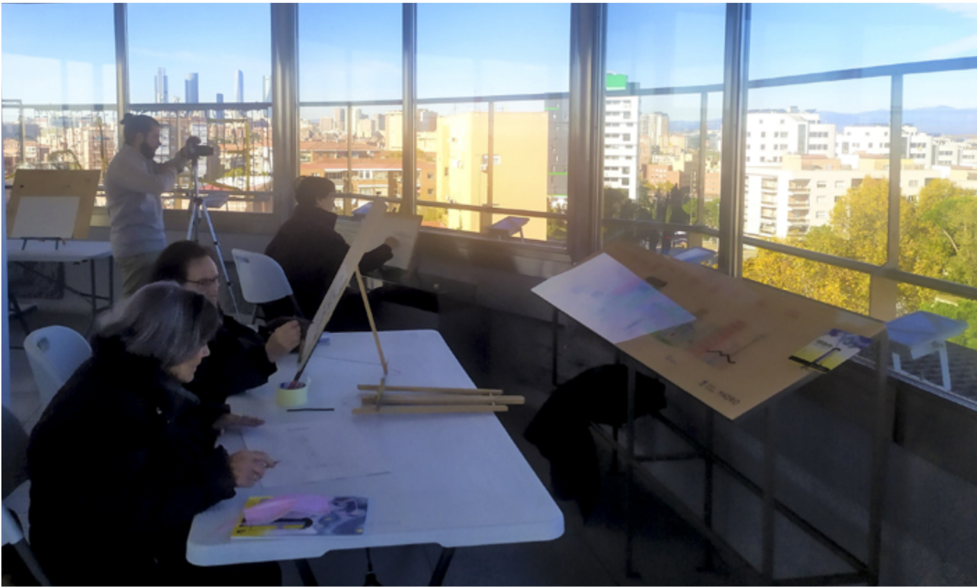
Artistas participantes en el encuentro de dibujo rápido de Hortaleza, en el mirador del Silo.