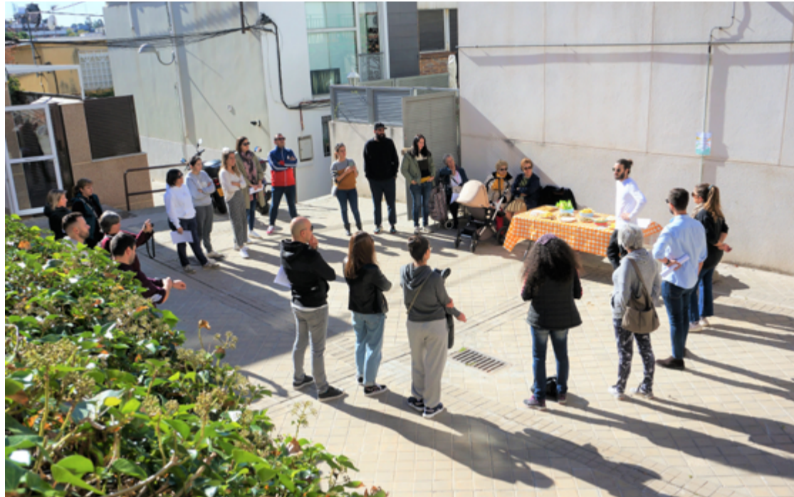
Vecinas y vecinos asistentes a la presentación de la asociación vecinal Las Casitas de Gomeznarro. ÁNGEL SÁNCHEZ

Pero también pretende promover iniciativas de recuperación, rehabilitación y mantenimiento de los espacios comunes, así como promover la creación de dotaciones de espacios