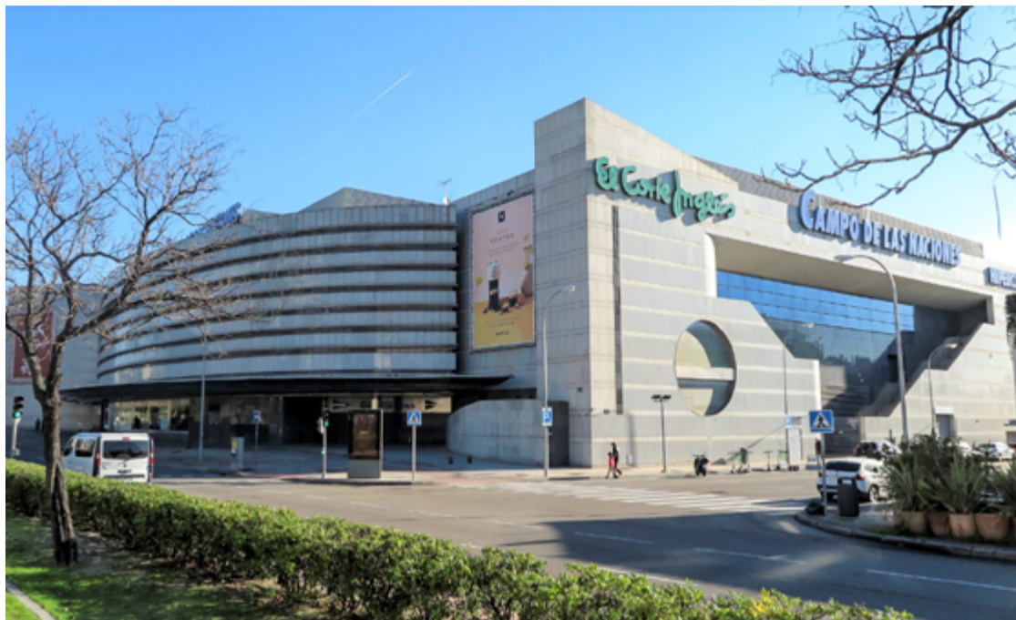
Entrada de El Corte Inglés de Campo de las Naciones. PATRICIA GARCÍA MARTÍNEZ (#TROPAAAAA de ADISLI)

Según elEconomista.es , el centro comercial de Campo de las Naciones es uno de los más rentables de España para la compañía.