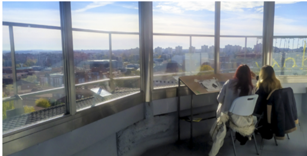
Las magníficas vistas del distrito que se contemplan desde el Silo sirvieron de inspiración a las artistas.

El mirador es una auténtica joya que muy pocos conocen y las vistas son inigualables. Es el lugar perfecto para dibujar, para pintar, para hacer fotografía o para buscar en el horizonte