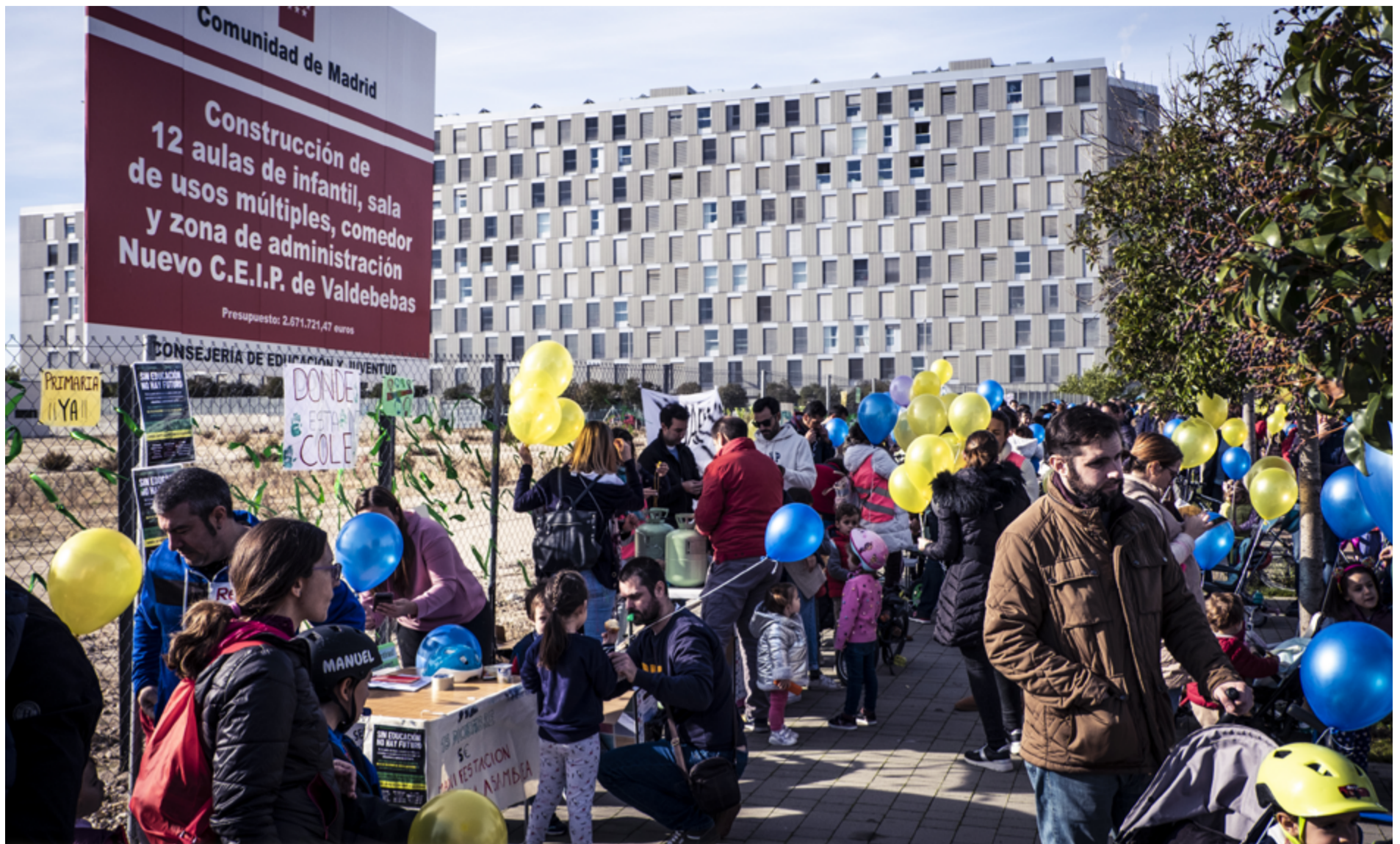
Mayores y pequeños reunidos el pasado 27 de diciembre junto a la parcela del Nuria Espert para reclamar la culminación del colegio. SANDRA BLANCO.