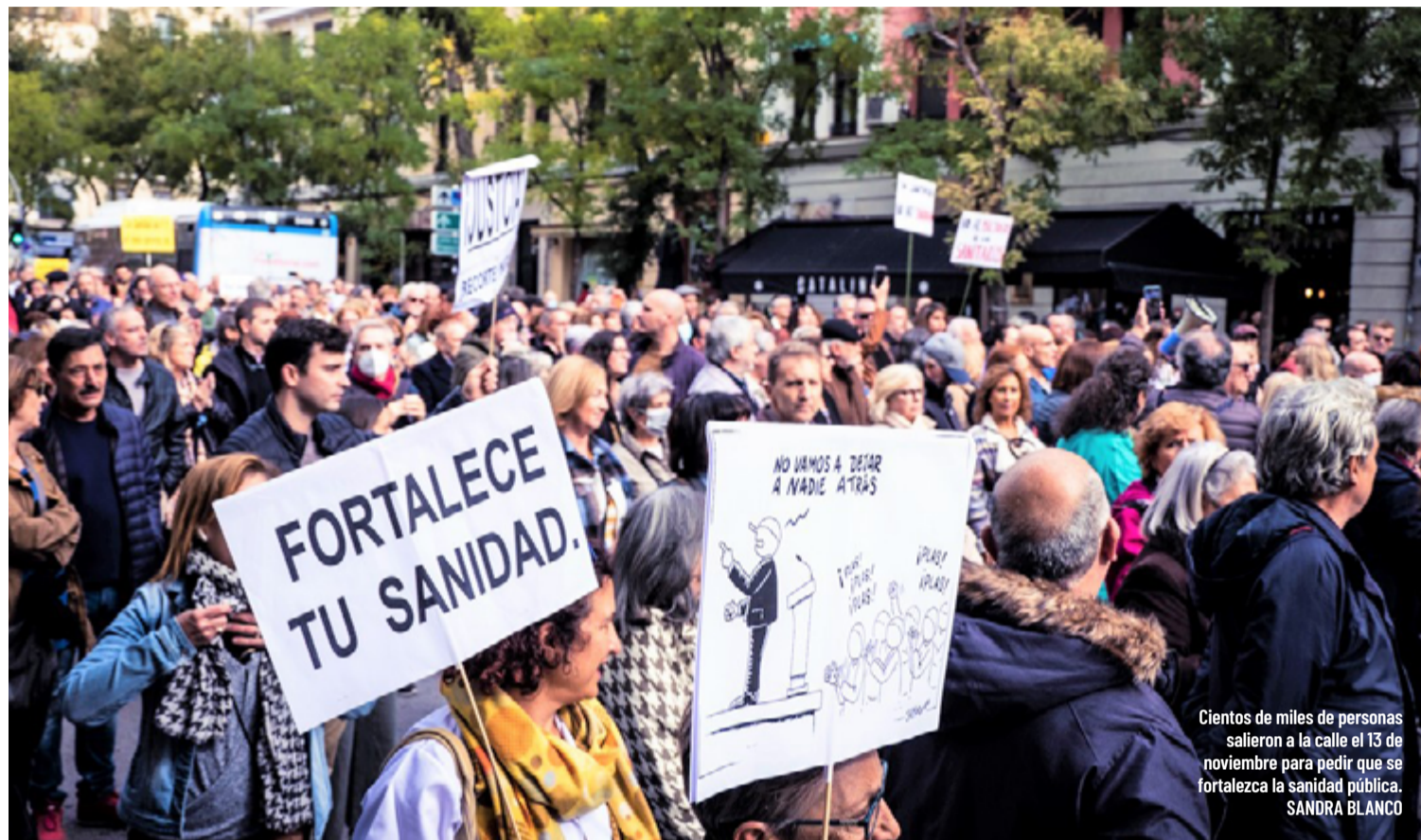
Cientos de miles de personas salieron a la calle el 13 de noviembre para pedir que se fortalezca la sanidad pública. SANDRA BLANCO

Los médicos y pediatras de Atención Primaria de la Comunidad de Madrid se ponen en huelga para reclamar más contrataciones, mientras el plan de la Consejería de Sanidad sigue ofreciendo servicios de urgencias extrahospitalarias sin la plantilla completa