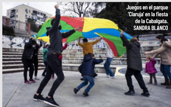
Juegos en el parque 'Claruja' en la fiesta de la Cabalgata. SANDRA BLANCO

Como es habitual, la coordinadora de la Cabalgata Participativa de Hortaleza está preparando diferentes actos festivos para que la ilusión por la llegada de los Reyes Magos de Oriente a nuestro distrito se disfrute desde semanas antes al 5 de enero.