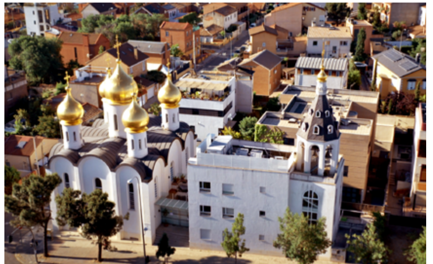
La catedral ortodoxa Santa María Magdalena, en la Gran Vía de Hortaleza, con el barrio de San Fernando de Canillas detrás.