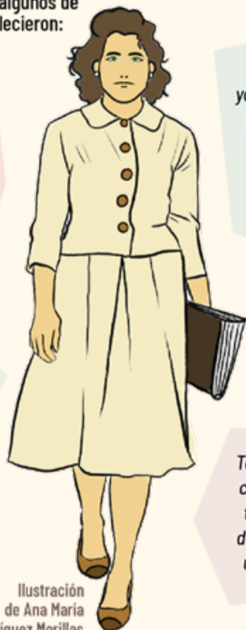
Ilustración de Ana María Rodríguez Morillas.

Tanto los hombres como las mujeres tienen el mismo derecho de recibir un salario digno.