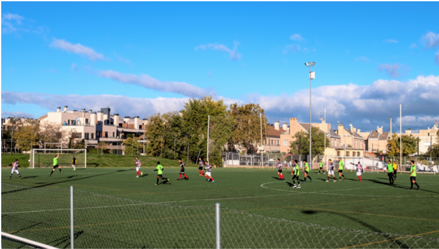
Partido disputado en el campo del club deportivo Olímpico de Hortaleza, en el barrio de Las Cárcavas.

La Junta Municipal de Hortaleza transforma la forma jurídica de la cesión de uso gratuita de los campos de fútbol municipales a las asociaciones y clubes deportivos, asumiendo el coste de los suministros