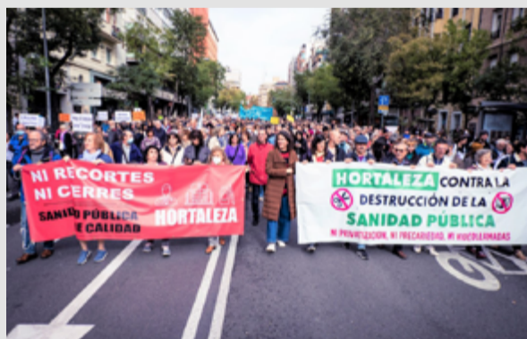
Pancartas de Hortaleza en la manifestación del 13 de noviembre. SANDRA BLANCO

Así comenzaron las concentraciones en el SUAP del centro de salud Mar Báltico; pero se dieron cuenta de que había que dar un paso más y comenzaron a recoger firmas pidiendo su reapertura para llevarlas a la Consejería de Sanidad (aquella día se entregaron 90.000 rúbricas, de las cuales más de 8.000 eran hortalinas).