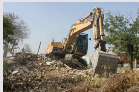
Demolición de la última casa del Poblado de Absorción de Canillas.

Finalmente, el 15 de junio de 2022 se inadmitió el recurso presentado tras varias sentencias