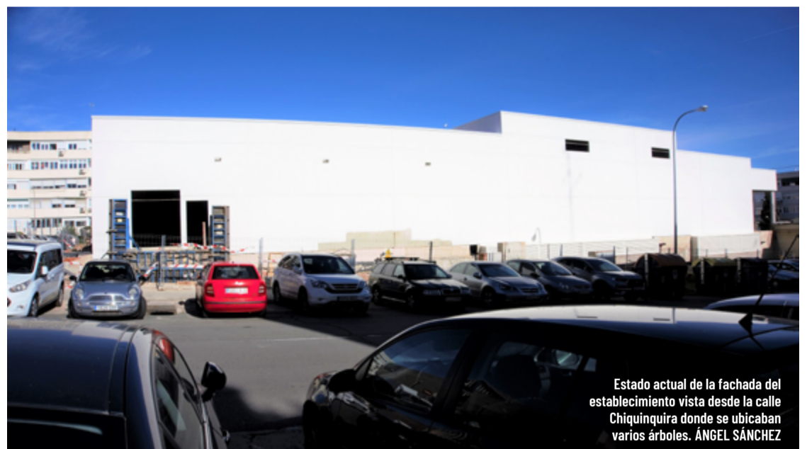
Estado actual de la fachada del establecimiento visto desde la calle Chiquinquira donde se ubicaban varios árboles. ÁNGEL SÁNCHEZ

En mayo de 2022, comenzó a tomar forma el aparcamiento exterior, que tendrá casi 40 plazas, lo que reafirmó la hipótesis de la apertura de un Lidl, aunque seguía sin tenerse confirmación de