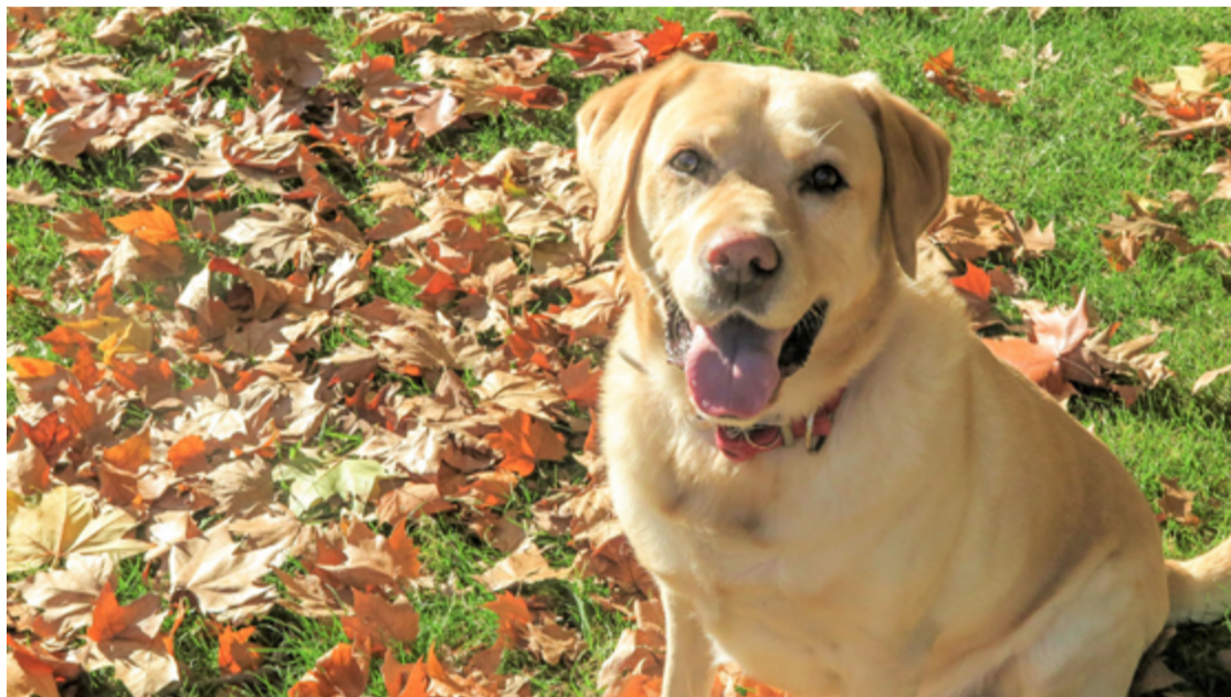
Uno de los vecinos perrunos de Hortaleza, disfrutando de un buen paseo en el parque.