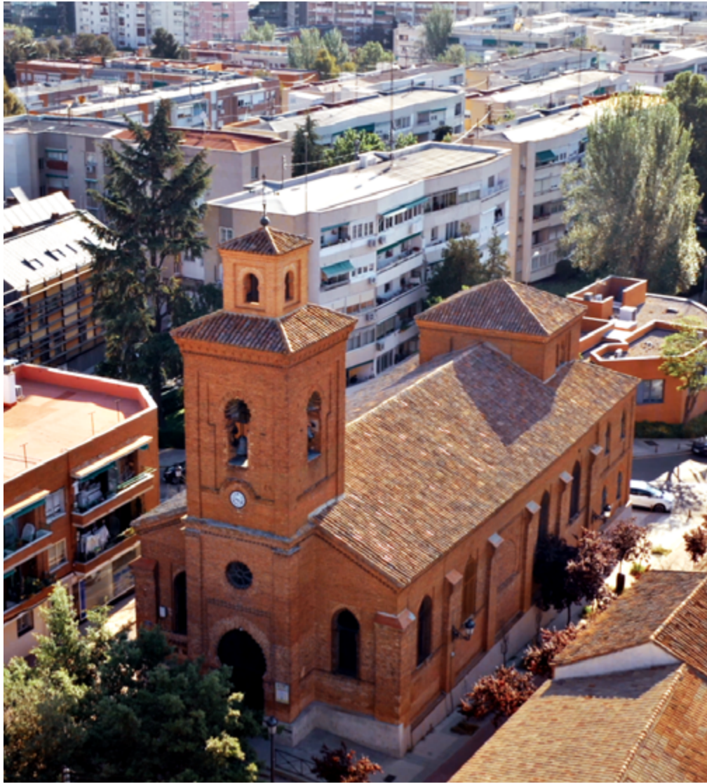
La iglesia de San Matías, en el casco antiguo de Hortaleza, con el barrio de San Lorenzo al fondo.