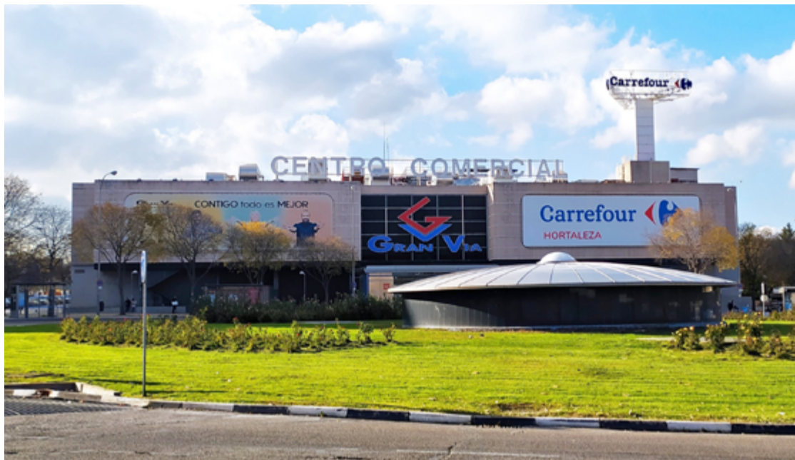
Fachada del centro comercial Gran Vía de Hortaleza desde la glorieta de Mar de Cristal. JULIA MANSO

El grupo francés Trema invirtió 19.000 millones de pesetas para levantar este centro “multifuncional” que integraba 17.000 metros cuadrados de oficinas y 29.000 de zona comercial, repartidos entre 69 tiendas y el hipermercado Pryca, además de cuatro plantas de apar-