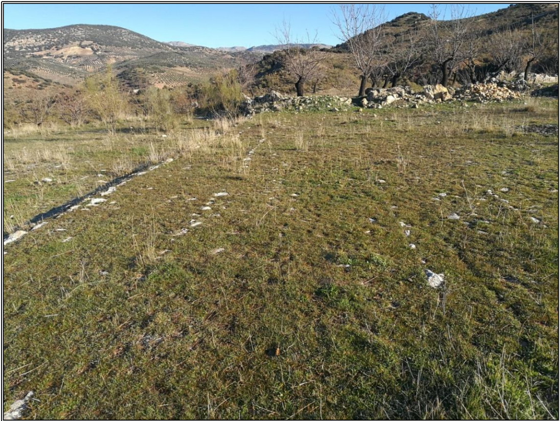
Detalle de la era 1. Se aprecian las piedras guías formando hileras perpendiculares.