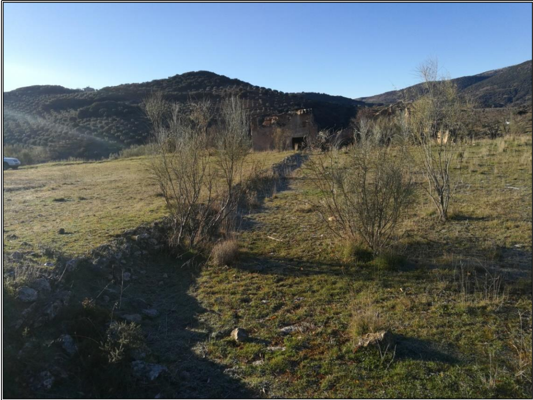
Vista panorámica de las Eras 1 y 2 y Cortijo de Jaenes. La era 1 se sitúa frente a la izquierda de la imagen en un plano superior y la era 2 a la derecha.