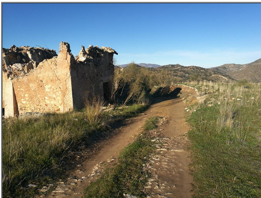
Detalle del carril que ha destruido parcialmente las eras.