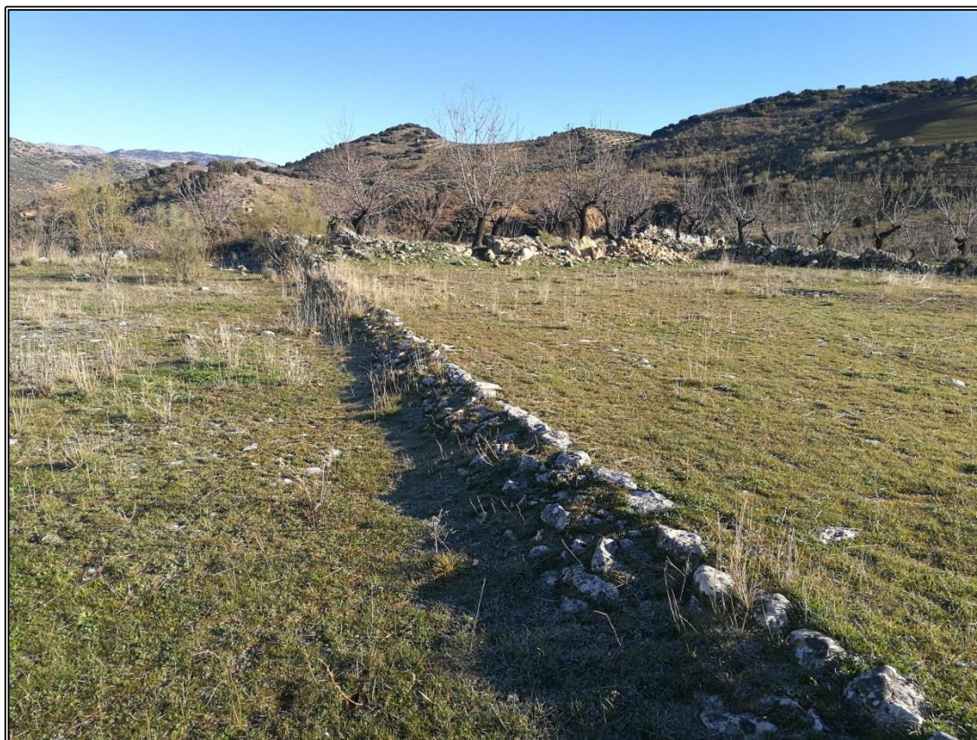
Detalle del empedrado de separación entre las eras 1 (a la derecha de la imagen) y la era 2 (a la izquierda de la imagen).