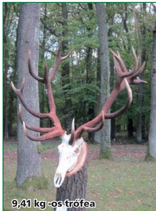
9,41 kg -os trófea

kettő aranyérmet kapott a trófeabírálaton. Erre még nem volt példa Erdőgazdaságunk történelmében. Agancssúlyuk 10,18kg és 9,41kg. Üdv a Vadásznak!