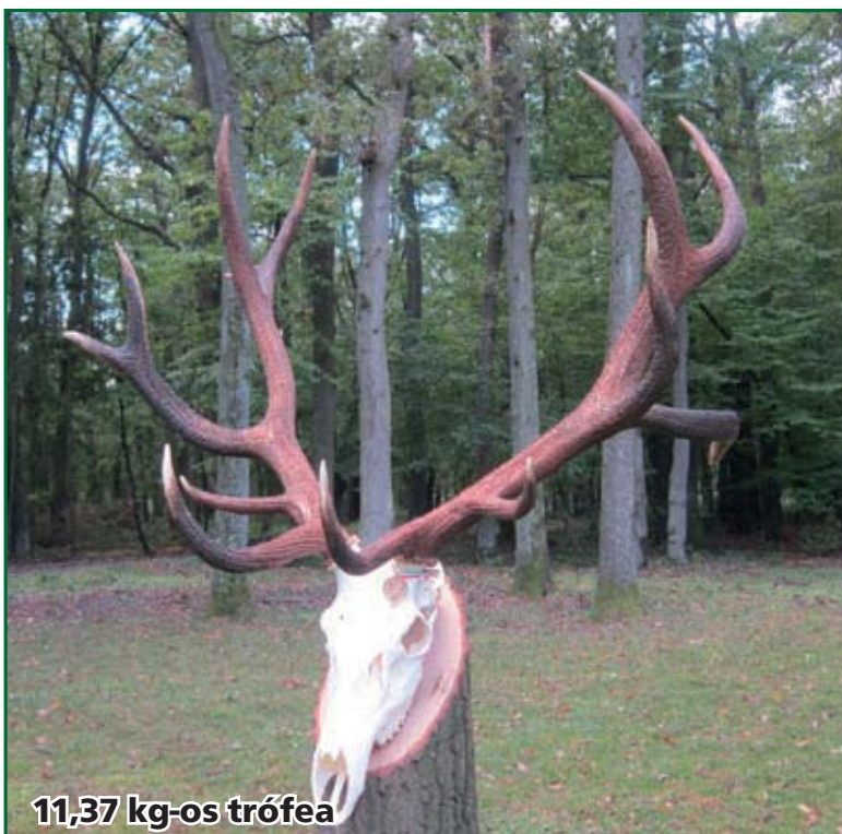
11,37 kg-os trófea