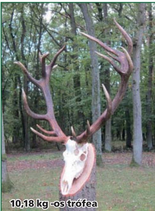
10,18 kg -os trófea