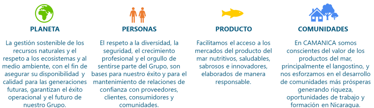
Figura 1. Principios guía o pilares, que conforman el Plan Director de RSC del Grupo.

Comprendemos y asumimos nuestro papel en el desarrollo sostenible social, económico y medioambiental sobre el que ejercemos influencia a través de nuestras operaciones.