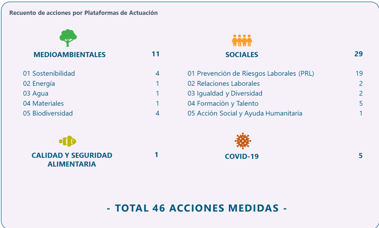
Figura 4. Recuento de acciones responsables con indicador cuantificado por plataforma de actuación.