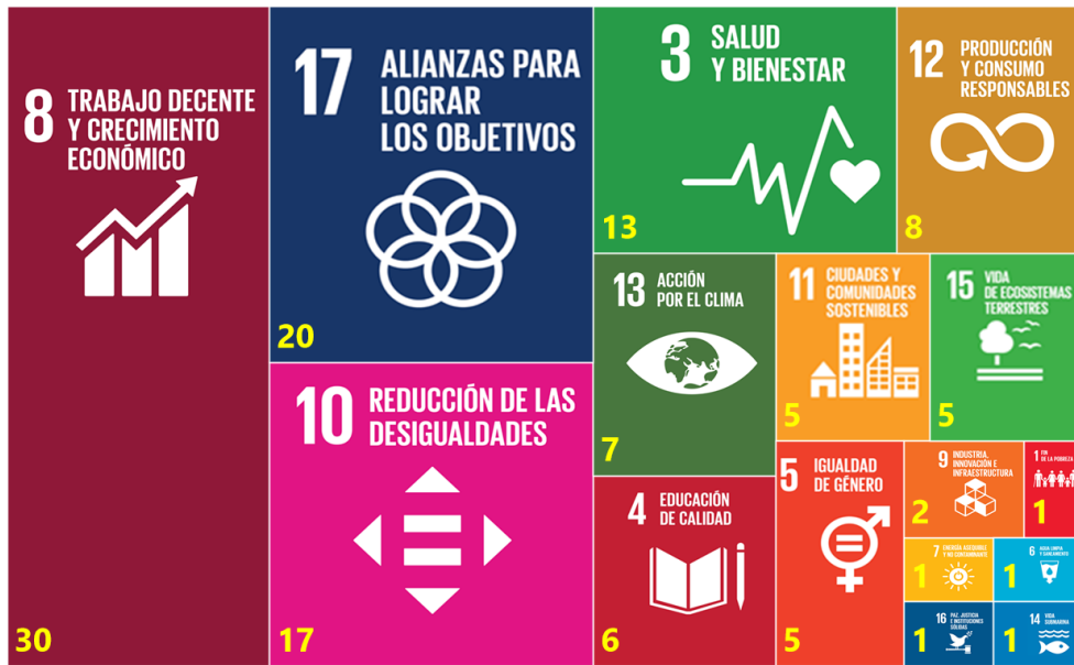
Figura 7. Número de acciones de la empresa CAMANICA con indicadores de impacto cuantificado (46) que contribuyen a los ODS.

Del análisis de la representación gráfica de las acciones responsables a cada ODS, concluimos que: