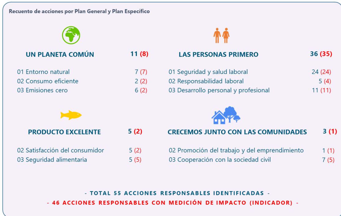
Figura 3. Recuento de acciones responsables en cada uno de los planes generales y específicos del PAR 2020.

De estas 55 acciones responsables identificadas, hemos medido el impacto en 46 de ellas (84% del total) (Fig.3).