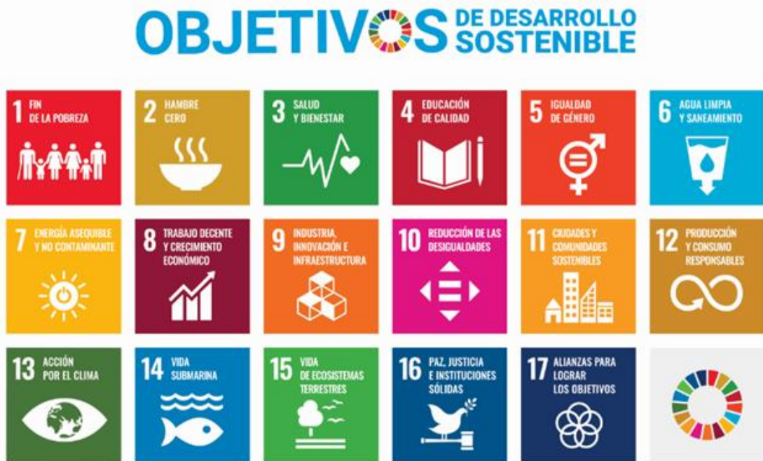
Figura 5. Objetivos de Desarrollo Sostenible.

En CAMANICA hemos incorporado los 17 ODS en todas las actividades a lo largo de la cadena de valor. Estamos convencidos del papel que los ODS ejercen en la sociedad y economía para lograr la mejora de la calidad de vida de las personas y de su entorno ( Fig. 5 ).