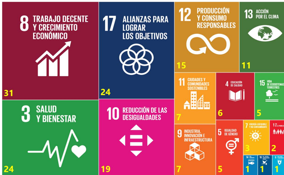
Figura 6. Número de acciones de la empresa CAMANICA (55) documentadas en 2020 que impactan en cada uno de los 17 ODS de la Agenda 2030 de la ONU.

Tal y como hemos mencionado anteriormente, a través del PAR hemos identificado un total de 46 acciones responsables con medición de impacto cuantificado.