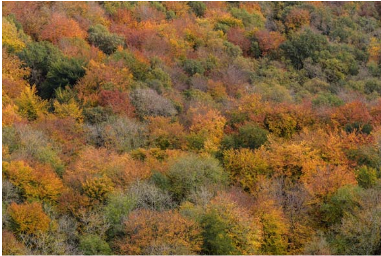
Un bosque mixto durante el cambio de estación

de cuarenta años como mecanismo de descomposición de la hojarasca en ambientes expuestos a elevados niveles de radiación solar . Aún así, su contribución al proceso de descomposición en sistemas áridos ha recibido atención sólo recientemente, y por tanto no se sabe demasiado aún sobre el papel y la relevancia que juega en estos ecosistemas.