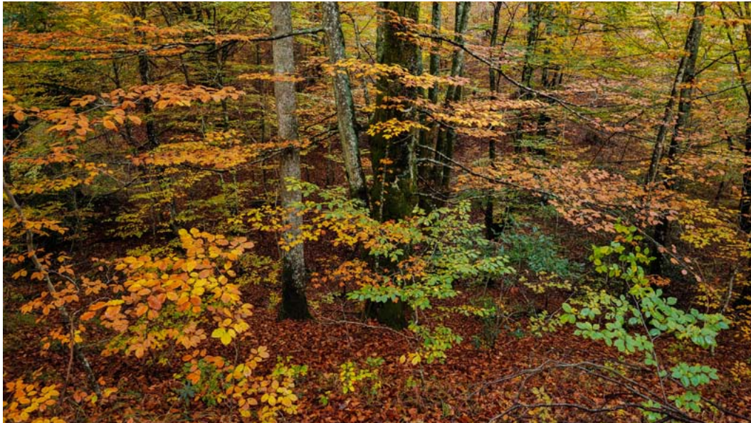
Hayedo de Peña Santiago

de descomposición), a escala diurna (y no estacional o anual como es habitual), y durante el periodo seco (cuando se asume que en estas zonas la descomposición es mínima o nula).