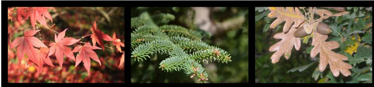
Hojas caducifolias de arce japonés palmeado, Acer palmatum , perennes de pinsapo, Abies pinsapo y marcescentes de mejojo, Quercus pyrenaica , en otoño

veles de las hormonas que inhiben el crecimiento (etileno y ácido abscísico) los que aumentan en la base de las hojas (peciolo) causando que las células se debiliten y finalmente la hoja caiga (abscisión). Antes de caer, el árbol reabsorbe varios de los compuestos foliares como el nitrógeno, elemento esencial para la planta.