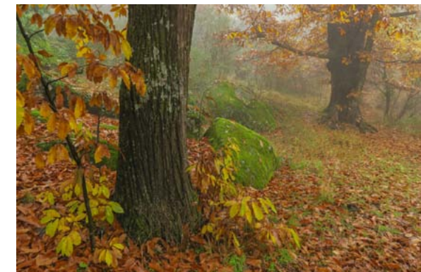
Las hojas secas cubren el suelo de un castañar

cantidad de carbono que hay en la atmósfera (750 Gt) y en la vegetación (610 Gt), es decir, son el segundo reservorio en el ciclo global de carbono, el primero son los océanos (38000 Gt). Además, la rápida tasa de renovación de la hojarasca hace que su descomposición sea uno de los componentes más dinámicos de este ciclo (Figura 1). Junto con la descomposición de la hojarasca, la descomposición microbiana de la materia orgánica del suelo es uno de los procesos que genera más dióxido de carbono en los ecosistemas terrestres, un flujo importante de carbono a la atmósfera. Por tanto, se trata de un proceso clave que determina la disponibilidad de nutrientes y el almacenamiento de carbono en los ecosistemas. Entender qué factores controlan la descomposición de hojarasca, su dinámica temporal, así como su respuesta al cambio climático, son aspectos cruciales para poder predecir cómo los ecosistemas terrestres y en general, el ciclo global del carbono, responderán a cambios futuros en el clima.