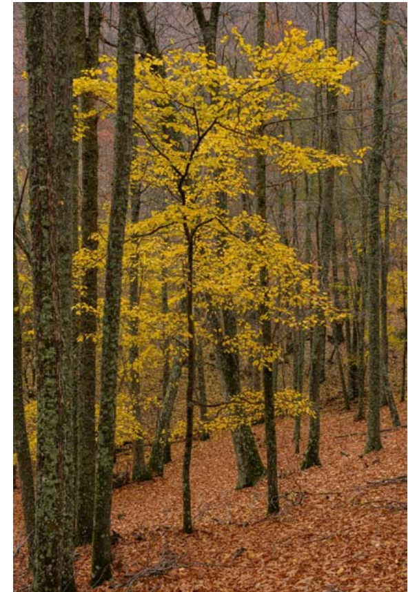
Castañar en el que destaca un Olmo de montaña

Esta desaparición de los pigmentos foliares viene determinada por las hormonas de crecimiento cuyos niveles dependen de la longitud del día (fotoperiodo) y de la temperatura. Con la llegada de la primavera las temperaturas y la duración del día aumentan y los niveles de hormonas de crecimiento (auxinas, citoquininas y giberelinas) también. Por el contrario, al acortarse los días y disminuir las temperaturas en otoño, son los ni-