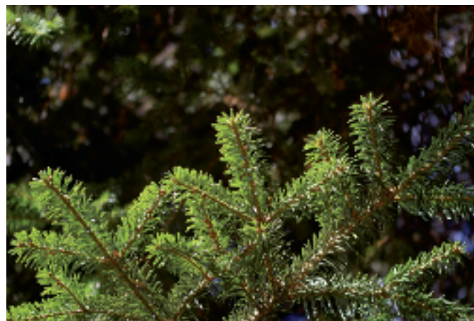
Emilio Laguna Lumbieres

En el Pallars, la trementina se usa como antiinflamatorio y como analgésico en dolores musculares , de articulaciones y neuralgias de diferentes etiologías (a veces añadiendo chocolate) y para el reumatismo en forma de emplastos, con la trementina puesta sobre papel de estraza y a veces con un baño posterior con grasa de cerdo y salmuera. Se cree que el emplasto queda más o menos pegado dependiendo de la naturaleza de la enfermedad y de la duración de la misma, y que se despegar el fomento cuando el dolor ha desaparecido [4,5,13]. También se usa para el dolor de huesos en emplasto mojado con ella