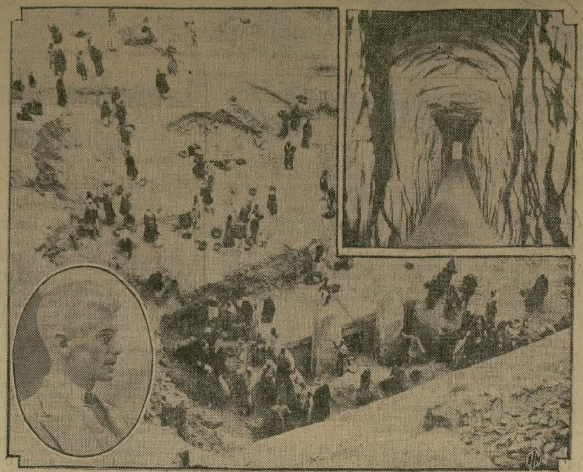
Estas fotografías, las más recientes que han llegado a los Estados Unidos, muestran las actividades de la expedición dirigida por el profesor Alan Rowe. Las excavaciones están siendo llevadas a cabo con gran actividad, con objeto de formular un detenido estudio de tan monumental obra.