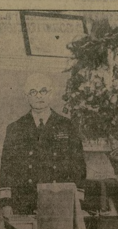
Bellissimo bouquet de flores, regalado al almirante Philip Andrews, comandante del primer distrito naval de Boston, al cumplir sus 64 años de meritosos servicios en la marina norteamericana.