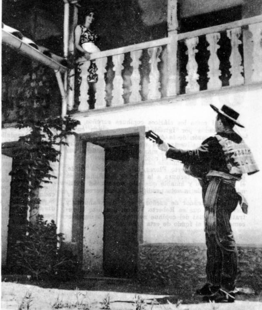
"Canto a la amada".

Muchos años antes que Rubén Darío, en el siglo XVIII, el viajero inglés John Byron, abuelo del poeta Lord Byron, durante