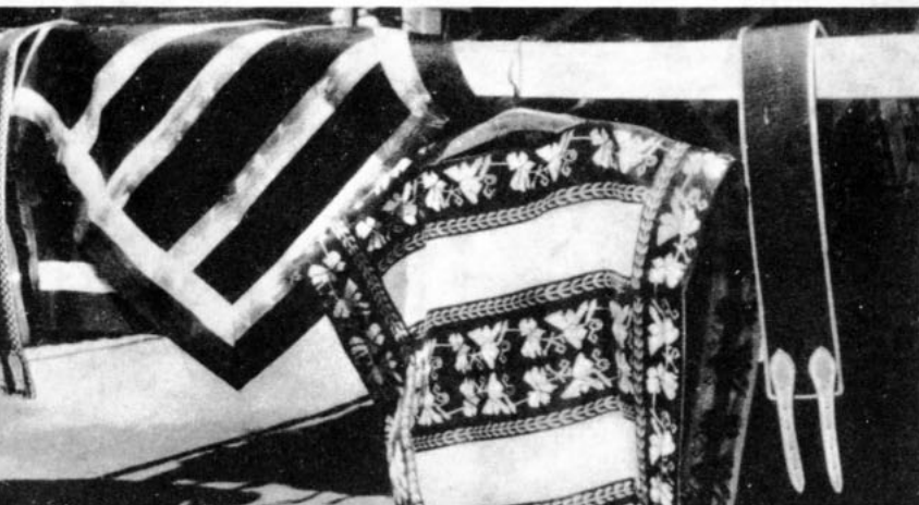
Chamantos y fajas

No podríamos terminar este esbozo histórico del huaso chileno si no dedicáramos un puñado de líneas a esas cualidades invisibles, pero que siempre están latentes en nuestro hombre de campo, porque constituyen su idiosincrasia plasmada en la ge-