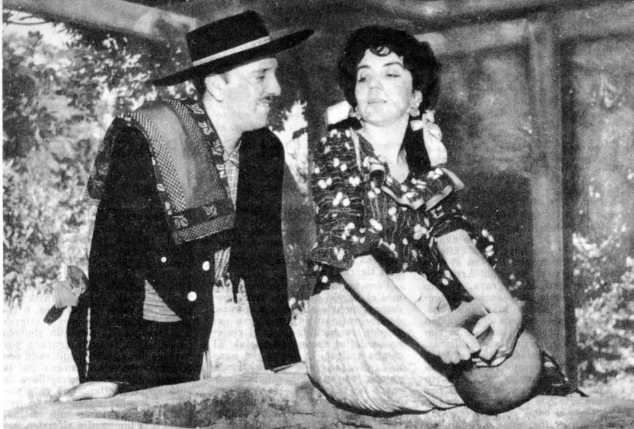
Haciéndole el amor a su "china".

nerosidad, y la hombría que puede llegar a la heroicidad, si el destino así se lo depara en las grandes encrucijadas de la vida.