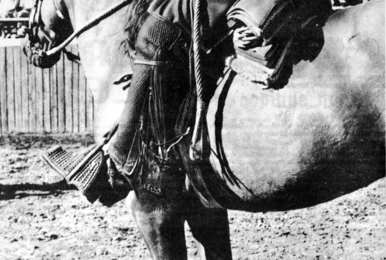
Detalle de los aperos del huaso

mantiene, pero poco a poco, a medida que el país se organiza, el huaso también evoluciona; cambia el pantalón bombacho por el ajustado dentro de las altas botas camperas atiborradas de hebillas y corrienes. Del bonete maulino de alto copete puntiagudo pasó con el devenir del tiempo al sombrero alón actual que recuerda el clásico sombrero cordobés que es herencia del chulo español.