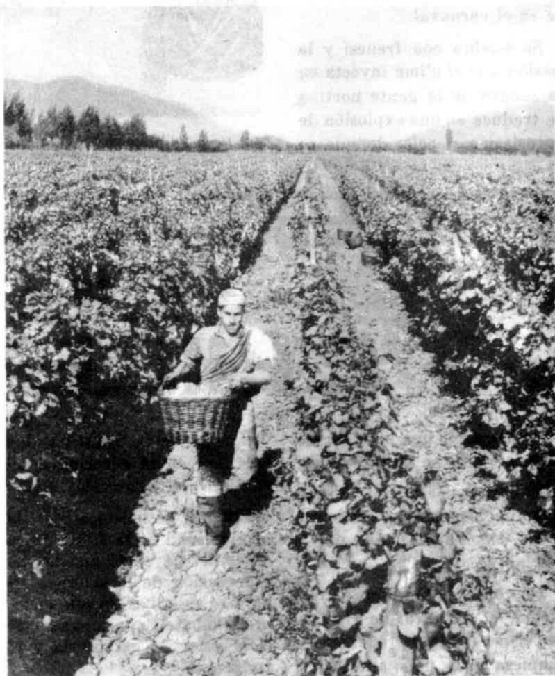
Imponentes viñedos chilenos

En otra crónica nos referiremos al rodeo y a la trilla. Por ahora haremos una breve