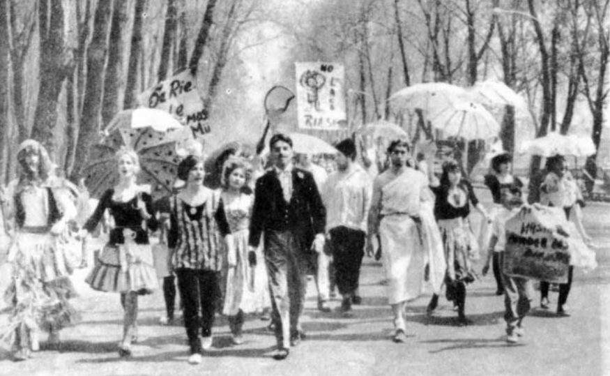
Caravana estudiantil en la fiesta de la primavera avanza por el Parque Forestal

maravillosa para los que tienen 20 años. Pero no se crea por esto que el carnaval es sólo patrimonio de los jóvenes. En el norte y especialmente en Iquique el carnaval es la fiesta de todos: hombres, mujeres y niños de todas las edades participan con el mismo frenesí en las gratas batallas carnavalescas.