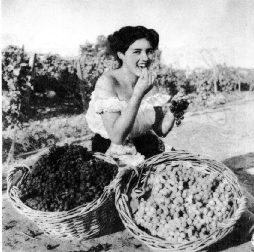
Una hermosa vendimiadora chilena

Y todo esto da pábulo para que se desate la fiesta criollaza con cueca, poncho y espuela junto a las cajas armoniosas de las vihuelas encintadas para la fiesta campera.