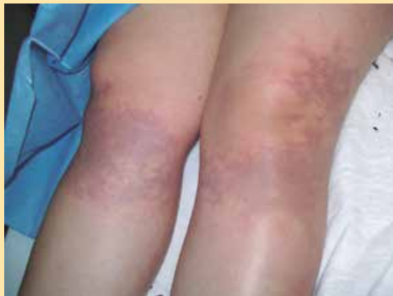
Figura 2. Figuras de Lichtenberg en rodillas y tercio proximal de ambas piernas.