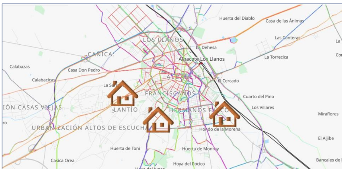
Fig. 1: Zonas de desarrollo de los asentamientos en la ciudad de Albacete (Cartografía de OpenStreetMap)

En primer lugar son asentamientos muy próximos al núcleo urbano y de dimensiones más reducidas. Fuera de la temporada agrícola casi no están habitados muchos de ellos y en temporada su número crece hasta triplicarse. En el momento álgido de la temporada se estima que viven en los asentamientos 686 personas y de manera permanente son 279, aunque estas cifras son muy variables y en una de las entrevistas se apunta hasta 1.000 personas en plena temporada (Juani García Vitoria y Nieves Navarro – Concejalas del Ayuntamiento de Albacete). El mayor asentamiento es el de Casa Grande 1-8, con 135 personas viviendo de manera permanente y más de 300 personas en temporada agrícola.