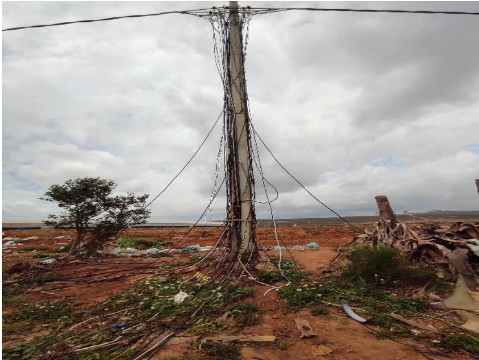
Foto 4.- Enganches de luz ante la inexistencia de acceso al suministro.

Tampoco existe acceso a retirada de residuos, salvo en los dos asentamientos de Almería capital que se encuentran en el casco urbano. Y solo tres asentamientos tienen una parada de autobús cercana: las dos mencionadas de Almería capital, así como uno en Níjar. Este hecho dificulta sobremanera la vida cotidiana de los habitantes de los asentamientos y amplifica su situación de aislamiento.