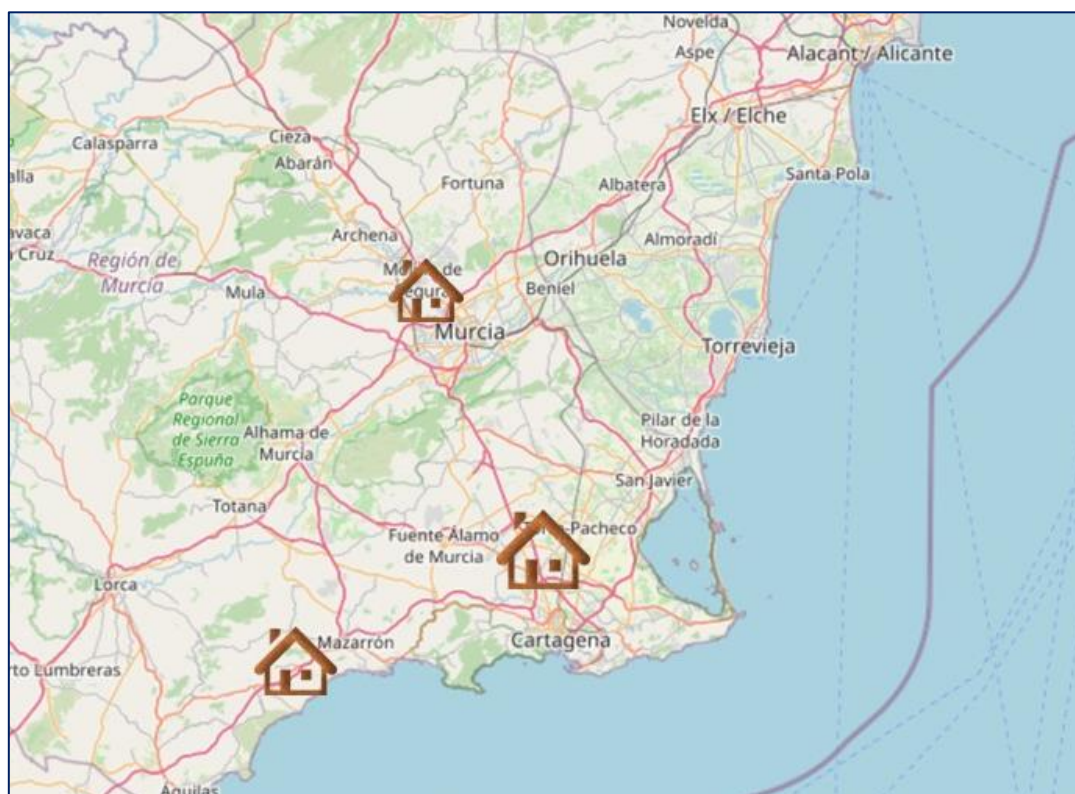
Fig. 4: Zonas de desarrollo de los asentamientos en la provincia de Murcia (Cartografía de OpenStreetMap)

En el caso de Murcia destaca el bajo número de personas viviendo en asentamientos grandes (de más de 20 personas), existiendo un número similar de personas en pequeños espacios y diseminados. En este caso, el número total de personas es de 270, muy inferior a los datos de Almería y Huelva y similar a los datos de residentes permanentes en asentamientos de Albacete.