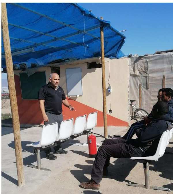
FOTO 7.- TALLER DE PREVENCIÓN Y EXTINCIÓN DE INCENDIOS

Igualmente se imparten talleres de energías renovables. En estos talleres se ofrece información sobre ciertas formas de energía, especialmente la solar, que pueden servir de alternativa a los enganches que, a su vez, son una de las causas de estos incendios. Con estos talleres también se colocaron algunas farolas solares que pueden reducir el riesgo de incendios.