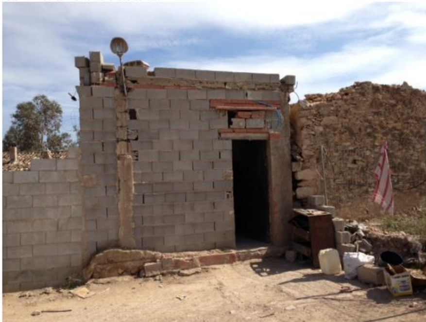
FOTO 5 - ASENTAMIENTO TORRE PACHECO

en bidones o garrafas desde la población más cercana. El suministro de luz se realiza a través de enganches ilegales a la red eléctrica y la recogida de residuos no existe en los asentamientos más aislados. Los medios de transporte habituales son bicicletas, coches particulares y algún taxi informal.