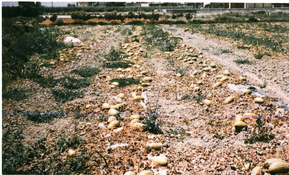
Fig. 1: Aspecto general de una parcela de melón afectada de muerte súbita.