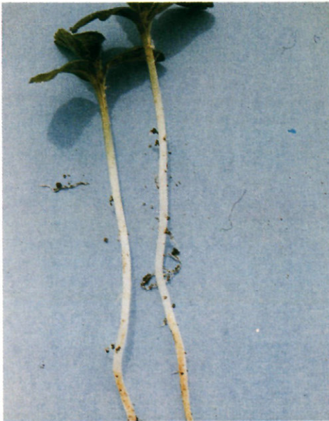
Fig. 4: Raíz de melón sometida a riego por goteo y subirrigación. Obsérvese la necrosis de algunas raíces, la carencia casi total de raicillas y los abultamientos en raíces principales correspondientes a los puntos de inserción de las antiguas raicillas secundarias ya desaparecidas.