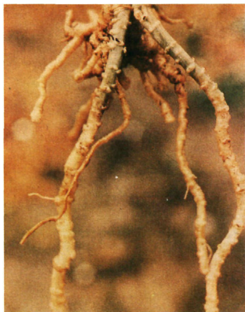
Fig. 2: Decoloración y acorchamiento de hipocotilo en plántula de melón. Por encima de la zona afectada se puede apreciar la emisión de nuevas raicillas que, poste-

en zonas productoras de la provincia de Valencia se encontró que en los campos afectados una media de plantas de melón muertas por colapso de un 31% al final del cultivo (GARCIA-JIMÉNEZ Y VELAZQUEZ, 1990). La enfermedad aparece muy extendida por toda la costa oriental española desde Cataluña a Andalucía, y también han aparecido otros focos en zonas centrales de la Península y en Baleares.