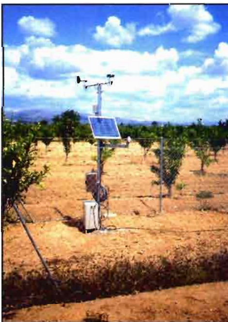
Estación en huerto de naranjos bajo malla en el IVIA.

Con el Instituto Valenciano de Investigaciones Agrarias (IVIA) se colabora en el estudio del riego deficitario controlado de la vid; y con la Universidad Politécnica de Valencia en