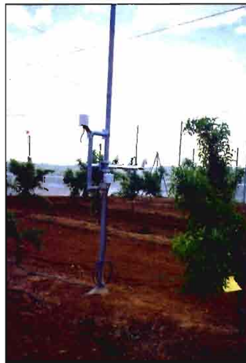
Estación meteorológica para el cálculo de la evapotranspiración en el IVIA (Moncada).