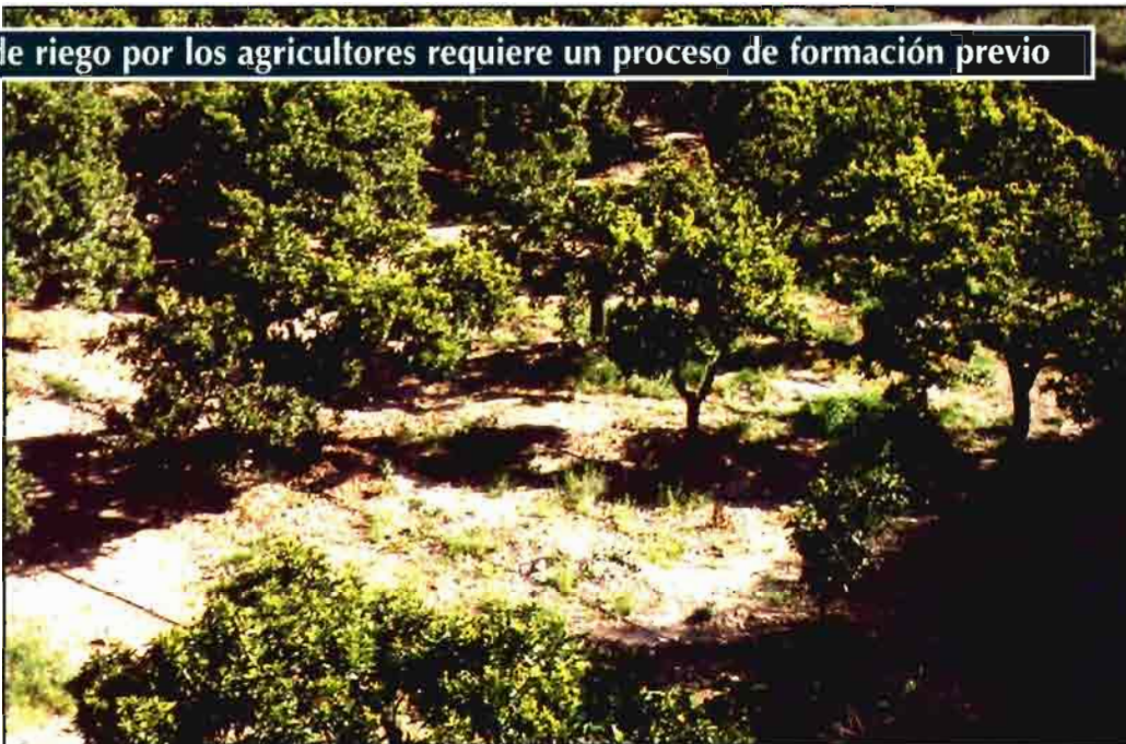
Casi un 20% del regadío en la Comunidad Valenciana es por goteo.