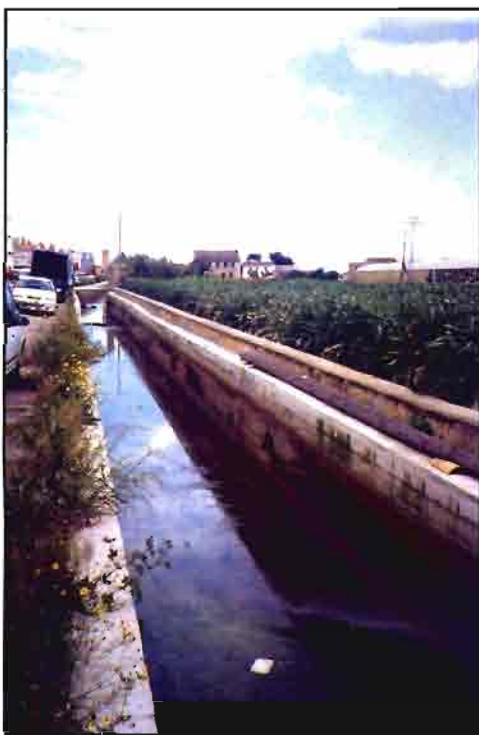
El agua es un bien escaso y expuesto a contaminación.

las redes existentes para optimizar el uso y la eficiencia del agua, está contribuyendo al rápido crecimiento de las superficies que se benefician de este sistema de riego.