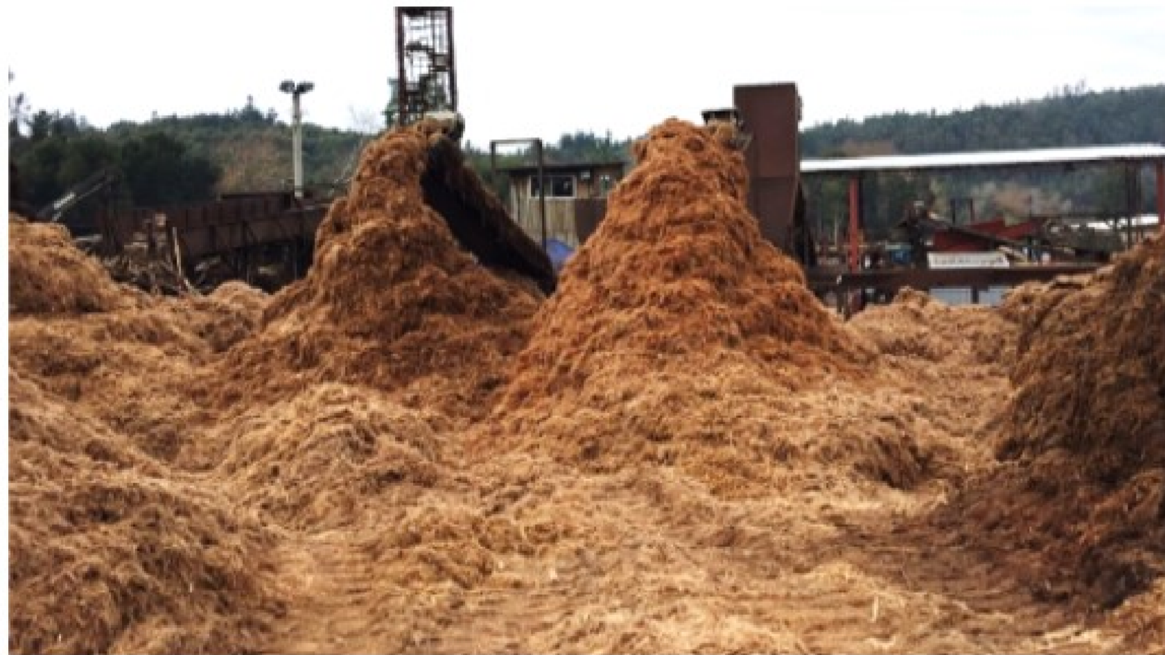
Materia triturado (hoy combustible)