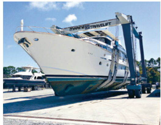
150 CII - Alabama, USA