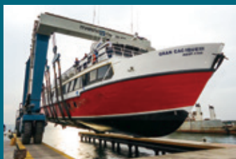
300 CII - Cumaná, Venezuela