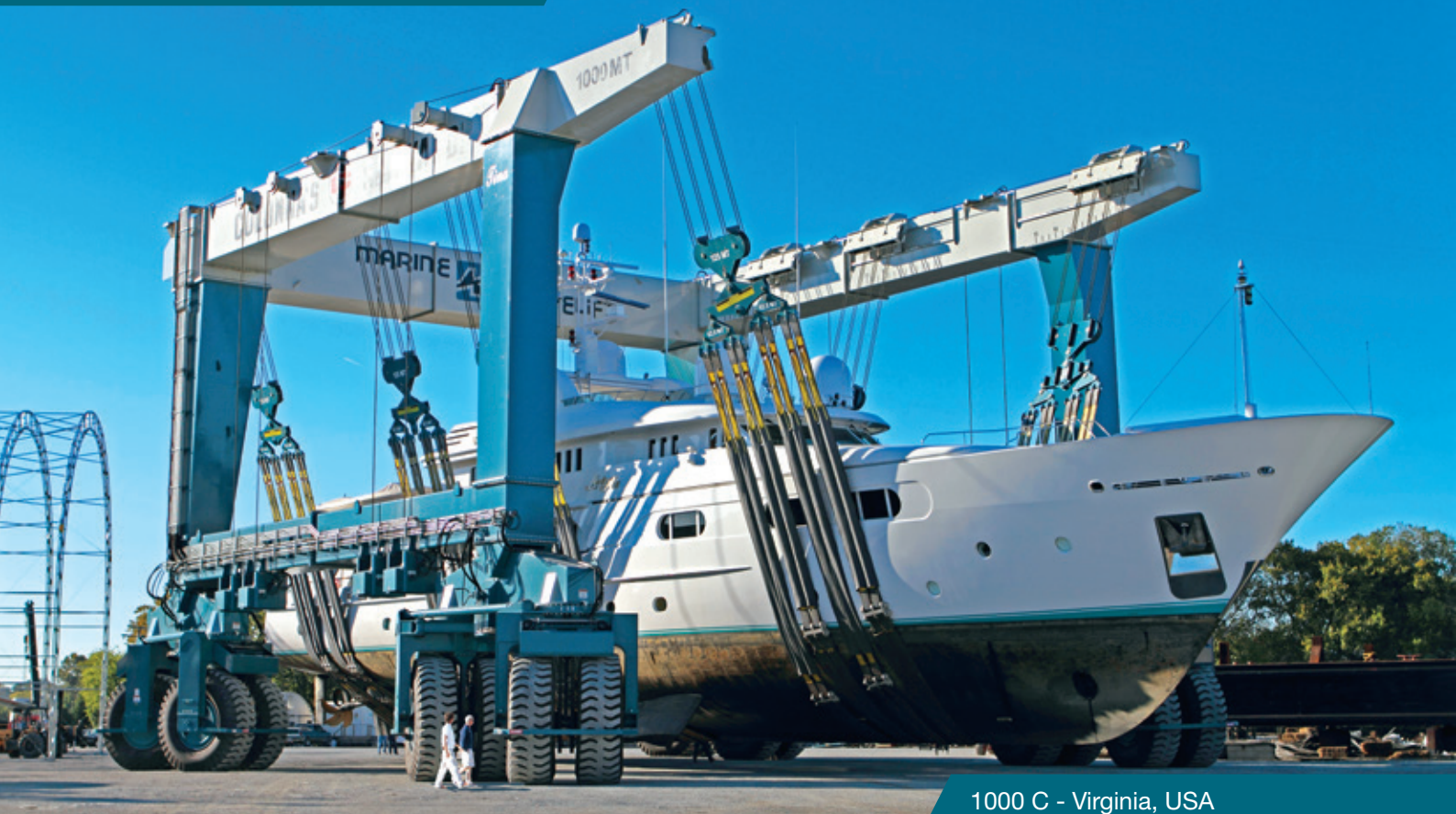
1000 C - Virginia, USA

Se requiere la integridad y el rendimiento para construir una reputación de fiabilidad.