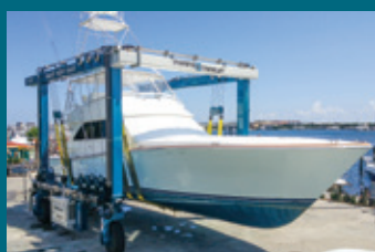
50 BFMII - Florida, USA