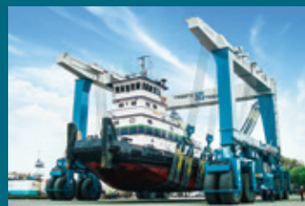
1000 C - Virginia, USA