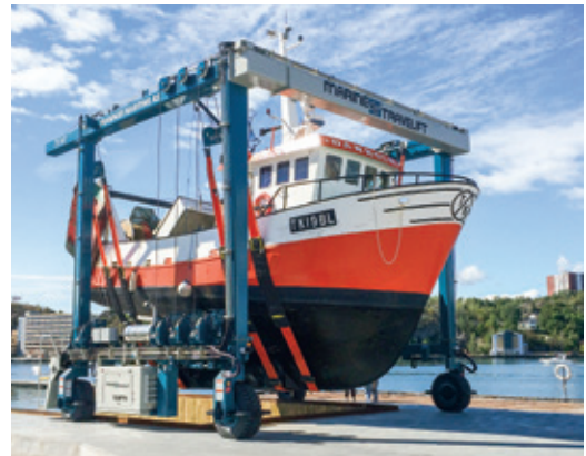
75 BFMII - Sandefjord, Norway