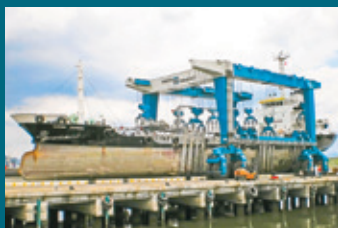
700 C - Perak Darul Ridzuan, Malaysia