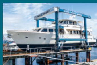
100 BFMII - British Columbia, Canada