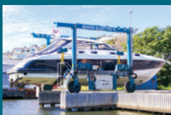
35 BFMII - Gressvik, Norway