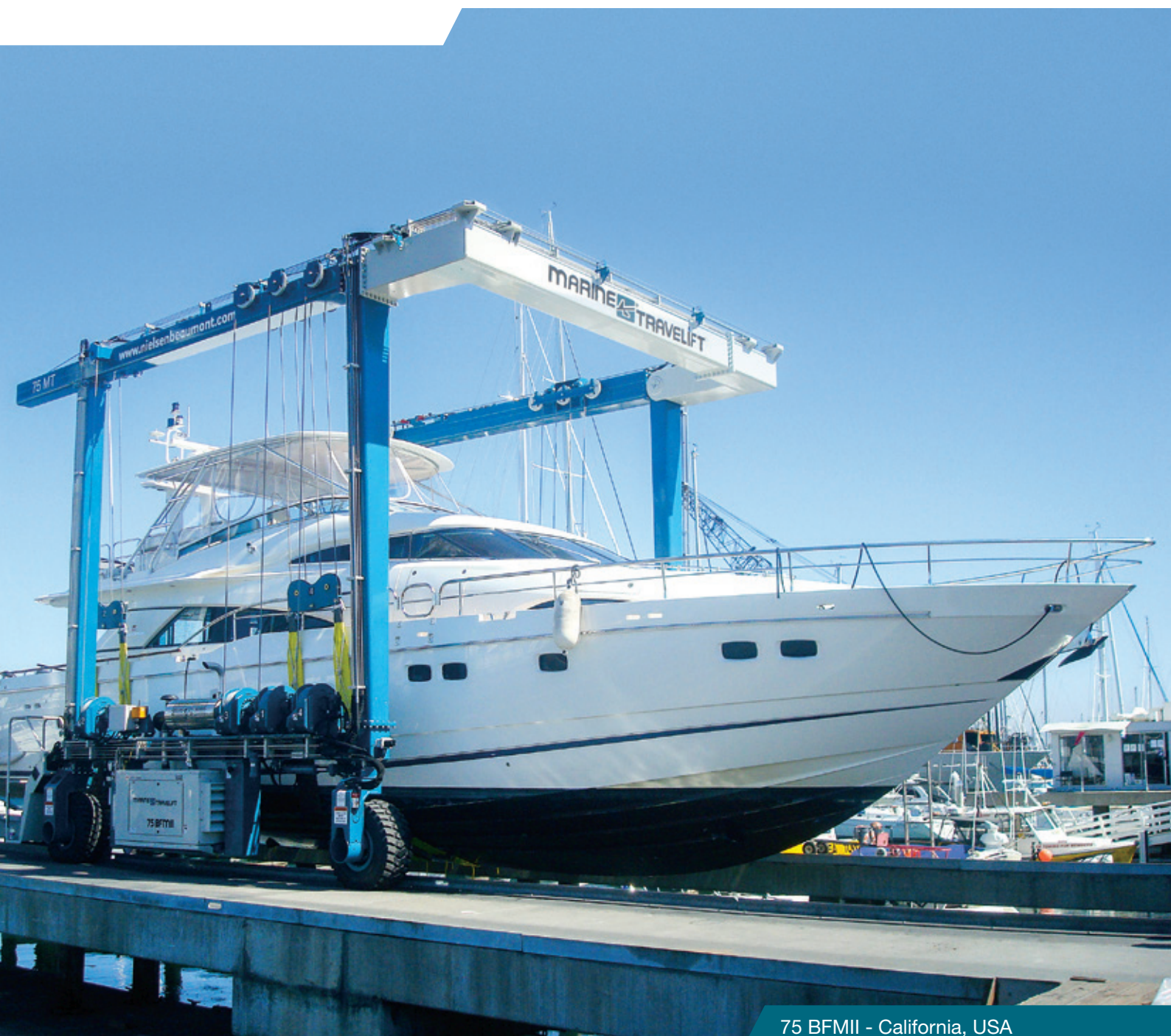
75 BFMII - California, USA