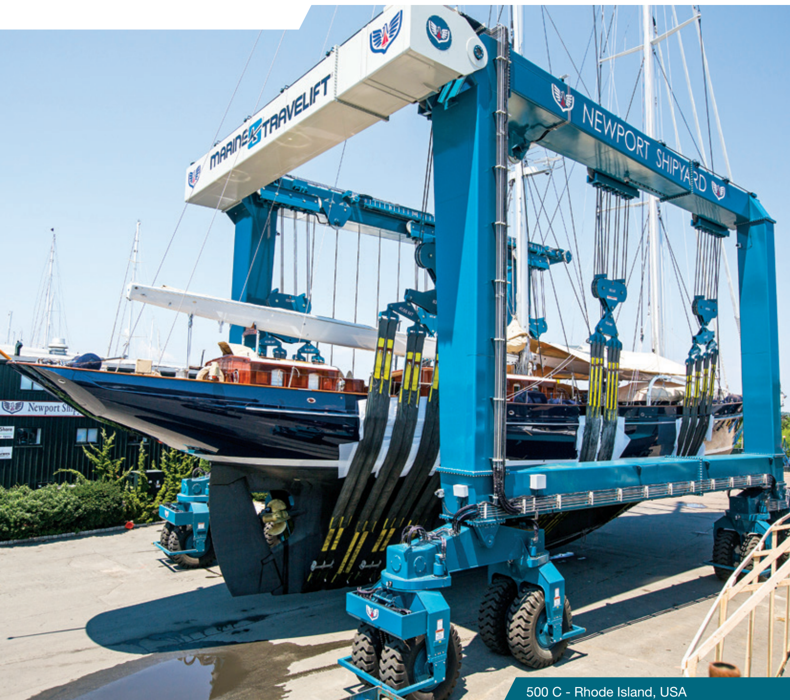
500 C - Rhode Island, USA