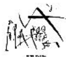
Logotip de la Fira de Benet Rossell

Així com també es convocava un concurs de cartells de la Fira. D'aquest concurs en sorgí i s'adoptà el que ha acabat sent el logotip de la fira, proposta de l'artista Benet Rossell.