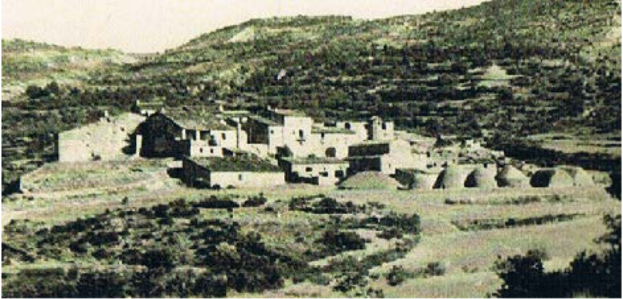
Blancafort ( Record de Blancafort. Un poble sota l'aigua. Eugeni Gesé)

a mercat. Primer amb mules i anys més tard amb el camió del Josepet de Vilamajor. Ara, quan hi penso, me'n faig creus. Tots carregats a la carrossa i cap a la plaça Mercadal”, assegura tot arronsant el cap. No l'entristeixen els records però sap que amb aquesta conversa està reobrint la caixa de la memòria, de les vivències, d'un passat inundat, ofegat sota l'aigua del pantà. Però un passat que flota entre converses i fotografies antigues.