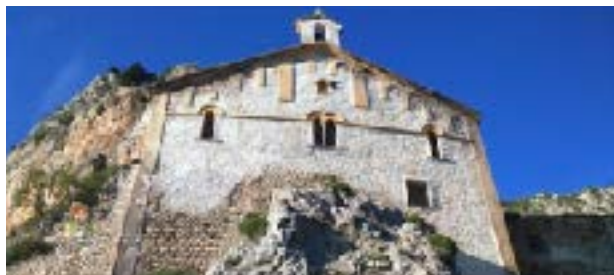
Salvem Pedra (Nació Lleida, 7/2/2016)

Sense cap mena de dubte són de pedra picada tots els que van contribuir a la restauració de Pedra, com ja ho havien estat tots els que cap el 1976 van salvar l'ermita de Cas. Però em pregunto: aquells que darrerament han fet perdre a Àger la documentació de la seva escola, de quin material podrien dir que són? Em ve a la memòria una dita popular "més desgraciats que el fang de fer orinals".