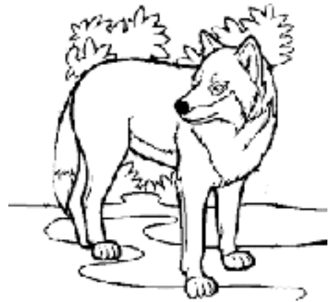
Llop per pintar