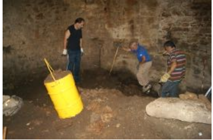
Pou de gel

Més enllà de la possible basílica paleocristiana avui ubicada sota el camí del Coll d'Ares, diverses excavacions arqueològiques han loca-