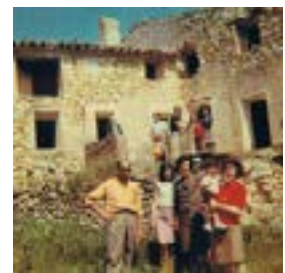
Casa Joaneta (Ídem)

El municipi de Tragó de Noguera aglutinava els pobles de Blancafort, Alberola i Boix