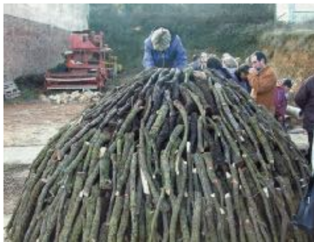
Carbonera de la Fira