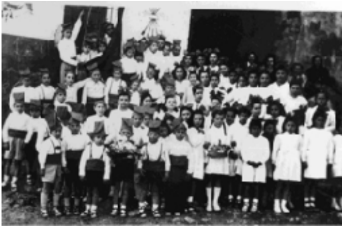
Vida quotidiana (Fons fotogràfic de l'Ajuntament d'Àger)