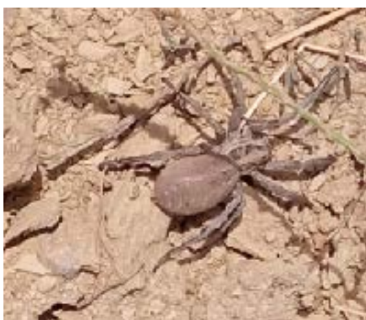
Taràntula agerença a la fuga

No us cal patir, ni la taràntula d'aquí depreda humans, ni el seu verí és mortífer. Diuen que la picada no és mes dolorosa que la d'una abella. També corria la llegenda que la picada d'aquest aràcnid, anomenat en honor de la ciutat de Taranto al Sud d'Itàlia -on n'hi deu haver moltes, pel que sembla- provocava en les seves víctimes unes convulsions, com si dansessin. La ciència, per desgràcia, ja ha refutat aquesta història popular. I és una pena, perquè per a la gent que li costa arrencar-se a ballar i es queden enganxats a la barra tota la nit, quan encara es feien festes majors, ho podrien solucionar amb una punxadeta. Jo, per si de cas, me miro els caus amb precaució i mai hi ficaré cap dit.