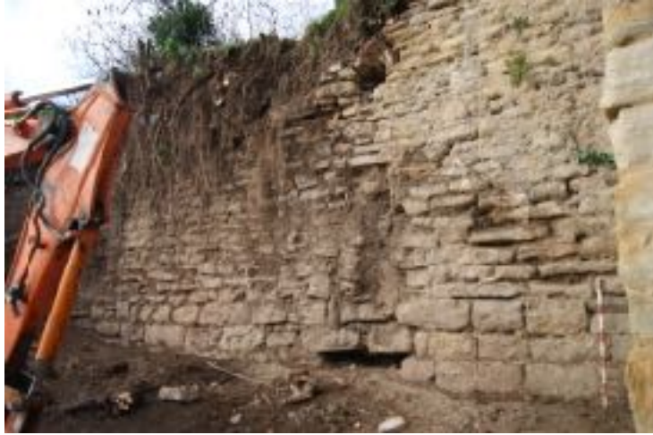
Muralla de Solsdevila

qual resta una incògnita. D'altra banda, els controls arqueològics de les obres al solar adjacent al portal de Sant Martí i al desmuntatge de Casa Xaparró, també al carrer Sant Martí, han aportat algunes dades que complementen la informació ja existent sobre el traçat de la muralla medieval, la seva construcció i els tipus de paraments emprats. L'actuació a la finca rompuda de Cisco de les Serres, al vessant sud de la Serra de Montelús, no ha aportat informació d'interès. En tot cas, és remarcable el fet mateix que s'inclogui el control arqueològic en el marc de les obres de caràcter privat.