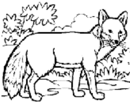
Guineu per pintar