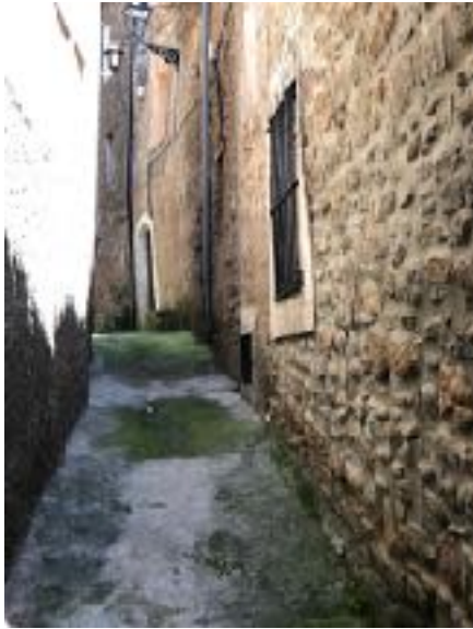
C/ Llari ara Travessera Canuda