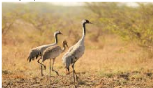
Això sí que és una grua, i no la del seguro

tes que recorden. A la cua, aprofitant el solc aerodinàmic obert pel cap de formació, van els joves -fixant-se en cada detall, memoritzant bé aquell recorregut, i mentrestant segurament preguntant “Falta molt? Falta molt?- i els vells, que ja van ensenyar aquell camí ancestral tantes voltes viatjat, i que potser enguany ja no acabaran.