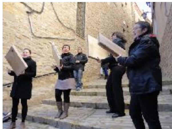
Tornaren amb Tornaveus les "Cançons de pandero" (18a edició, 2014)

de format proper i íntim amb músics destacats del panorama musical actual català. Inicialment s'encetaren les actuacions al bar-restaurant Lo Poble i posteriorment es traslladaren al local social. Tot per pur gaudi i amor a la cultura, a la Fira d'Àger i a la Vall.