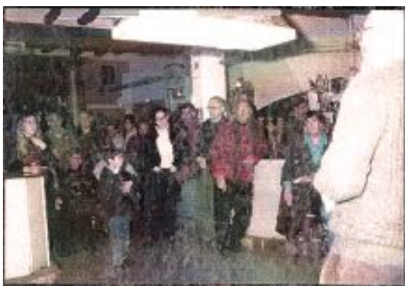
Primer recital poètic (Porcellada) al Speed Bar (1998)

L'altre element cultural destacat i singular que emergí en la segona edició de la Fira va ser l'aparició de la presentació del Cafè Central, la videopoesia i la lectura de poemes que amb el temps prengué un format de Cabaret Literari on s'anaren succeïnt diferents poetes d'alta vàlua literària, músics, trobadors, i en ocasions participants autòctons que any rere any no faltaven a la cita. Esdevenint així un dels Recitals Poètics més antics que es conserven a Catalunya conegut amb el nom de Porcellada .