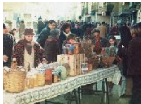
1a edició Fira d'Àger any 1997 Expositor productes de la Vall

Es celebraren també dos concursos: un concurs en què es guardonava al millor expositor i un altre de pintura on hi participaven artistes locals. Es va cloure la diada amb una conferència a càrrec de Dolores Sistac sobre les