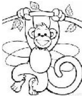
Primat per pintar