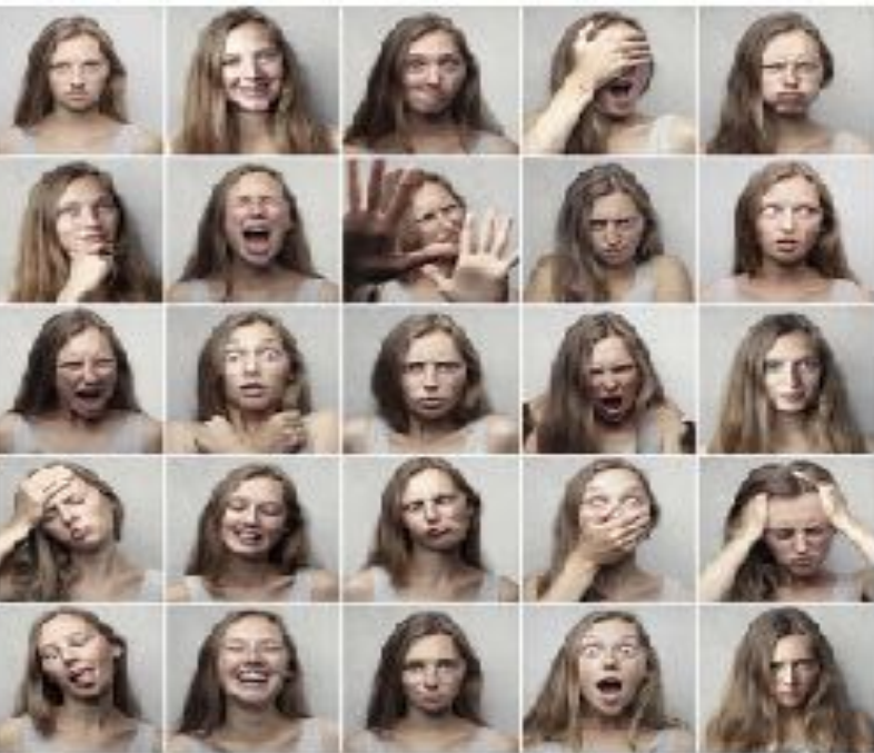
Expressions d'emocions