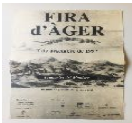
Cartell 1a edició Fira d'Àger any 1997

El dia 7 de desembre de 1997 es celebrà el retorn de la diada de la Fira amb uns 38 expositors encapçalats per una parada que donava la benvinguda als visitants obsequiant-los amb una degustació de pa amb mel, nous i vi. A més a més al pati de l'escola s'hi va muntar el "Mercat de Bestiar" amb la presència de bestiar boví, galls d'indi, oques i cries de paó. A causa de la pesta porcina no es va poder exposar un porc senglar i els porcells, un element identificatiu de la Fira d'Àger. Les primeres fires es caracteritzaven per tenir una altíssima representació d'agerencs i agerenques en els expositors, on s'hi mostraven diferents productes elaborats per les mestresses de la Vall, la recol·lecció d'herbes medicinals entre d'altres productes