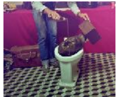
Contracultura i Festa Major (Carli Suárez)

El 1990, abans de complir el 40 anys, va morir fruit d'un infart. Des de llavors, ha rebut homenatges. Una plaça a la Vila de Gràcia (Barcelona) amb el seu nom. Diverses generacions de músics l'han fet seu. L'han revisitat. La seva influència és extraordinària. Com