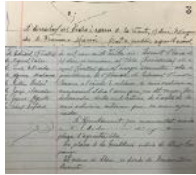
Acta de l'Ajuntament

En la sessió plenària de 20 de desembre es decidia canviar el nom de tres carrers de la