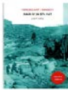
Portada del llibre

der expressar els seus sentiments. Ell mateix ens ho diu: