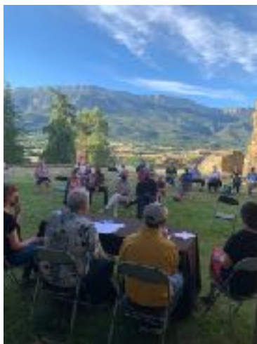
Presentació del núm. 16